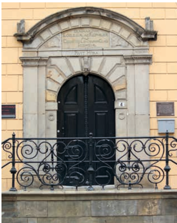
8. Gerrit Lambertsen van Cuilenborch, zandstenen ingangspartij van de Latijnse school in Kampen uit 1631