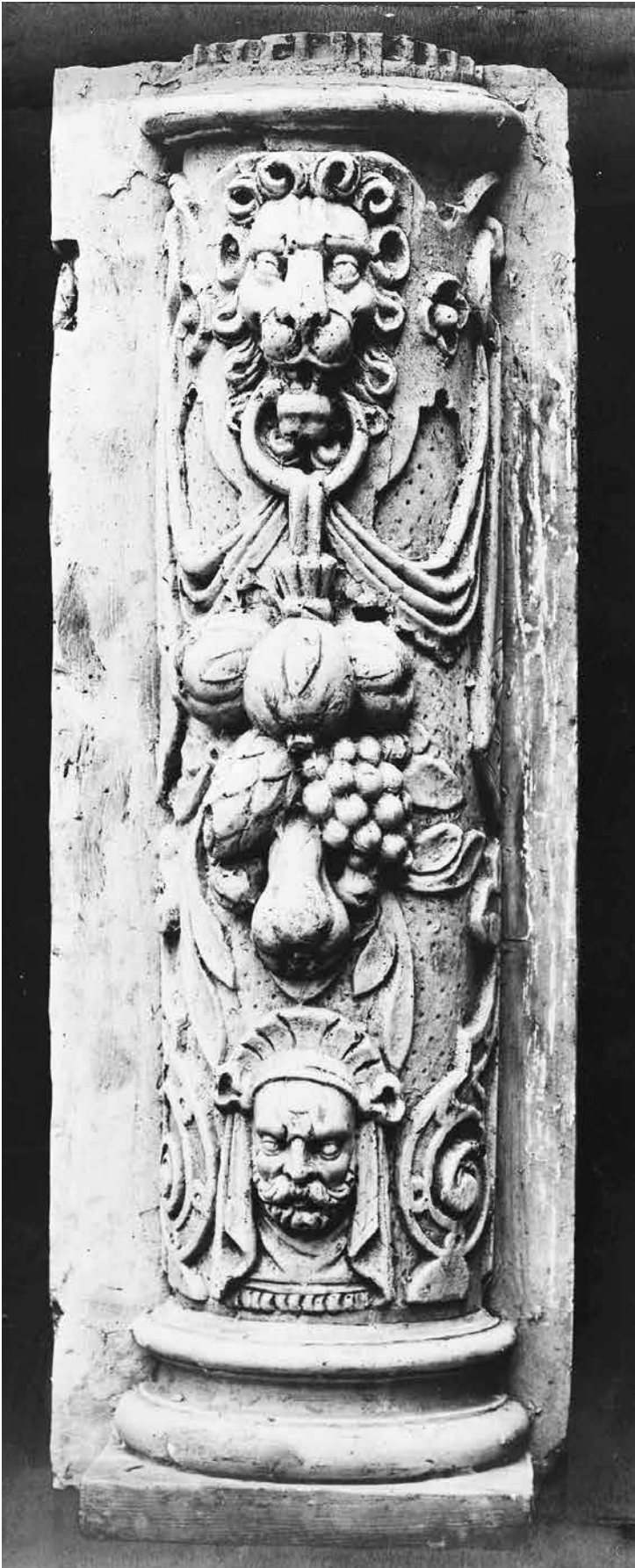
21. Kolomvoet met leeuwenkop, vruchtenslinger en mascarón, destijds aanwezig in het stadhuis van Zwolle

we Markt/Sassenstraat 37 uit 1647 (afb. 20). De expressie van de leeuwen met hun platte, rechthoekige neuzen en gefronste voorhoofden is identiek, evenals het bijzondere detail van de ringen met vruchtenslinger in hun bek. Een vergelijkbare leeuwenkop met ring en vruchtenslinger was frontaal aangebracht op de voet van een klassieke colonnet, die zich destijds in het stadhuis van Zwolle bevond (afb. 21). 40