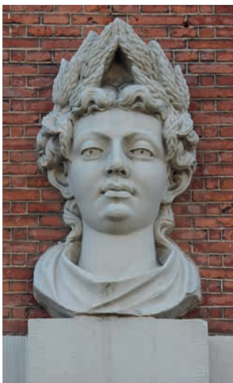
17. Twee hoofden van het 'Huis met de Hoofden', Keizersgracht 123 Amsterdam uit 1622: a. Ceres; b. Bacchus. Atelier van Hendrick de Keyser