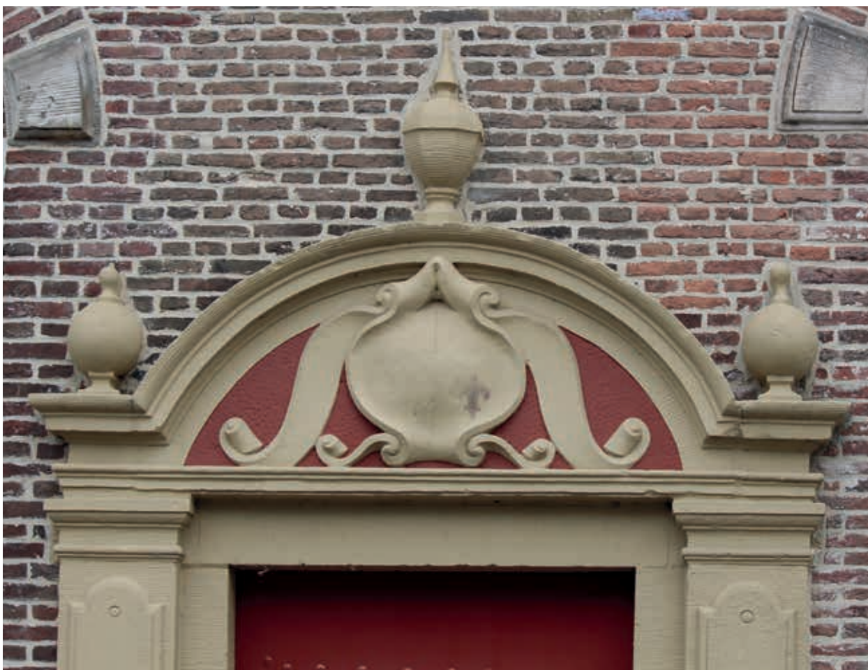
10. Bekroning van het ingangspoortje van Nieuwe Markt 8 in Kampen, waarschijnlijk behorend tot de doelen en uitgevoerd door Gerrit Lambertsen van Cuilenborch