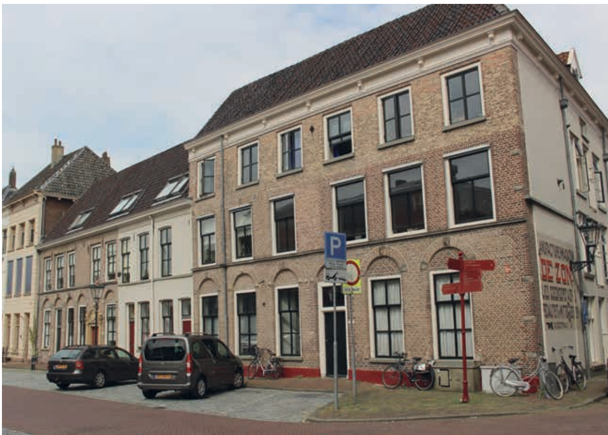
9. Noordzijde van de Nieuwe Markt in Kampen met het langgerekte gebouw dat oorspronkelijk de functie van doelen gehad kan hebben. De vensters op de begane grond worden gedekt door bogen, die van de verdieping met strekken