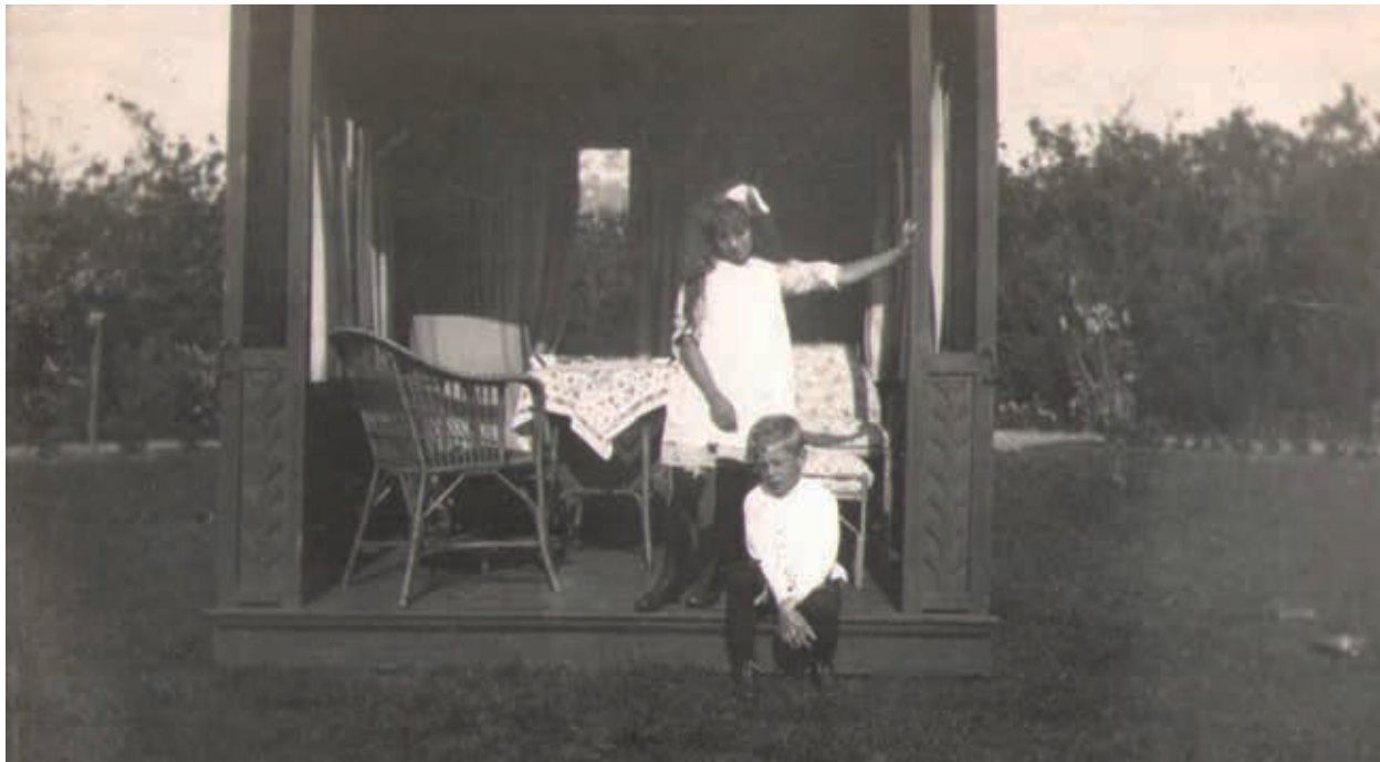
13. Een draaibaar houten huisje in de tuin biedt speelplezier aan de kinderen, ca. 1915

zitkamer versterkt de Arts and Crafts invloed in de plattegrond (afb. 11). De Engelse 'nook', en niet een Hollandse haard, is in het huis het centrale element waar de bewoners op een intieme wijze bij elkaar kunnen zijn. Hiermee benadrukt Van 't Hoff dat het gezinsleven centraal staat. 35 Deze 'nook', een brede nis met de haardplaats ter zijde van een grotere ruimte, is zo ruim dat er gemakkelijk twee volwassenen of enkele kinderen op een stoel bij kunnen zitten. Het venster in een van de zijwanden vergroot de mogelijkheid tot lezen of handwerken. De geglazuurde tegels van de achterwand zijn versierd met gestileerde florale motieven. Ze doen eigentijds aan, maar tegelijk wekken ze associaties met historische tegels, bijvoorbeeld de Delfts blauwe tegels met hoekmotieven die de Delftse hoogleraar Karel Sluyterman in studies van oud-Hollandse interieurs tekende. 36 Door het verlaagde plafond bij de toegang tot de zit- en eetkamer ontstaat een ruimtelijk effect, waarbij een bezoeker komend uit de vrij donkere hal en gang eerst in een kleine voorruimte komt, een nis, en dan pas in het hogere deel met de lichte erker, die op de zichtas ligt. Het trappenhuis wordt gekarakteriseerd door een tussenbordes, dat via enkele treden toegang geeft tot de badkamer rechts en de gang naar de slaapkamer links.