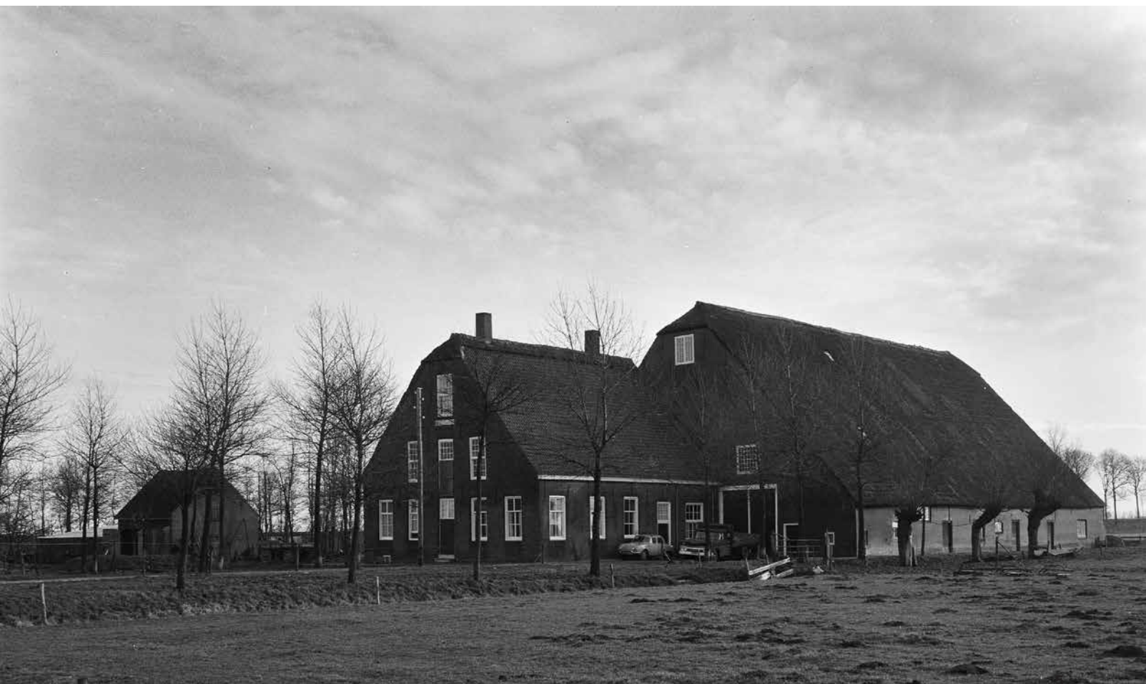
5. Hoeve Portlandt, Rhoon, omstreeks 1966. Architect Robert van 't Hoff maakte tijdens zijn studiejaren in 1906-1914 opmetings-tekeningen van het gebouw. Hiermee vergrootte hij zijn kennis van landelijke architectuur