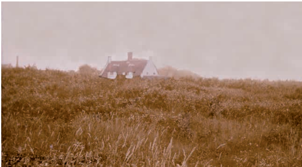
3. Landhuis De Hoeve, net na de oplevering, ca. 1915. Het landhuis sluit door de regionale bouwwijze aan bij de omgeving

aansloot op de belangrijkste noord-zuidverbinding, de Voorstraat. De goede tramverbinding tussen Noordwijk en Leiden was belangrijk voor de uitgever, die geen auto bezat. 8