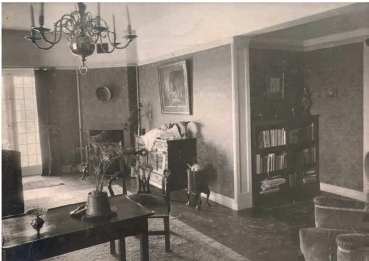
10. De zitkamer heeft via terrasdeuren toegang tot de tuin. Van 't Hoff varieerde met verdiepingshoogtes in de entree met verlaagd plafond, ca. 1915