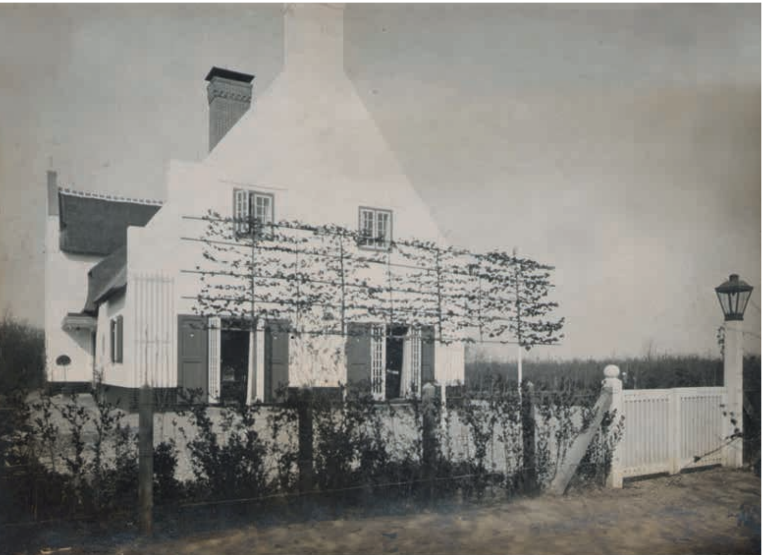
12. Kopgevel met de aanplant van leilinden bij het terras en de straatgevel (links) aan de Gooweg, net na de oplevering, ca. 1915

De toepassing van de opvallende 'inglenook' in de