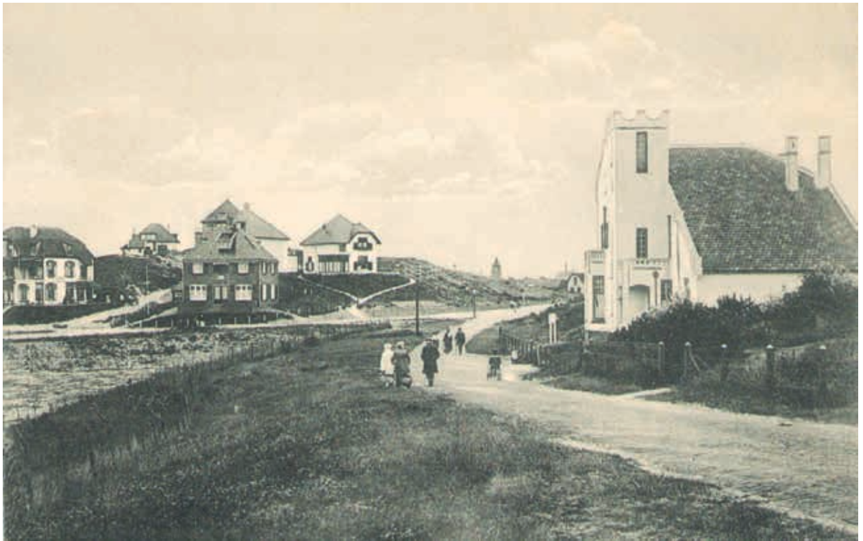
4. Bebouwing in Noordwijk aan Zee, omstreeks begin twintigste eeuw. De woonhuizen zijn prominent op de duinen gebouwd. De onderlinge verschillen in oriëntatie, volume en detaillering benadrukken de individualiteit van de woonhuizen

vorm van een ongewenste kakofonie van stijlen en zonder een samenhangend stedenbouwkundig kader (afb. 4). 15