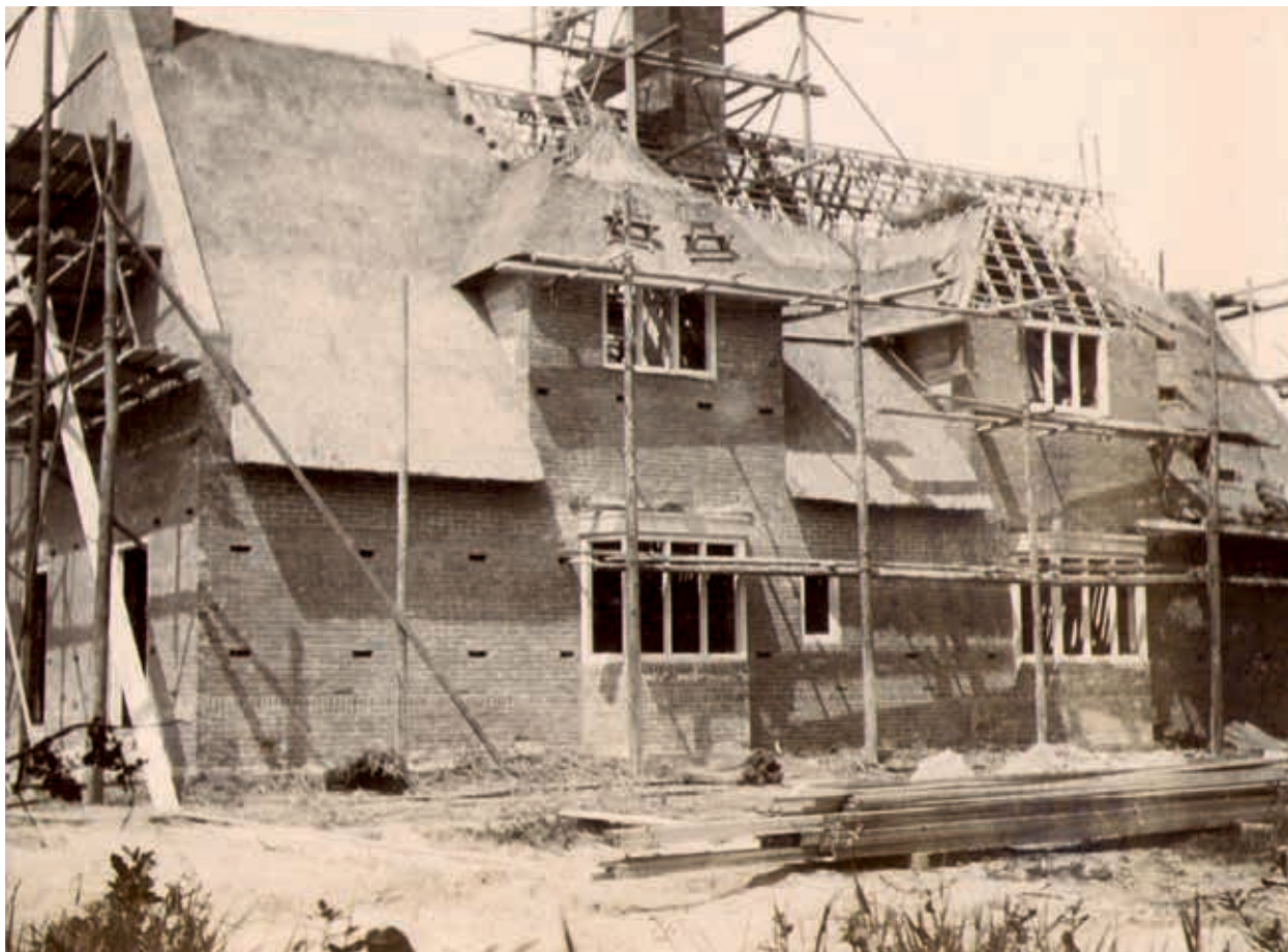
7. Landhuis De Hoeve, bouwfoto, 1913. Uitvoering in een traditionele bouwwijze, opgemetseld uit baksteen en afgedekt met een rieten kap