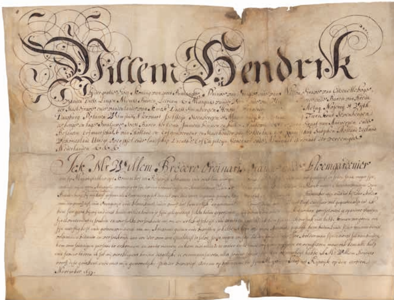
3. Attestatie van Jan Kolderman (Archivalia Vereniging tot beoefening van Overijsselsch Regt en Geschiedenis)

huijsinge van de deposant 11 zijn vader zaliger alle de orangeboomen op vier nae [...] den selve wintertijt sijn doot bevrooren, ende niet alleen die voornoemde orange boomen [...], maer alle de boomen van wat natuij r . 12