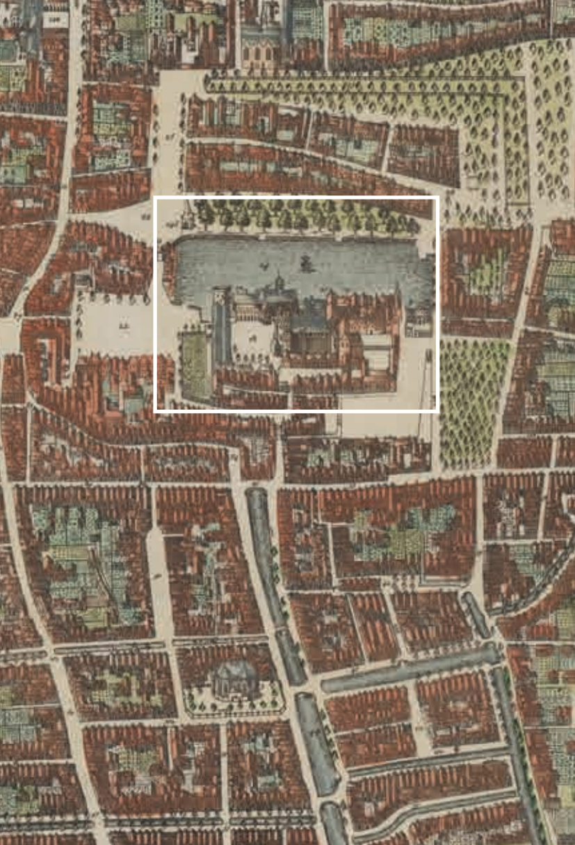
4. Detail van een plattegrond van Den Haag uit 1666 met linksonder de tuinen op de Cingel. Afbeelding van 's Gravenhage In haar Platte Grond Gemeeten en in 't Koper gemaakt door C.E. En nieuwlyks , uitgegeven door Carel Allard (Haags Gemeentearchief)

venier zag als iemand met grote kennis van het opkweken en verzorgen van planten en het enten van bomen en niet van het maken van tuinontwerpen. 21 De modellen voor parterres, bloemperken en latwerken in zijn boek zijn ook overgenomen uit bestaande literatuur en niet van eigen hand. 22 Daar staat tegenover dat Van der Groen wel op de hoogte was van de bekendste hofdichten uit zijn tijd en dat hij een zekere kennis had van de historische ontwikkeling van 'lusthoven', aangezien hij in de inleiding van zijn boek hierbij stilstaat. Hij noemt ook diverse buitens in de Nederlanden en ook in Frankrijk, die hij waarschijnlijk kende van afbeeldingen, en sommige tuinen in en om Den Haag, wellicht uit eigen ervaring. In hoeverre ook de andere stadhoudelijke hoveniers over dergelijke kennis beschikten is de vraag. Er zijn in ieder geval weinig aanwijzingen voor.