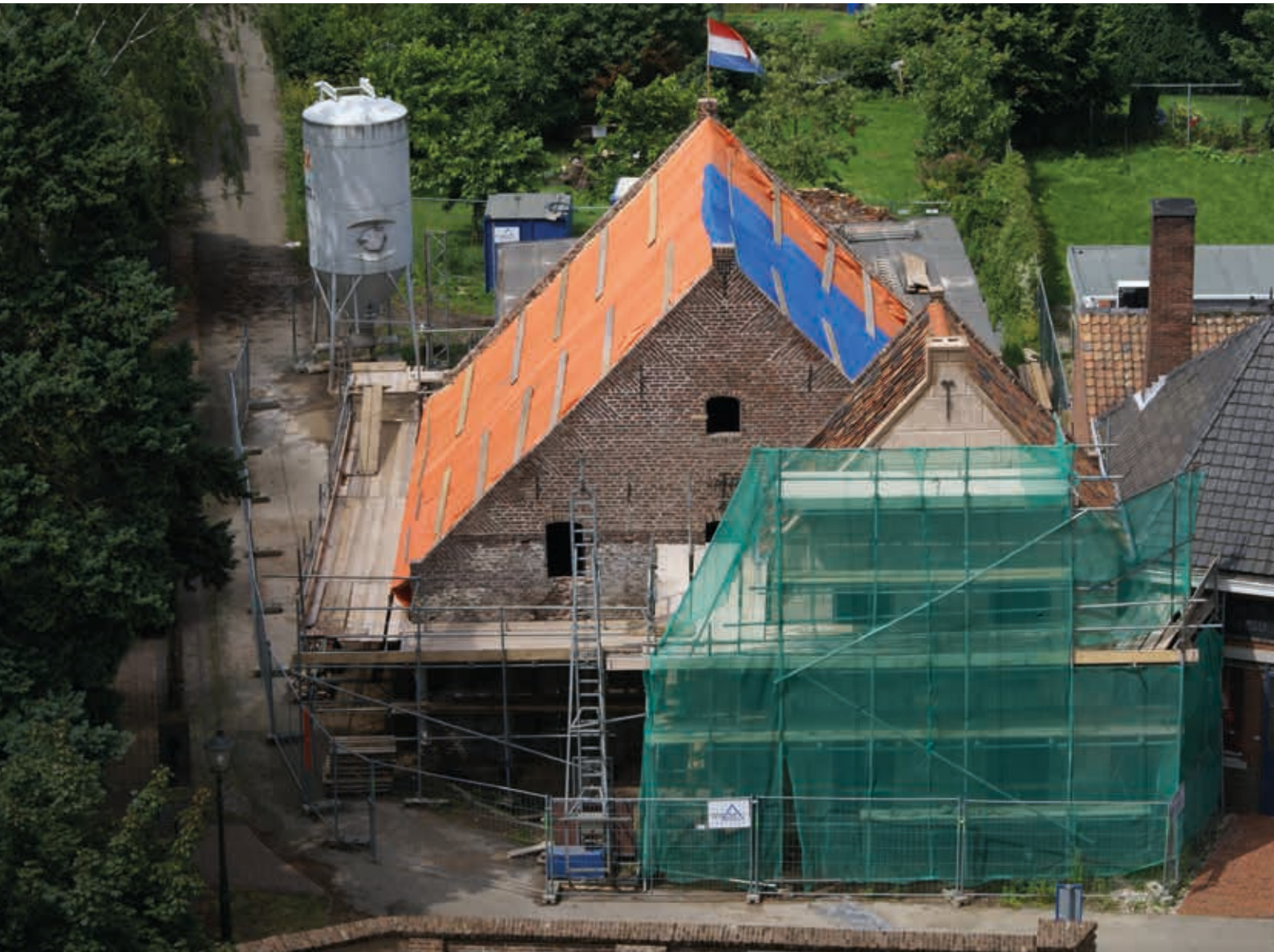
14. Kranenbreukershuis, Hoekstraat 6 in Tegelen, tijdens de restauratie in 2012

pand. Behoud door ontwikkeling staat tenslotte voorop. 71 Het Kranenbreukershuis – oorspronkelijk een brouwerij en woonhuis – heeft daarom ook een woon- en werkfunctie gekregen. Bij het opstellen van de restauratieplannen wordt tevens gekeken naar de omgeving. Het gebouw is niet los te zien van zijn omgeving en deze omgeving vertelt iets over het ontstaan van het gebouw. 72 De historische gelaagdheid wordt zo veel mogelijk gerespecteerd; bouwhistorisch onderzoek ligt hieraan ten grondslag. Per pand, maar soms ook per kamer, wordt bekeken hoe de best herkenbare eenheid kan worden gerealiseerd en dat is niet automatisch de oudste situatie. Vaak speelt kleuronderzoek hierbij een grote rol. Bij restauratie wordt alleen historisch materiaal vervangen dat daadwerkelijk aan vervanging toe is: behoud gaat voor vernieuwing. Nieuwe ingrepen en toevoegingen moeten verder reiken dan