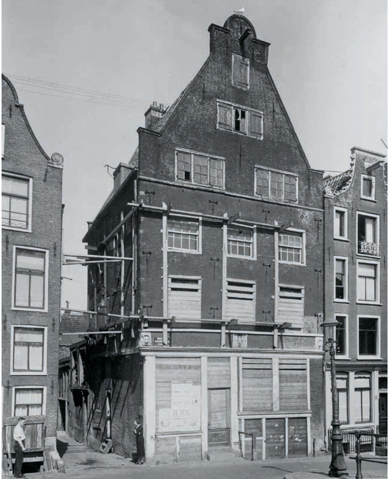
7. Huis 'In het wapen van Riga', Oudezijds Voorburgwal 14 in Amsterdam, voor start van de restauratie in 1940

zouden werken en algehele restauraties niet mogelijk zouden zijn. 43 Desondanks werd juist bij het herstel van veel door oorlog verwoeste steden voor een reconstruerende aanpak gekozen. 44 Hoewel de modernistische idealen na de oorlog verder voet aan de grond kregen in Nederland, zette de vereniging de manier van restaureren 'in oude luister' door. 45 Dit zorgde in 1953 voor een botsing tussen de Rijksdienst (voorheen Rijksbureau) voor de Monumentenzorg en Vereniging Hendrick de Keyser.