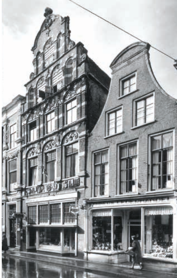
3. Sint Jacobsstraat 13 in Leeuwarden (middelste pand), met 'moderne' pui na de restauratie van 1928, foto G.Th. Delemarre, 1957 (Rijksdienst voor het Cultureel Erfgoed)

In 1931 werd Kok opgevolgd door J. de Meijer (1872-1950) als huisarchitect van Vereniging Hendrick de Keyser. 29 J. Gratama (1877-1947) verving Kok in het dagelijks bestuur. Vanaf dat moment ging het roer om bij restauraties. De Meijer en Gratama wilden de Hollandse bouwkunst in ere herstellen. Zij waren in tegenstelling tot Kok aanhangers van een traditionele bouwstijl, waarbij ze zochten naar de oorspronkelijke