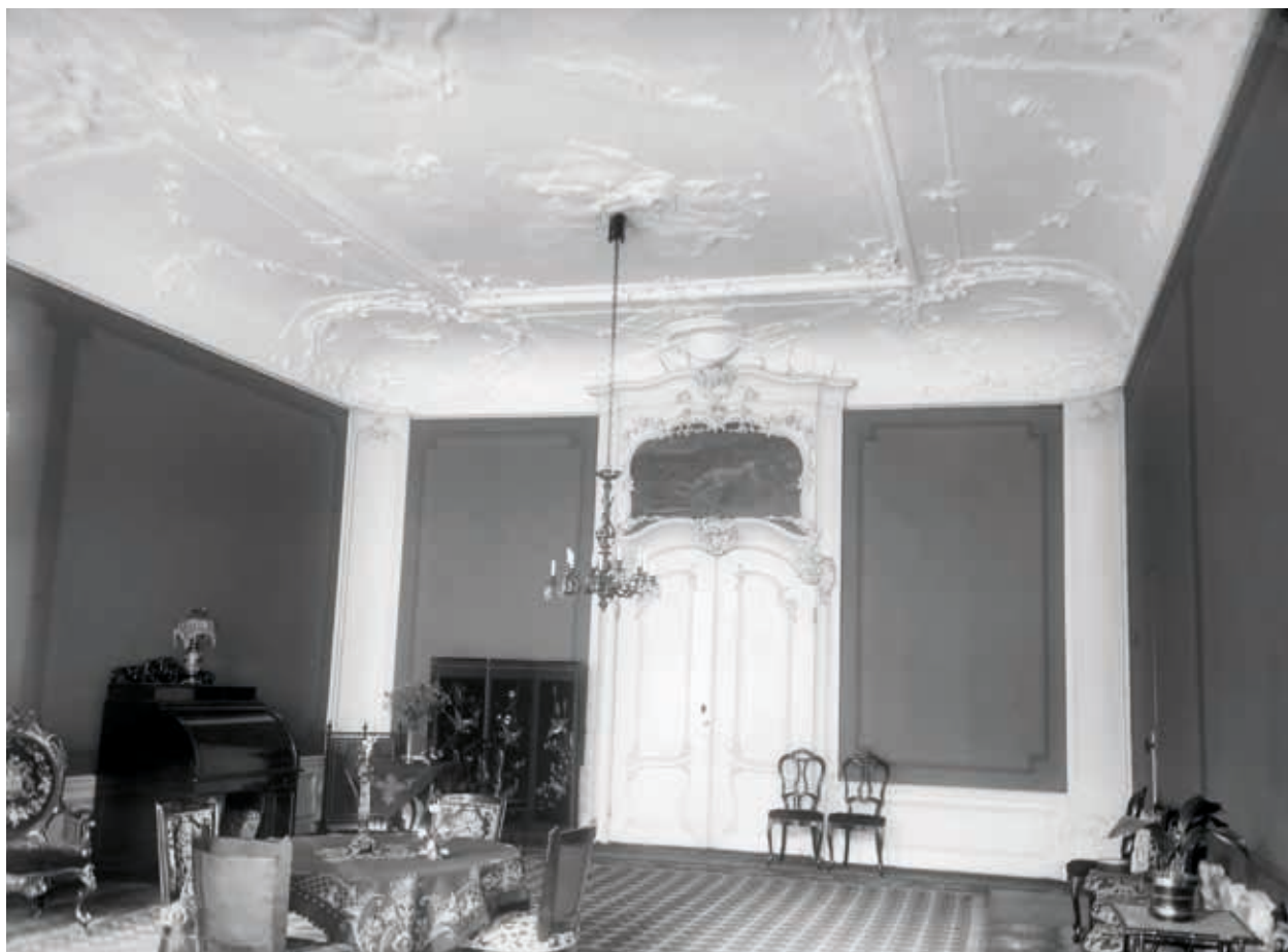
12. 'De Onbeschaamde', Wijnstraat 123-125 in Dordrecht, opname uit 1910 met het Lodewijk xv interieur van de zaal