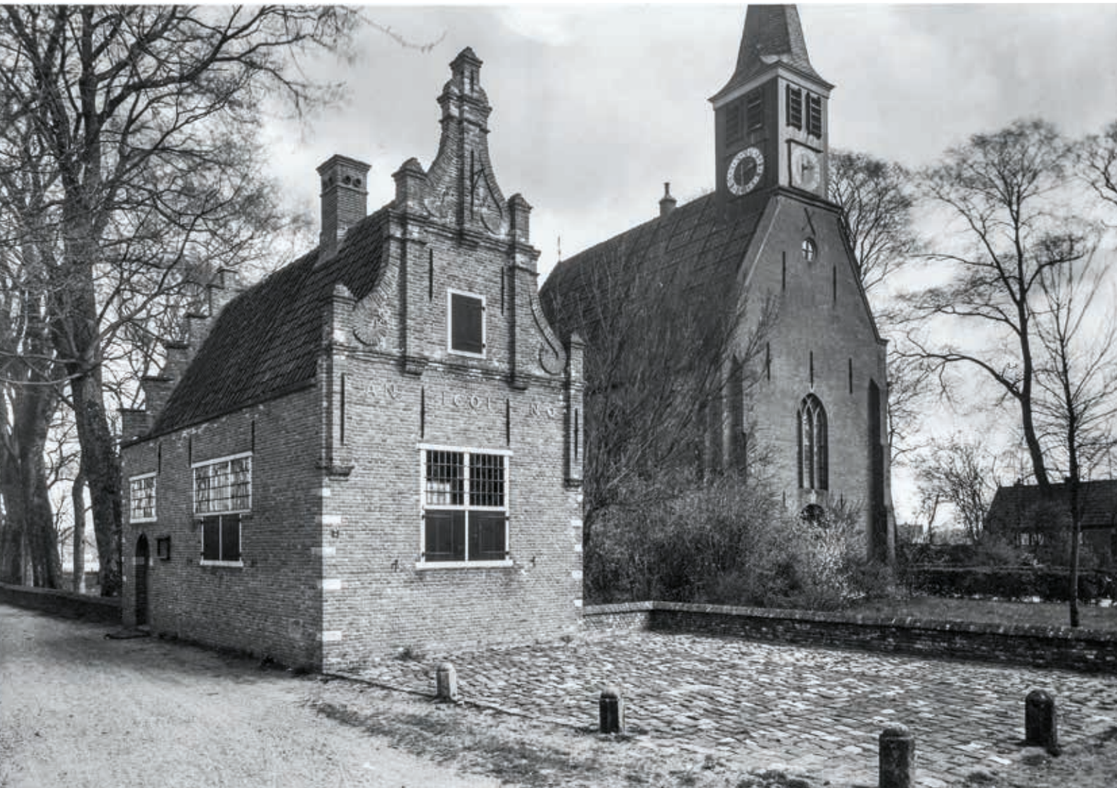
6. Duinweg 3 in Schoorl, raadhuis na restauratie in 1931. Het pand werd tien meter verplaatst voor verbreding van de Duinweg