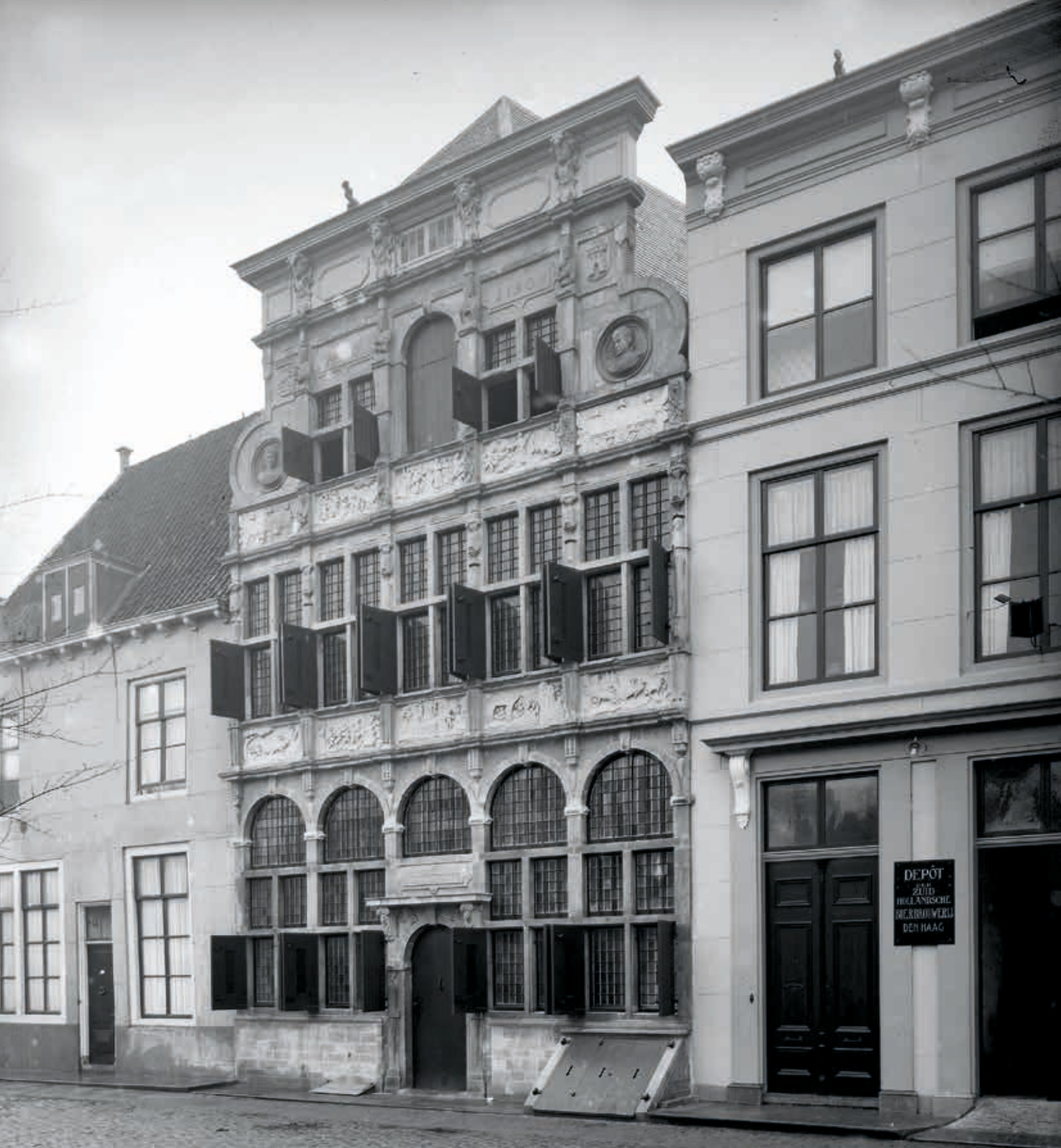
2. Huis 'In de Steenrotse' in Middelburg, na restauratie in 1921, verwoest bij het bombardement in 1940