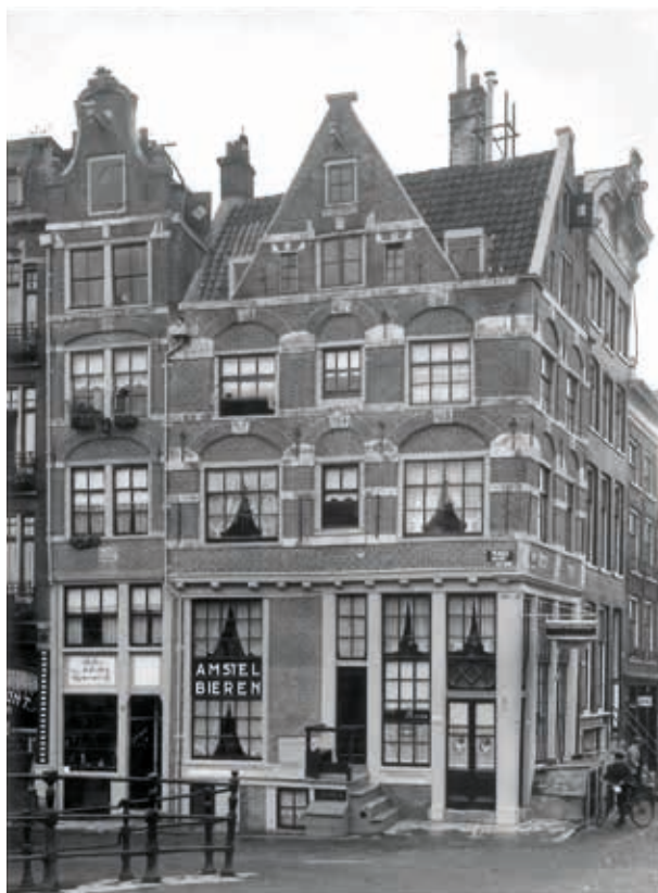
4. Prinsengracht 2-4, hoek Brouwersgracht in Amsterdam, voor restauratie in 1955