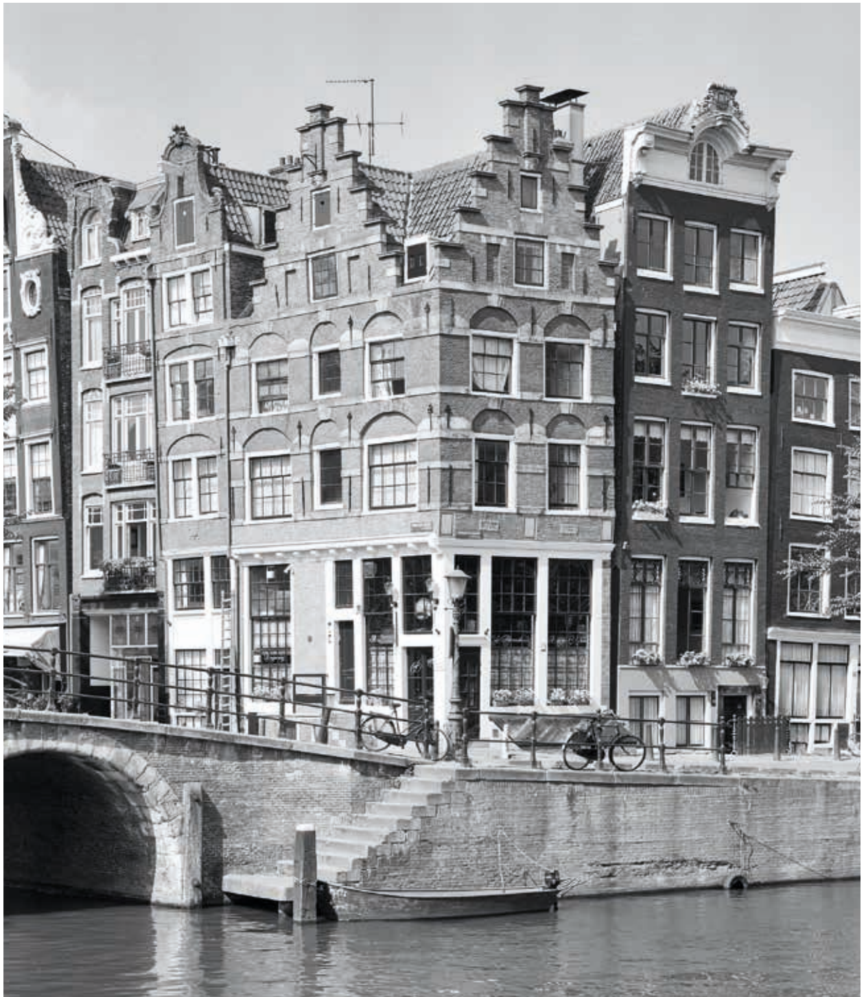
9. Prinsengracht 2-4, hoek Brouwersgracht in Amsterdam, na restauratie in 1955-1956