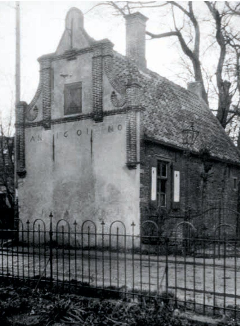
5. Duinweg 3 in Schoorl, raadhuis voor restauratie in 1931 (Vereniging Hendrick de Keyser)

uitstraling van het gebouw. Het verlangen naar een nationale architectuur zorgde bij de vereniging voor een grote waardering voor met name de architectuur uit de Gouden Eeuw. 30