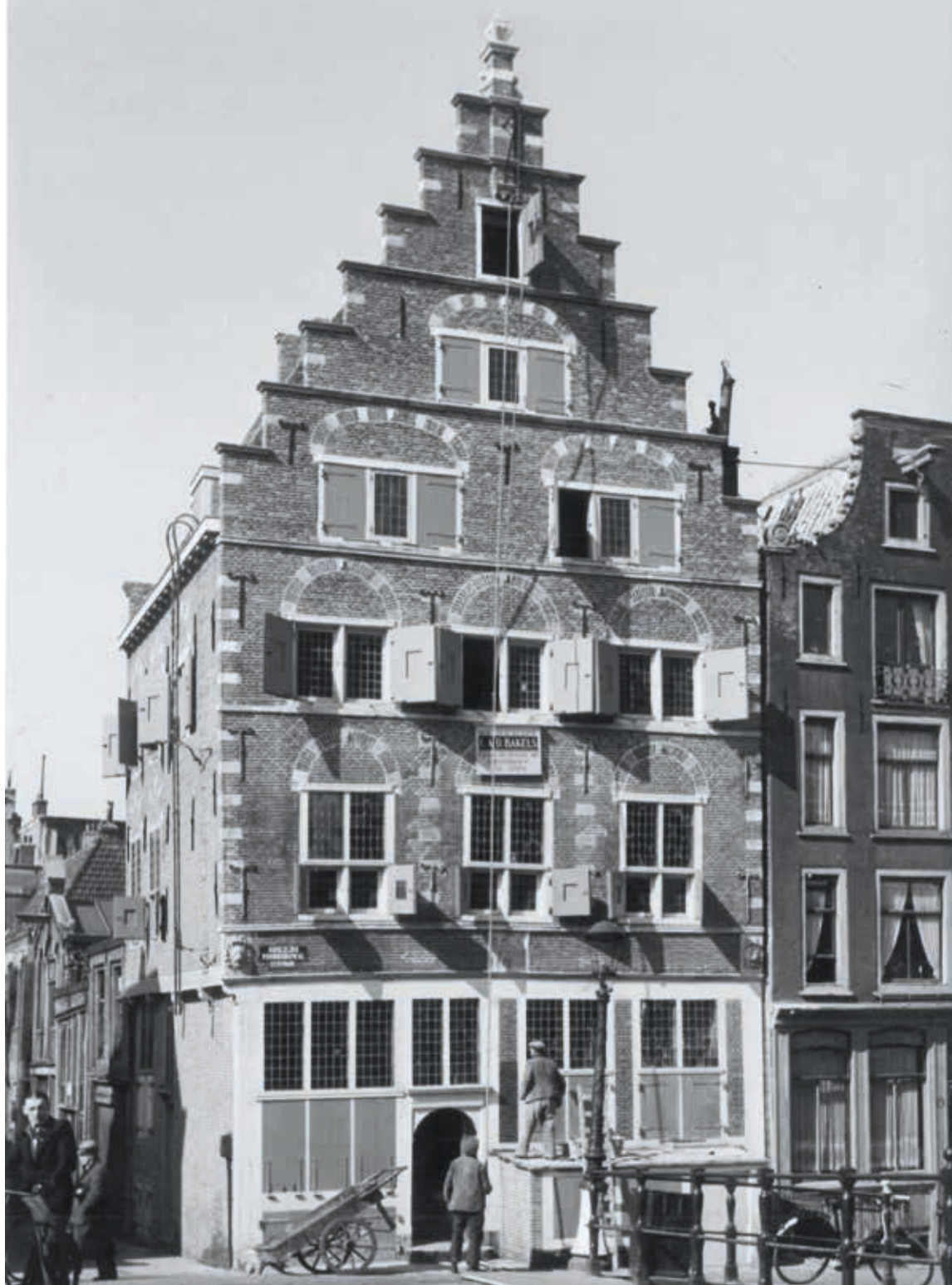
8. Huis 'In het wapen van Riga', Oudezijds Voorburgwal 14 in Amsterdam, na restauratie en reconstructie van de trapgevel in 1940, foto W.H.J. van der Randen, 1942 (Nationaal Archief/Collectie Spaarnestad)

lijke toestand van een huis zoveel mogelijk te herstellen. 46 In 1954 koos het bestuur van de vereniging na overleg met de Rijksdienst voor het consolideren van de gevel van het Karel v-huis in Zwolle in plaats van voor reconstructie. De met de opdracht belaste architect, A.R. Wittop Koning (1878-1961), kon zich hier echter niet in vinden en trok zich terug. Architect J.W. Dinger (1891-1986) nam de restauratie over. 47 Dinger was tevens verantwoordelijk voor de restauratie van Brouwersgracht 218 in Amsterdam, waar hij niet koos voor