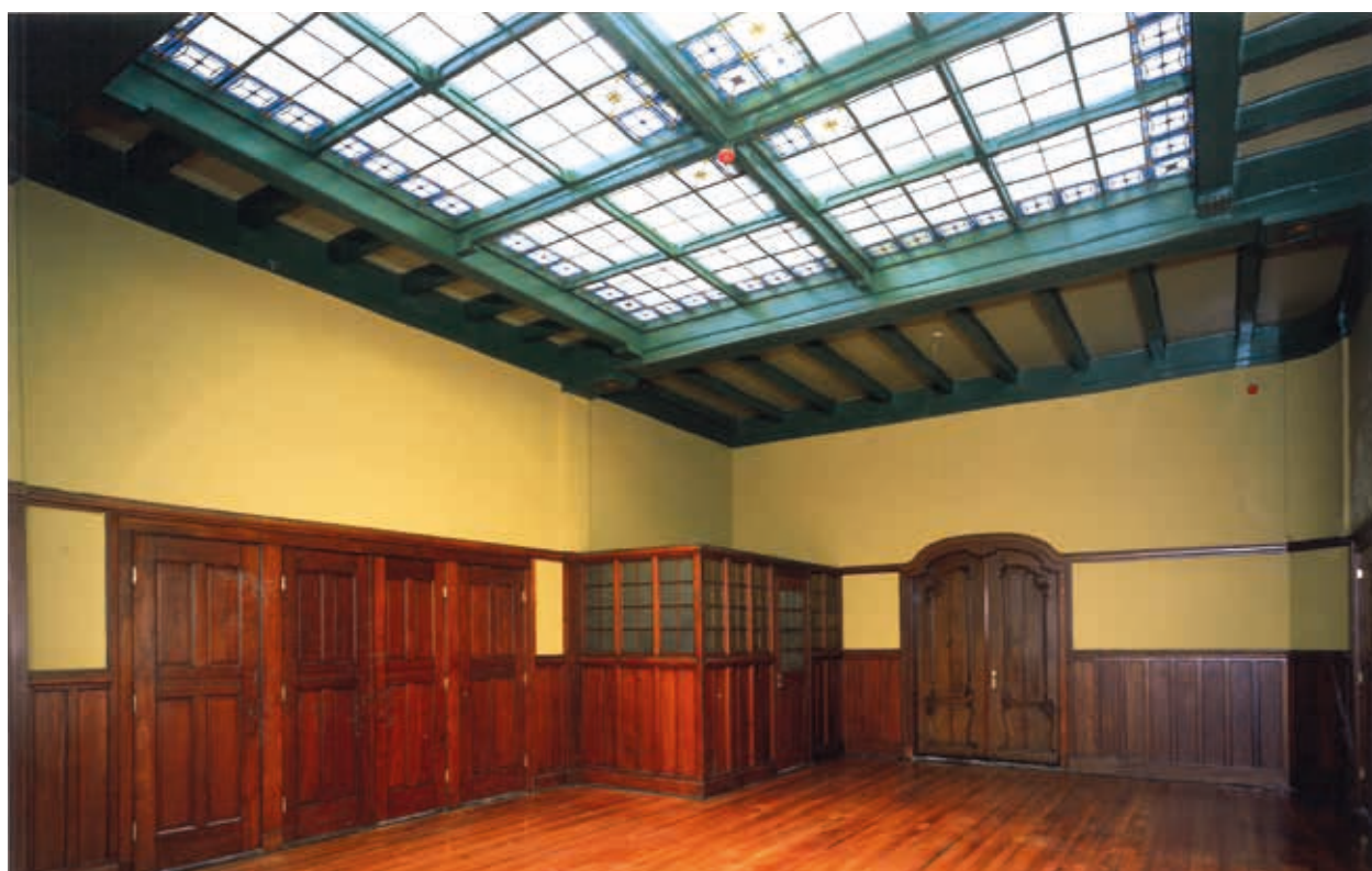
13. 'De Onbeschaamde', Wijnstraat 123-125 in Dordrecht, Van Bilderbeekzaal na restauratie in 1996