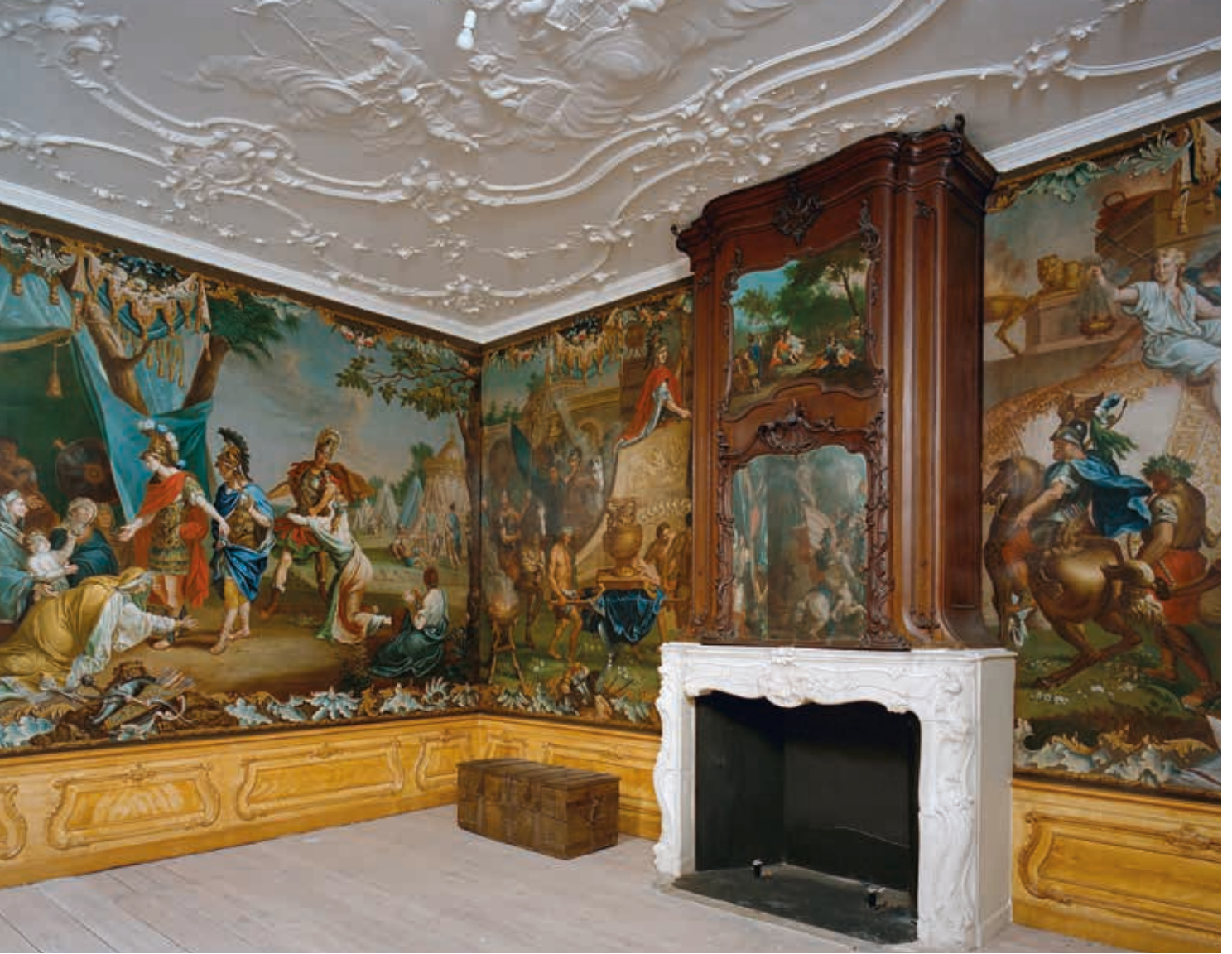
11. Voormalig burgerweeshuis, Bovenbeekstraat 21 in Arnhem, gerestaureerde schilderijen van de voorkamer, foto P. van Gaalen, 1996 (Rijksdienst voor het Cultureel Erfgoed)

pand werden gerespecteerd. Ook vond de Rijksdienst dat het plan het interieur op 'voorbeeldige wijze' respecteerde. 65