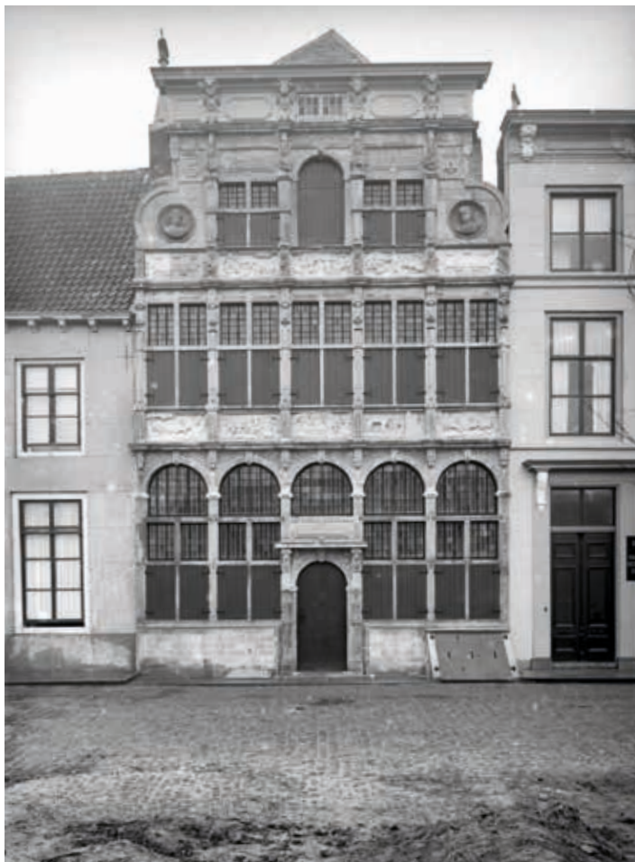
2. Middelburg, huis 'In de Steenrotse'

op 13 juni, was de situatie dramatisch veranderd. Nederland was inmiddels militair verslagen en de Duitse bezetting begon gestalte te krijgen, maar vooral de militaire strijd en de bombardementen op Rotterdam en Middelburg waren aanleiding om een en ander te bespreken. De bestuursleden stonden stil bij de gevolgen van het militaire geweld en van de bombardementen, voor zover merkbaar in het huizenbezit van de vereniging. Omdat Vereniging Hendrick de Keyser geen panden in Rotterdam bezat, was daar ook geen schade aan eigen bezit te betreuren; enigszins laconiek werd wel opgemerkt dat het achttiende-eeuwse pand Nieuwe Haven 89 in Rotterdam, dat juist nu verworven zou worden, door het bombardement was vernietigd, 'zoodat deze zaak zich zelve heeft afgedaan'. 1 Het bombardement op Middelburg op 17 mei had het historische centrum nagenoeg weggevaagd, een lot dat ook verschillende huizen van de vereniging trof: twee panden (aan de Lange Delft respectievelijk Rotterdamse Kaai) waren geheel verwoest, en het laatzestiende-eeuwse huis 'In de Steenrotse' was zeer zwaar beschadigd (afb. 2). Herstel was misschien niet uitgesloten, zo besprak men, en brokstukken van het ingestorte pand waren al verzameld (afb. 1). Toch is dat er uiteindelijk