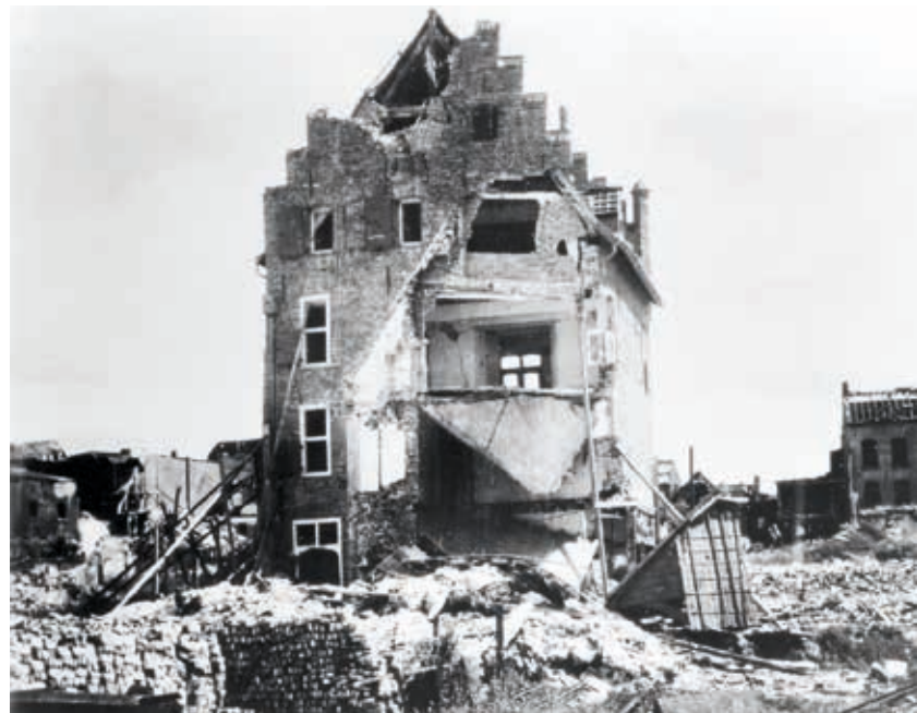
3. Venlo, 'Romerhuis' na het bombardement in 1944