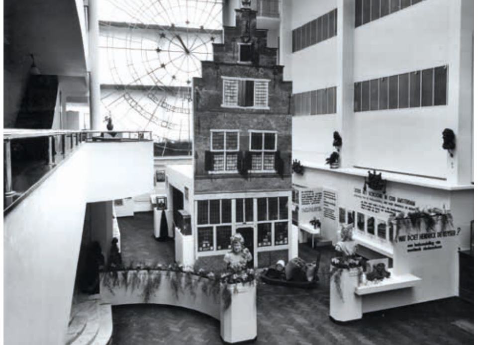
5. De Bijenkorf Amsterdam, tentoonstelling Vereniging Hendrick de Keyser, 1944