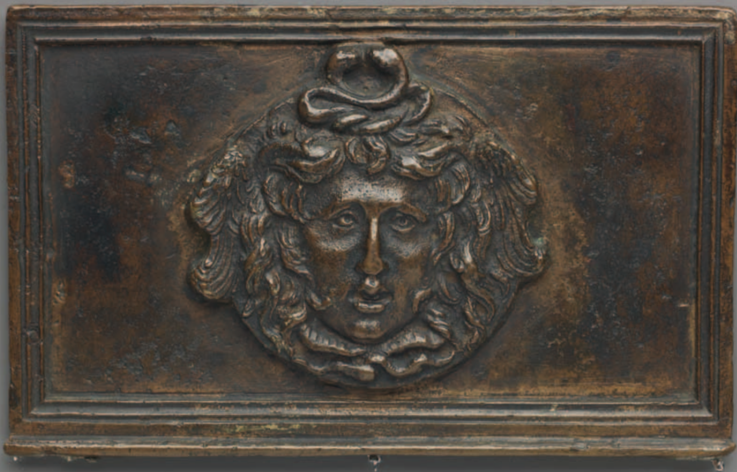
7. Severo Calzetta da Ravenna (toegeschreven), bronzen plaquette met Medusa, eerste helft vijftiende eeuw, Metropolitan Museum, New York

een voor de Medusa, en twee voor de belendende delen van een festoen, aan beide kanten van de tronie. Tezamen vormen deze één voorwerp. Het is te zien dat het festoen de vorm heeft van een soort sjaal of doek, die één geheel vormt, tezamen met de tronie, en die, als betrof het een klassiek wijgeschenk, aan de wand is gehangen, met twee zichtbare borgen, namelijk de twee wandringen, en een onzichtbare borg voor het hoofd. Voor elk van deze vier bronzen voorwerpen zijn dezelfde gietmallen gebruikt.