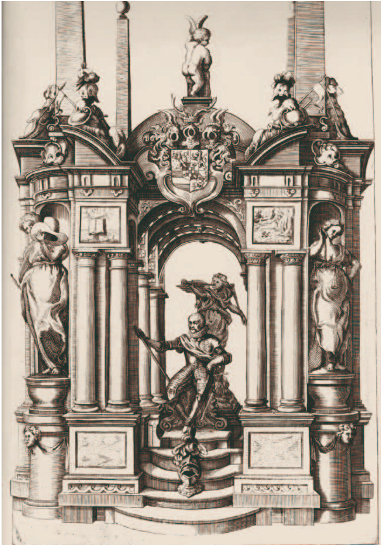
12. Cornelis Danckerts (plaat xxxix in: Architectura Moderna , 1631)