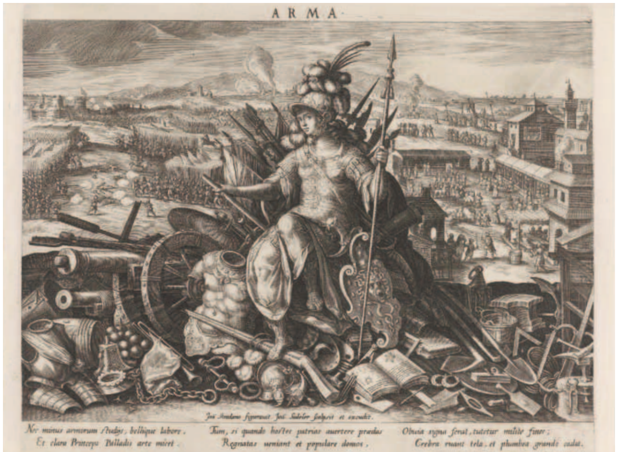
11. Jan de Sadeler, gravure naar Stradanus, Minerva , 1597