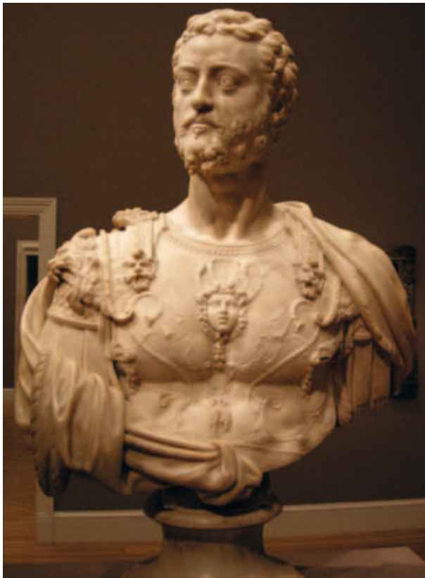
5. Benvenuto Cellini, buste van groothertog Cosimo I de Medici, 1545-1548, Museo Nazionale del Bargello, Florence

of borstpantser van groothertog Cosimo de Medici vormgaf alsmede de prominente Gorgo (afb.5). De 'schone Medusa' onderscheidt zich door de afwezigheid van de grimas (de vervaarlijke open mond), eerder een hangende mond, ook wel gesloten, de serene of ietwat droevige ogen, en dikke haarstrengen eerder dan slangen. De onder de kin vastgeknoopte staarten zijn wel aanwezig en vaak is de Medusa voorzien van twee vleugels boven of achter het hoofd, die de vleugels van