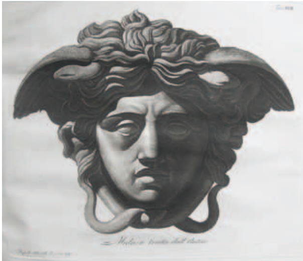
4. Medusa van het type Rondanini (in: G. Albertolli, Miscellanea per i giovani studiosi del disegno pubblicata da Giocondo Albertolli , Milaan 1796, tav. XVII)