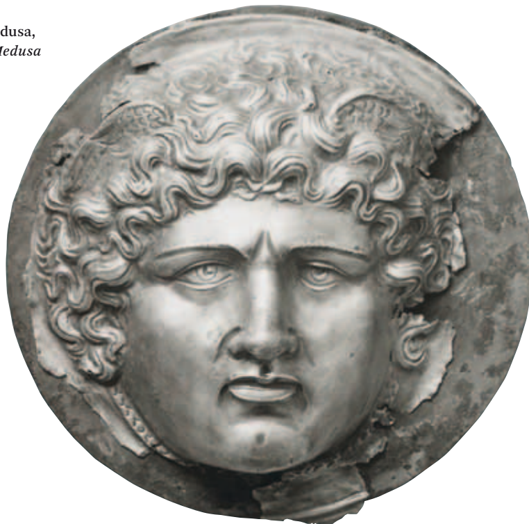
8. Phalera met het hoofd van de schone Medusa, Antikensammlung Berlin (in: E. Buschor, Medusa Rondanini , Stuttgart 1958, 26)

Het is nu mijn bewering dat de vier basementen van het grafmonument van De Keyser de bronzen weergave bevatten van de aegis van Minerva namelijk ‘elckx