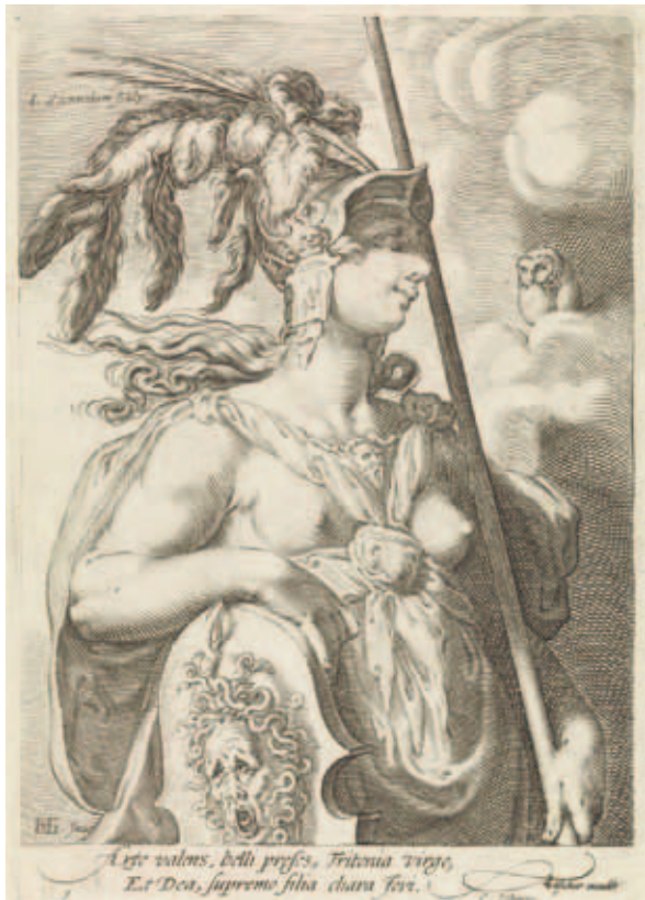
10. Jan Saenredam, gravure naar Goltzius, Minerva , 1575-1609

laat ons het volgende weten over Medusa, die voor haar gedaantewisseling 'la più bella' was en 'capelli d'oro' had, in het verband van Minerva's aegis: