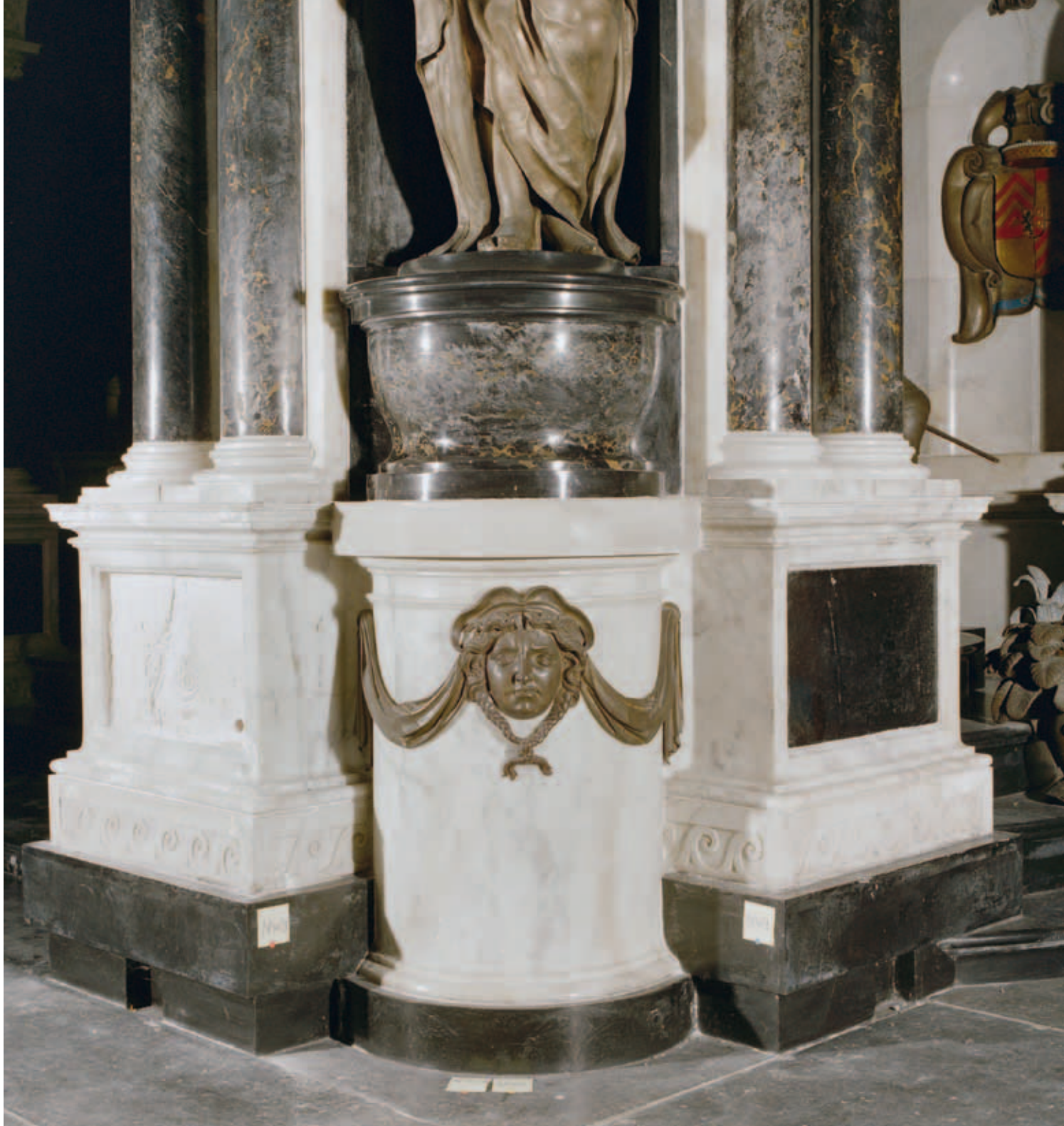
◀ 2. Hendrick de Keyser, Grafmonument Willem van Oranje (1614-1623) in de Nieuwe Kerk in Delft