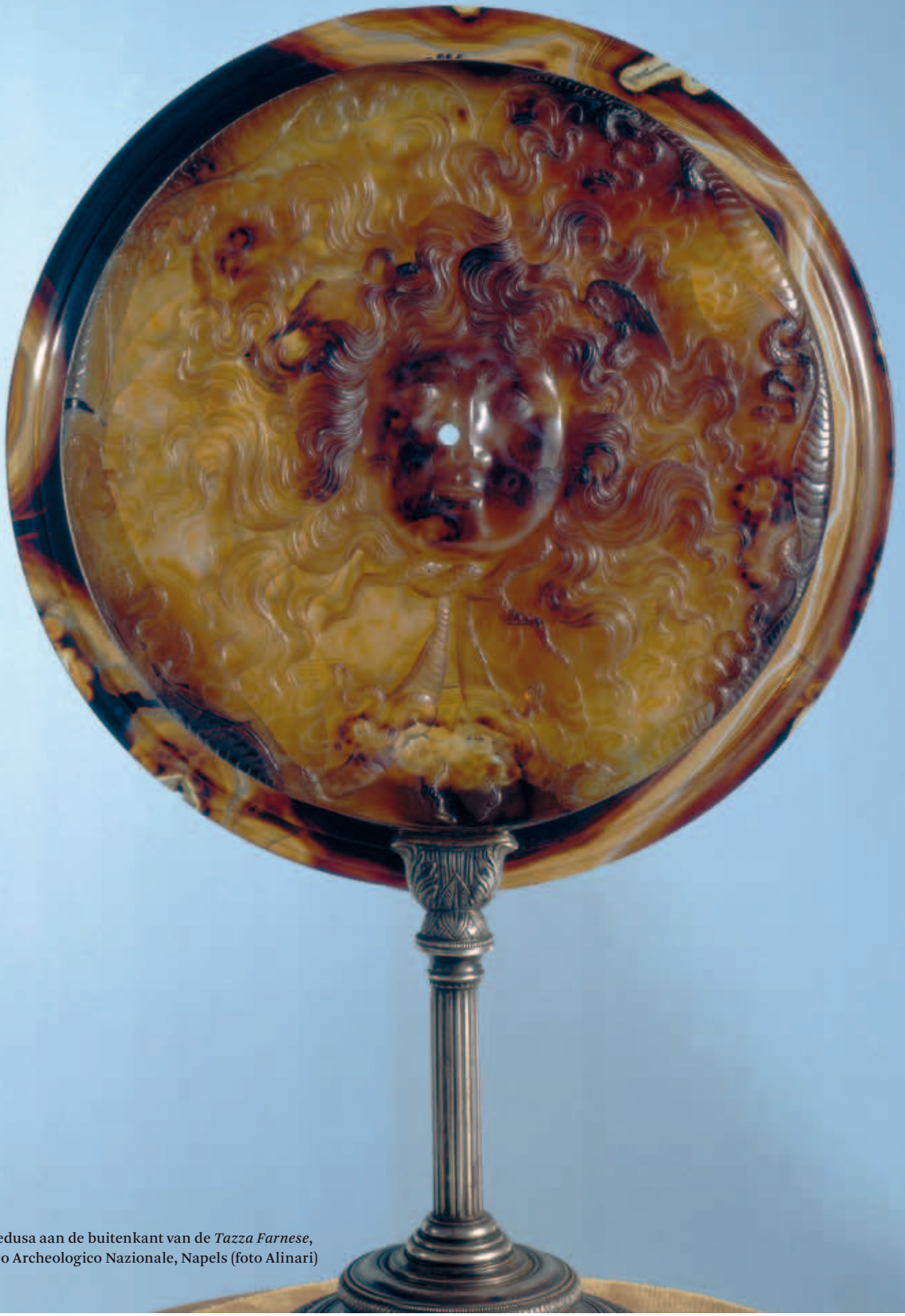
6. Medusa aan de buitenkant van de Tazza Farnese , Museo Archeologico Nazionale, Napels