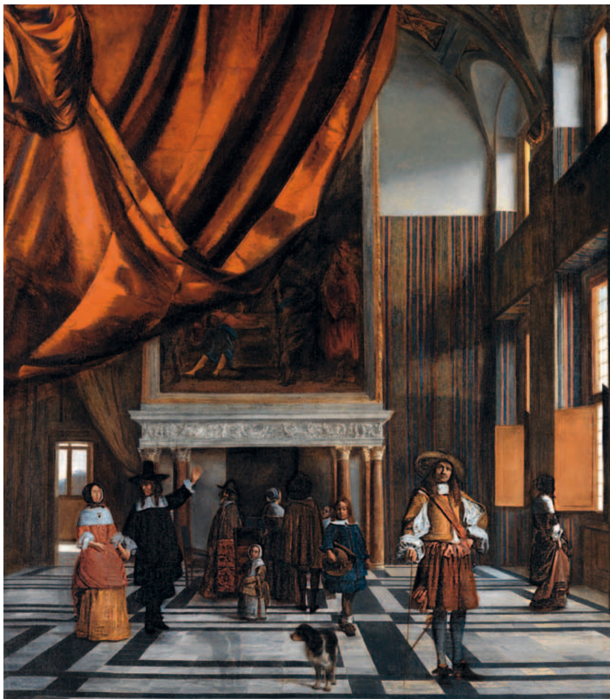
3. Pieter de Hooch, Het burgemeestersvertrek in het stadhuis van Amsterdam , circa 1665

verbouwingen, waarbij enorme bedragen werden besteed aan de inrichting (afb.4). 9 Door middel van bespanningen, gordijnen en meubilair werd het gebouw tot paleis omgetoverd. Bouwkundig gezien waren de werkzaamheden relatief gering. De vensters en de binnendeuren werden grotendeels vervangen en in het interieur leidden het aanbrengen van keukens en centrale verwarming tot enig breekwerk in de structuur. De terughoudendheid blijkt ook uit het aanbrengen van de schotten in de galerijen, waarvoor niet of nau-