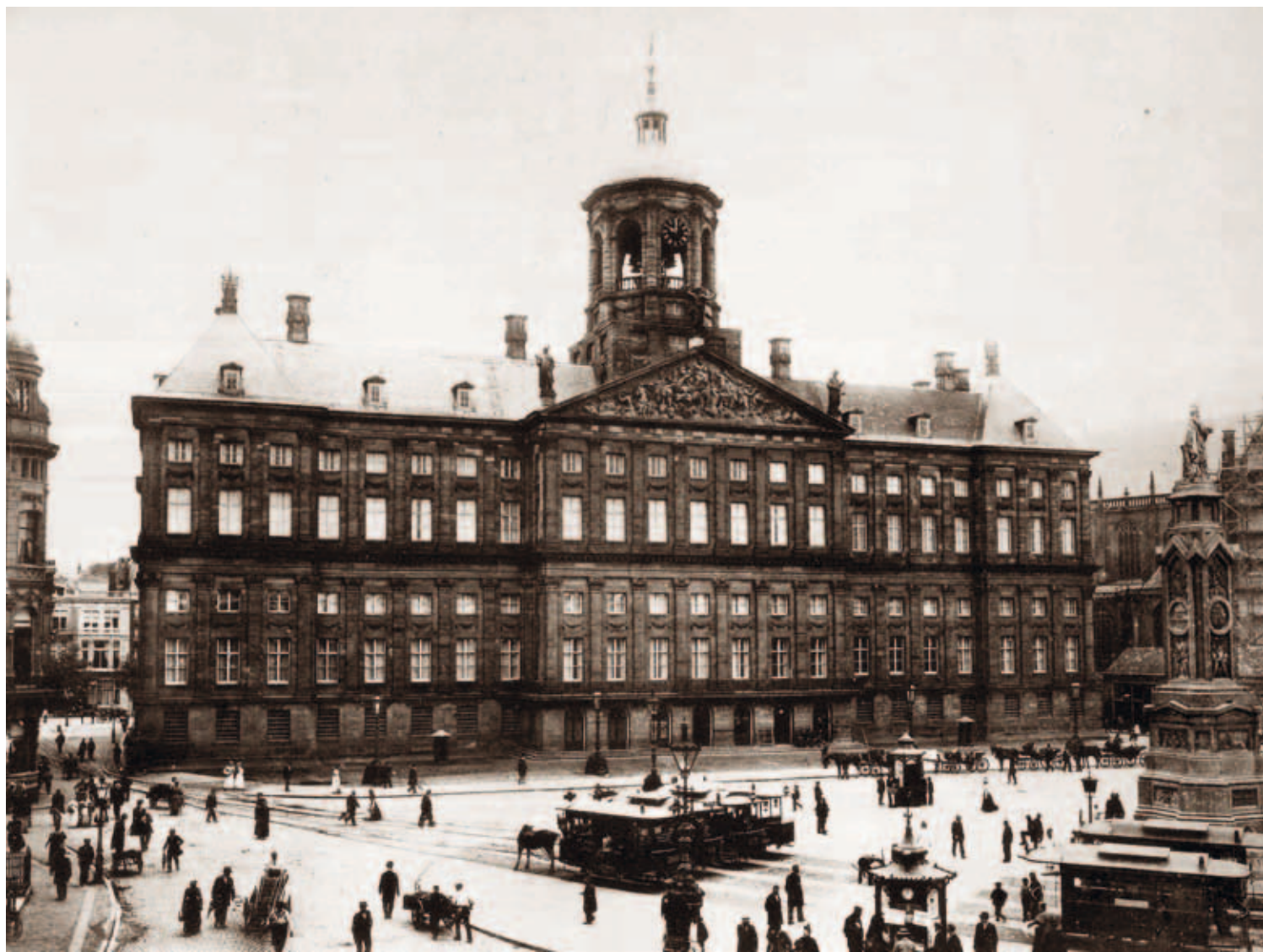
5. De façade van het Paleis op de Dam rond 1900. Uit: C.T.J. Louis Rieber, Het koninklijk paleis te Amsterdam , Leiden/Haarlem 1902, plaat II

Zolang er een geschil was tussen de stad Amsterdam