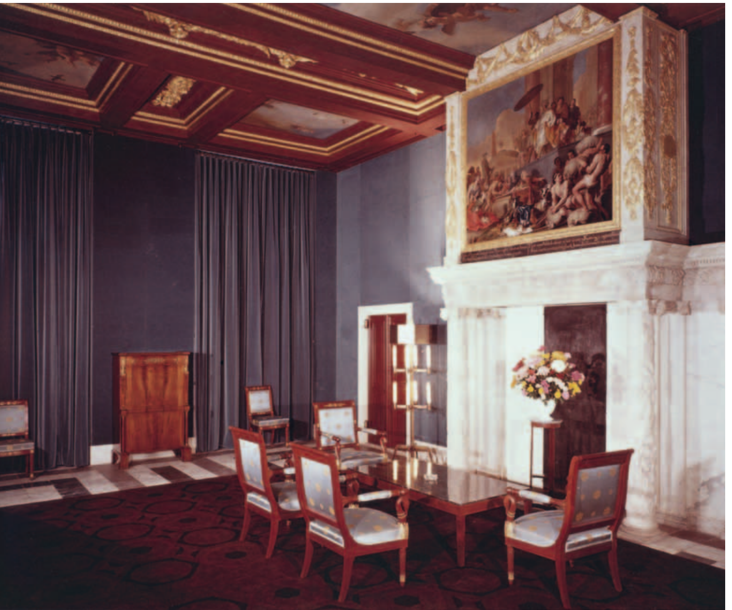
6. De Thesaurie Ordinaris na de restauratie door Wegener Sleswijk, circa 1968

en de Staat der Nederlanden over de eigendom van het gebouw, wilde de Staat alleen bedragen reserveren voor onderhoud en niet voor de herinrichting van het gebouw. Toen de Staat in 1936 definitief eigenaar van het gebouw werd, veranderde dit. 'Ik mag er hier op wijzen, dat hier een gelegenheid bestaat om hen die ons dit bezit misgunnen te doen zien, dat het wat de verzorging betreft en de liefde voor zijn schoonheid, in de beste handen is', schreef het hoofd van de afdeling Rijksgebouwen aan de verantwoordelijke minister van Financiën. 11 In 1936 gaf koningin Wilhelmina opdracht de schotten in de galerijen te verwijderen, waardoor het oorspronkelijke concept van burgerzaal met aansluitende galerijen in ere werd hersteld. Deze op zichzelf positieve ingreep leidde echter tot een groot probleem: de verwijderde ruimtes in de galerijen waren essentieel voor het functioneren van het gebouw