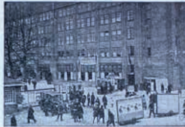
De toegang tot de jaarbeurs.

Begane gronds treft men een voortzetting aan van de groepen Electrotechniek, Radio, Metaalwaren en Verlichtings-artikelen. Deze najaarsbeurs zal ook de aandacht trekken door belangrijke inzendingen op Auto-gebied. De Nederl. Spoorwegen verleenen wederom de gebruikelijke reductie van 50%, op den prijs van het terugreis-biljet. Men verzuime