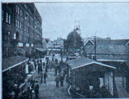
Het Vredenburg tijdens de Jaarbeurs.

HET GEREGELD BEZOEKEN DER NEDERLANDSCHE JAARBEURZEN IS EEN ONAFWIJSBARE EISCH VOOR IEDEREN ZAKENMAN, DIE VOLKOMEN OP DE HOOGTE VAN ZIJN VAK EN ZIJN TIJD WIL BLIJVEN