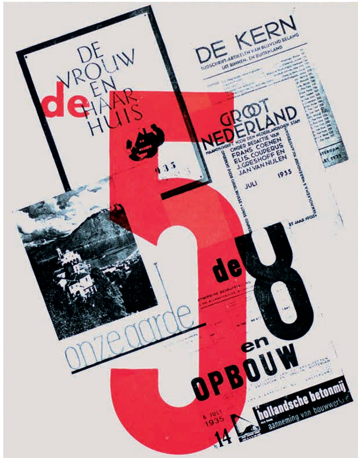
6. 5 waardevolle tijdschriften van Van Holkema & Warendorf N.V., brochure, 1935 (IISG)

waardevolle tijdschriften van Van Holkema & Warendorf N.V. Keizersgracht 333 Amsterdam c.