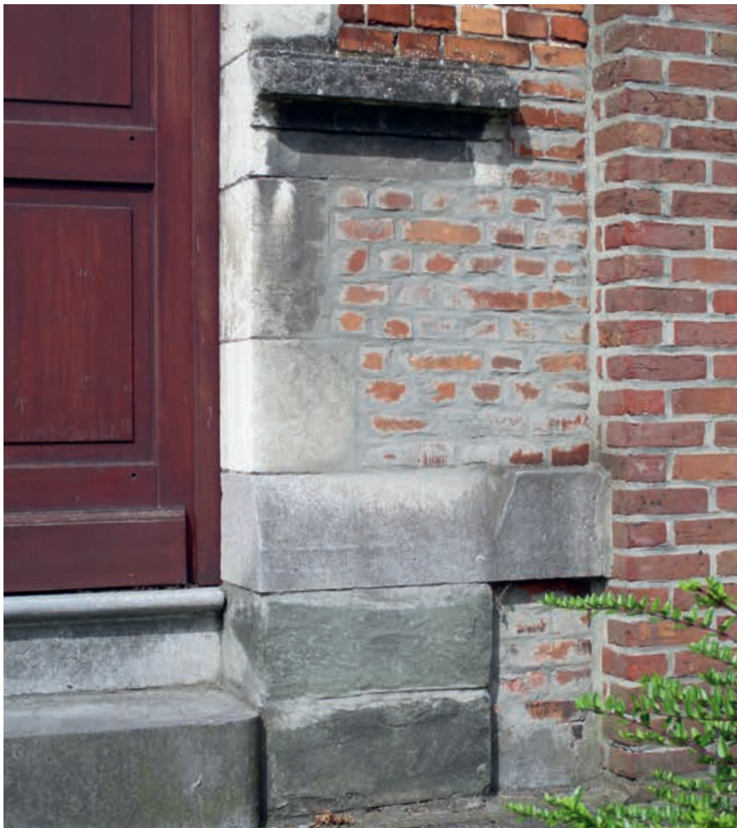
12. De specifieke kapvorm van de natuursteen in de Sint-Gerardus-school bewijst de authenticiteit van de reconstructie van het modelschoolgebouw uit het Moderne Dorp

De bouw van het Moderne Dorp gebeurde op een moment dat door industrialisering en verstedelijking regionale cultuurverschillen, tradities en ambachten dreigden te vervagen. Diverse groepen binnen de samenleving verzetten zich tegen bepaalde aspecten van de zich moderniserende samenleving. Ook elders in Europa was verzet tegen negatieve effecten van de modernisering en ontstond een behoudsgezinde tegenbeweging die zich bekommerde om traditionele volksculturen. 66 De organisatoren van het Moderne Dorp stonden een vergelijkbare filosofie voor. Een hernieuwde volkscultuur moest de modernisering in goede banen leiden en de mensen op het platteland liefde voor hun onmiddellijke omgeving bijbrengen. Het ver-