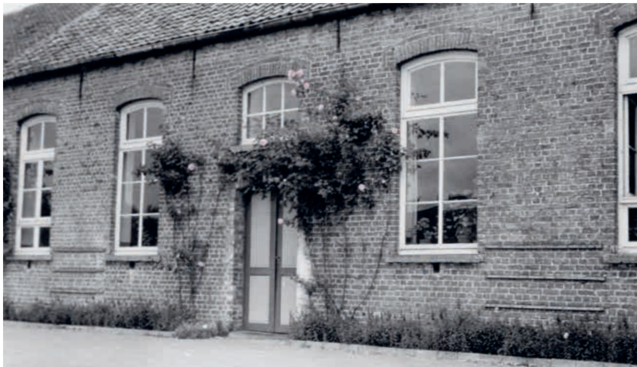
8. Gemeenteschool van Lo-Reninge uit 1868 met smalle, getoogde raampartijen (Westhoek Verbeeldt)