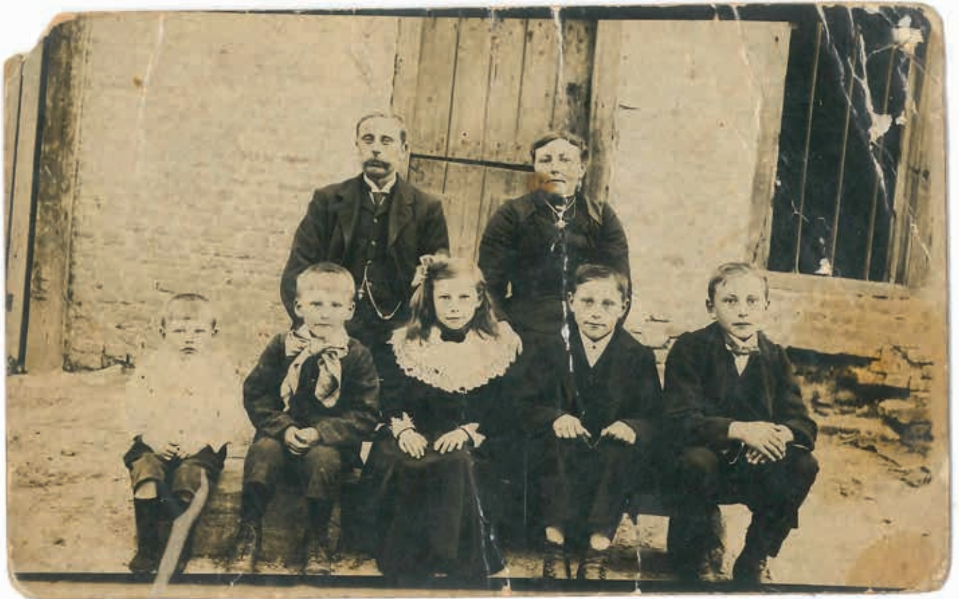
2. Traditioneel landbouwersgezin uit de Belgische kuststreek, omstreeks het einde van de Eerste Wereldoorlog (privéarchief)

overheid besliste om op de Wereldtentoonstelling van 1913 landelijke gebouwen zodanig te groeperen dat ze een modern landbouwdorp zouden vormen: het Moderne Dorp. 16 In de geschiedenis van de wereldtentoonstellingen was dat een primeur. In de woorden van Paul De Vuyst: 'Eindelijk, op de Internationale Tentoonstelling in Gent konden wij de grootste onderneming van dien aard bewonderen: Het "Moderne Dorp". Men bracht er 'een aantal landelijke gebouwen bij elkander, zoodat men hoeven van verschillende grootten aantrof, melkerij, tuin, smederij, bakkerij, enz. Ook gebouwen der openbare diensten, kerk, gemeentehuis, school, bibliotheek, post, telegraaf, telefoon, enz., ontbraken niet.' 17 De Vuyst was de bedenker van het concept van het Moderne Dorp. 18 Onder leiding van de Vlaamsgezinde katholieke minister van Landbouw Joris Helleputte (1852-1925) waren diverse ministeries betrokken geweest bij de bouw van het dorp.