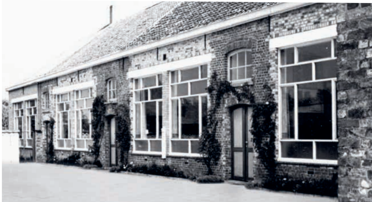
9. Gemeenteschool van Lo-Reninge uit 1868 met brede, rechthoekige raampartijen, na 1949 (Westhoek Verbeeldt)

1920 en 1930 met grote ramen – vergelijkbaar met die van de modelschool – werden gebouwd of verbouwd. 59 Een voorzichtige extrapolatie op basis van de reeds onderzochte gemeenten maakt het aannemelijk dat het werkelijke aantal hoger ligt. We stellen vast dat deze verlichtingsmethode tijdens het interbellum de standaard was. Weliswaar troffen we in schoolgebouwen van enkele jaren vóór de Wereldtentoonstelling van 1913 ook zulke raamtypen aan, maar hun aantal is beperkt en bovendien is niet zeker of deze ramen origi-