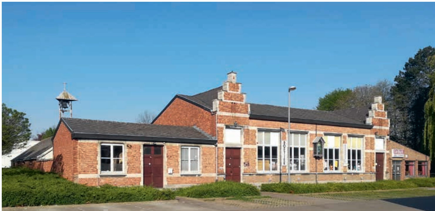
6. De Sint-Gerardusschool, reconstructie van de Belgische modelschool van 1913, 2019

de dorpen moeten stimuleren. Schoolgebouwen en andere publieke gebouwen gaven met verzorgde voortuinen (zogenaamde lusttuinen) het voorbeeld. Van de onderwijzers werd verwacht dat zij deze schooltuinen aanprezen als inspiratie voor de huizen in het dorp. Een ministeriële circulaire uit 1909 spoorde hen met klem aan om hun school om te vormen tot een 'huis der bloemen'.