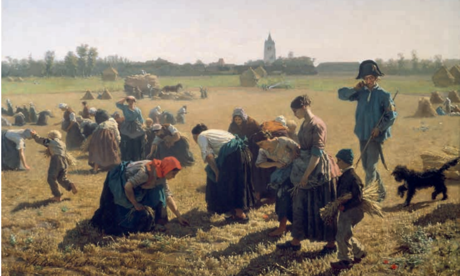
14. Jules-Adolphe Breton, The Gleaners (De Arenlezers), 1854 (National Gallery of Ireland, Dublin)