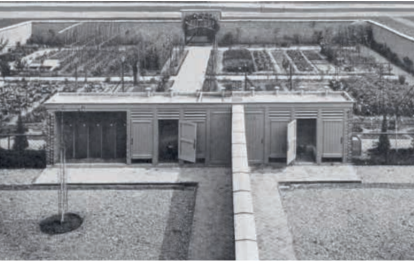
7. Zicht op de speelplaats met hygiënische buitentoiletten. Op de achtergrond de befaamde moestuin van de modelschool in het Moderne Dorp, 1913

moestuïn, een boomgaard en serres. De moestuin diende ervaringsgericht basisonderwijs. 46 Met het kweken van groenten, fruit en kruiden leerden kinderen te voorzien in hun eigen levensonderhoud. Deze onderwijsmethode sloot nauw aan bij de leefwereld van de kinderen. Dat was belangrijk om schoolverzuim tegen te gaan en de drempel tot het (verplichte) basisonderwijs laag te houden. 47 Heel wat plattelandskinderen groeiden op in gezinnen waarvoor de (eigen) moestuin onmisbaar was om te overleven (afb. 7).