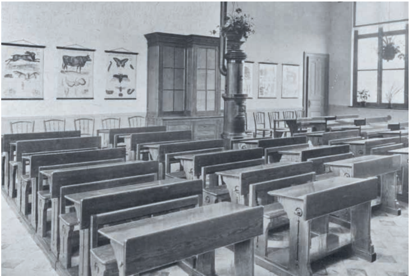
15. Het interieur van de jongensklas met achterin de bibliotheekkast in de modelschool in het Moderne Dorp tijdens de Wereldtentoonstelling van 1913 te Gent