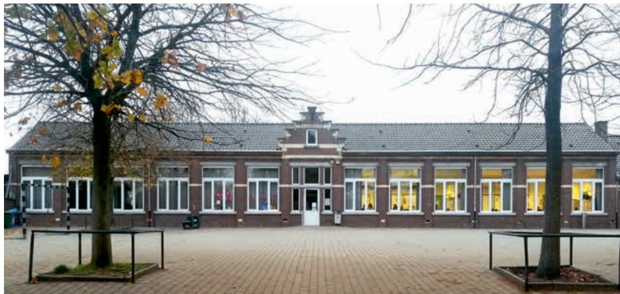
16. De in 1930 opgerichte gemeenteschool in Val-Meer te Riemst, 2018

Recent veldonderzoek vult de laatste onderzoeken van de Vlaamse Overheid aan en stelt vast dat meer dan honderd schoolgebouwen van tussen 1913 en eind jaren dertig zijn uitgerust met de innovatieve verlichtings- en/of ventilatietechnieken die we kennen van de modelschool van het Moderne Dorp (afb. 16). Dit versterkt de hypothese dat de modelschool veel navolging kreeg en – zoals de Belgische overheid beoogde – een betekenisvolle rol speelde bij de realisatie van de leerplicht voor kinderen van zes tot veertien jaar in België. Verder onderzoek naar de maatschappelijke betekenis