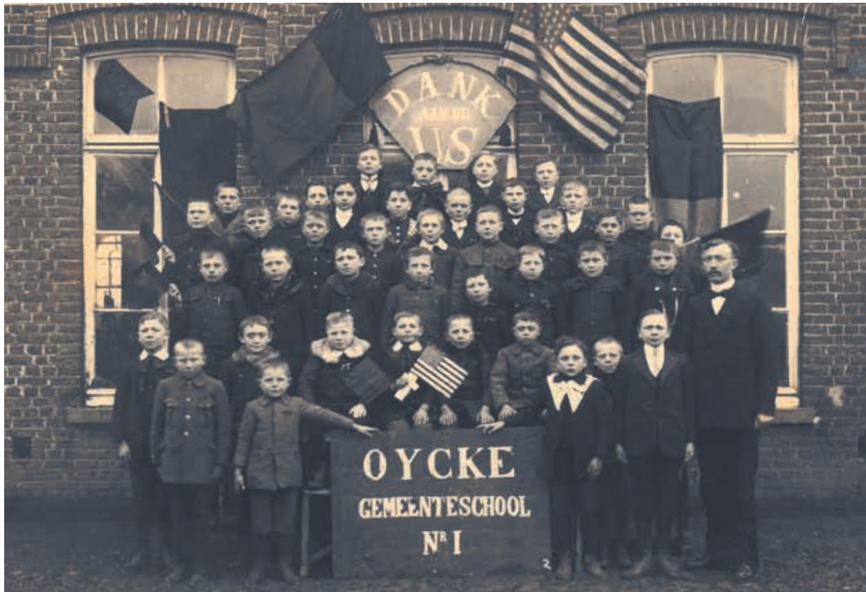
13. Huldefoto na de Eerste Wereldoorlog op de speelplaats van de gemeenteschool van Ooike

beteren van de levenskwaliteit op het platteland zag men ruimer dan louter als een bijdrage aan de economische welvaart. 67 De nieuwe plattelandscultuur omarmde de modernisering met 'eerbied voor de gewestelijke overleveringen' en 'met eene kunstopleiding, die het gevoel, het gemoed en dus ook het bestaan der landelijke bevolking moet verheffen'. 68