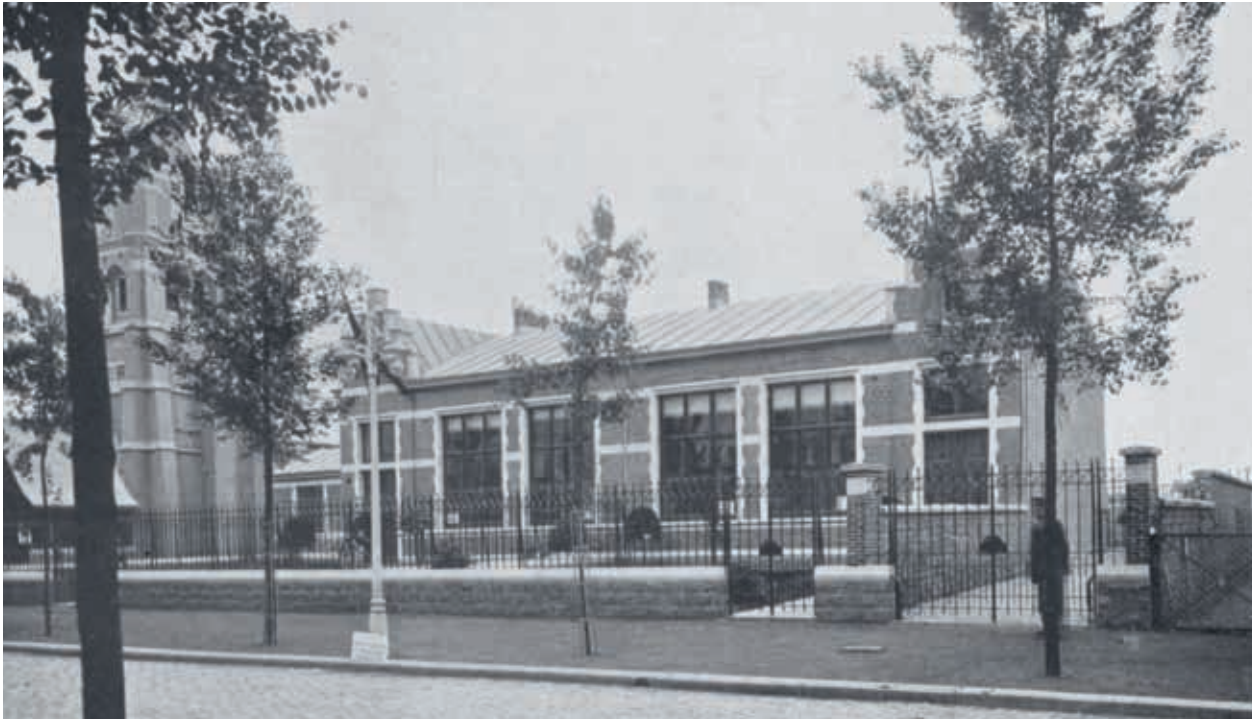
5. De lagere modelschool met 'lusttuin' in het Moderne Dorp tijdens de Wereldtentoonstelling van 1913

belangrijkste inspiratiebron. 33 Zij hielden zich ten tijde van de Wereldtentoonstelling van 1913 al bezig met zeer uiteenlopend cultureel werk op het platteland: het oprichten van musea; inrichten van rondreizende tentoonstellingen en stands met nuttige en betaalbare kunstvoorwerpen op kermissen; het beschermen van erfgoed en landschappen; organiseren van spelen voor de jeugd; ontwikkelen van cursussen (en scholen) voor volwassenen ten behoeve van hun algemene ontwikkeling en het onderricht in huishoudkunde, landbouwkunde en de voordelen van het landleven; verbeteren van de huisnijverheid (mandenvlechterij, houtbewerking, pottenbakkerij, etc.); ontwerpen en helpen bouwen van betaalbare landelijke gebouwen; propageren van normen en waarden en het verspreiden van kennis van gezondheidsleer, evenwichtige voeding, huishouden en landelijk recht. 34