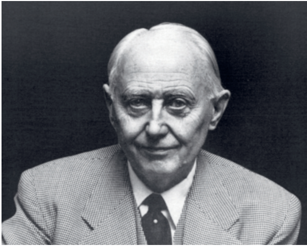
1. W.M. Dudok, afgebeeld in Architectural Forum februari 1954