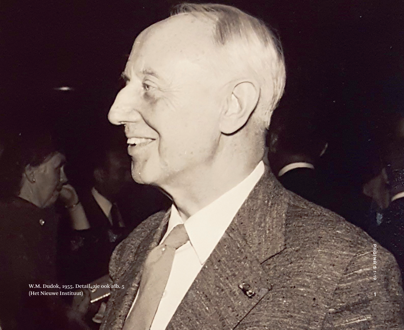
W.M. Dudok, 1955. Detail, zie ook afb. 5

midden van Amerika (afb. 1). 1 Doel was het geven van lezingen over architectuur en stedenbouw (afb. 2). Hoewel Dudok op dat moment al bijna zeventig jaar oud was, zou het zijn eerste kennismaking met Amerika worden.