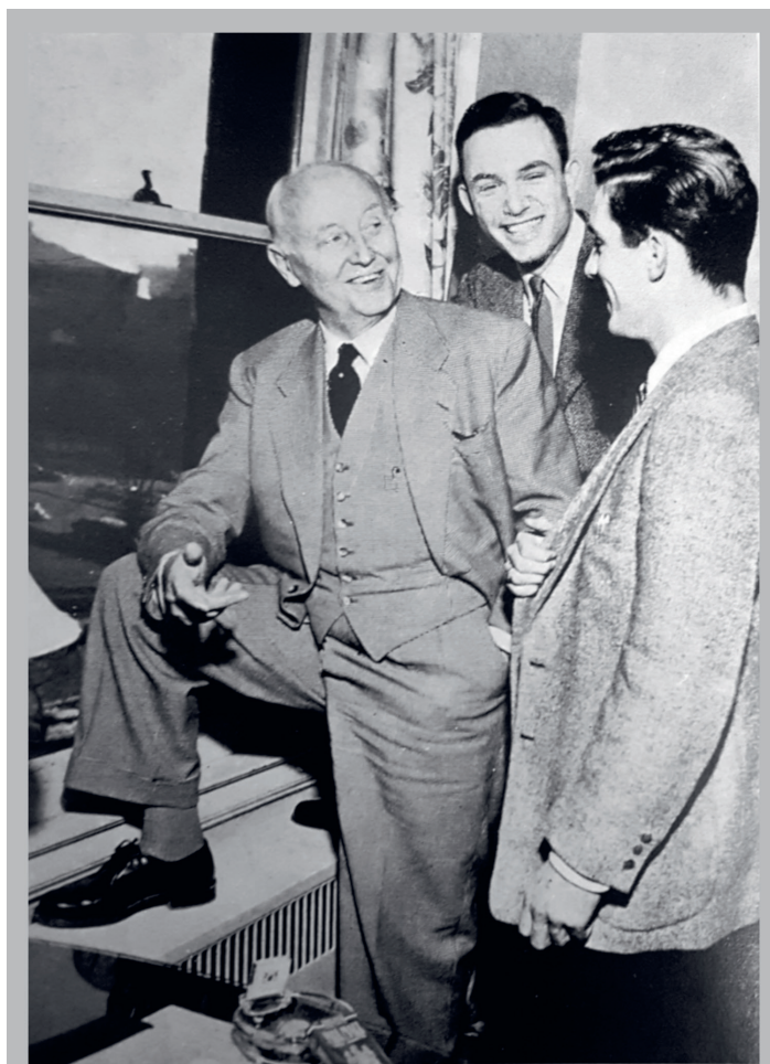
Dudok, looks out of his hotel window on Pittsburgh with a somewhat disapproving eye. Too big, he tells two senior architectural students at Carnegie Tech. Dudok believes cities should be smaller for maximum convenience and service to the public. The two students were his escorts on a tour of the city.