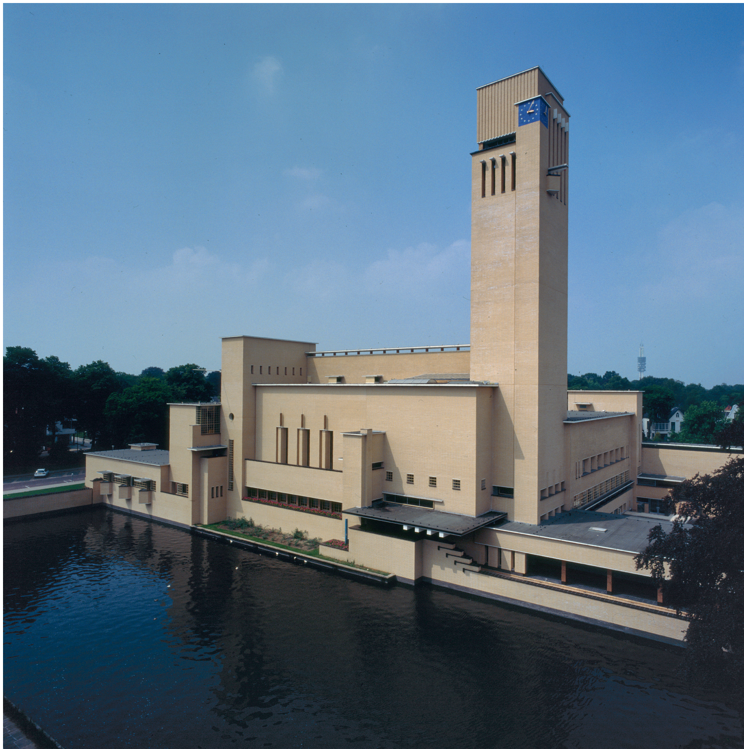
3. W.M. Dudok, raadhuis Hilversum, 1928-1931 (ontwerp 1924), zuidgevel met rechts de hoofdingang

kere regelmaat en waar mogelijk leidde Dudok bezoekers zelf rond om zijn stedenbouwkundige ideeën of het ontwerp van het raadhuis toe te lichten. 11 Zo'n bezoek werd steeds als zeer positief ervaren, getuige de vele dankzeggingen die de correspondentie bevat (afb. 4). Het raadhuis 'has attracted the enthusiasm of all those who have seen it, and I am sure a detailed treatment of it [...] would be of great interest and help-