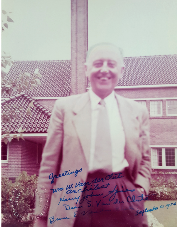
4. Dudok door Amerikaans bezoek gefotografeerd voor zijn eigen woonhuis in Hilversum, 1954