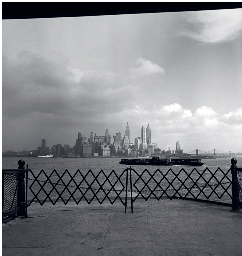
9. Skyline Manhattan, september 1953

Dudok raakte meer onder de indruk van de techni-