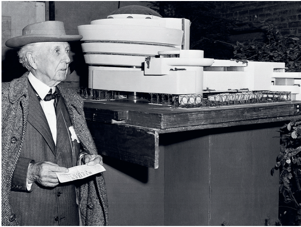
7. Frank Lloyd Wright met een model van zijn ontwerp voor het Guggenheim Museum in New York, 25 oktober 1953