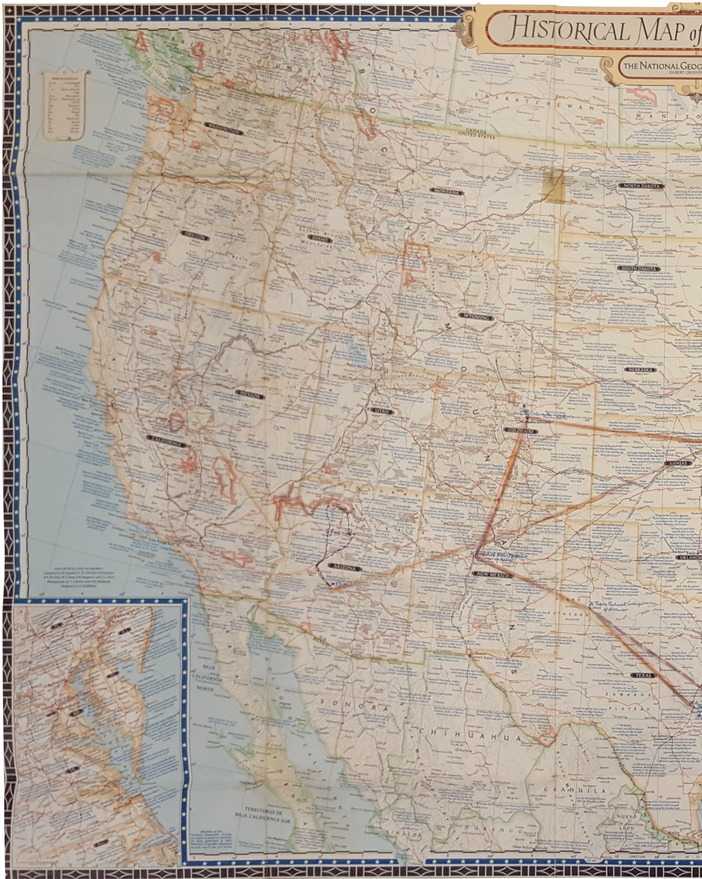
6. Kaart van de Verenigde Staten met aantekeningen van Dudok, najaar 1953 (Het Nieuwe Instituut)