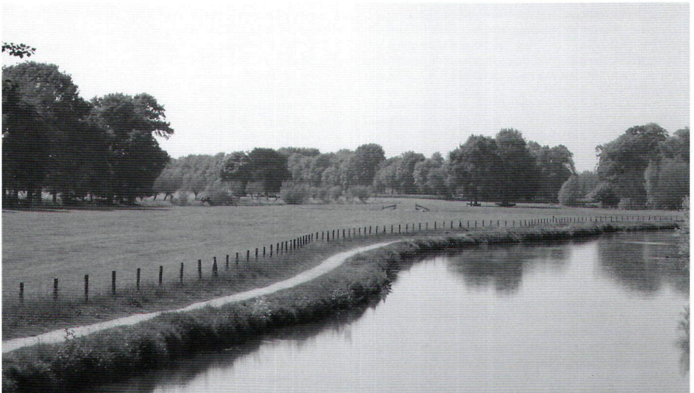
Afb. 2. De Kromme Rijn bij Amelisweerd in de omgeving van Utrecht (2007)