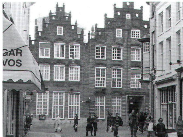
Afb. 4. Hoge Steenweg 29 in Den Bosch (2007)

een lelijk ding in hun prachtige Stationsstraat.