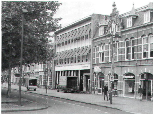
Afb. 3. Bankgebouw aan de Stationsstraat in Den Bosch (2007)