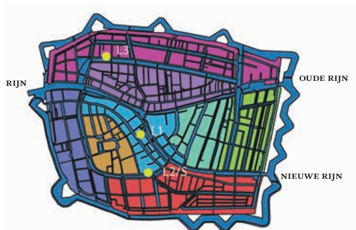
5. De stadsdelen en de locaties van de lakenhallen en de Saaihal

In het peiljaar 1674 kan binnen zowel de lakennering als de saainering de huis-halafstand als vestigingsfactor worden vermoed. Ook in de Volkstelling van 1748 waren de lakenreders nog altijd geclusterd in het stadsdeel Noord-nieuw, nabij de Lakenhal (afb. 6a). Zij woonden vooral aan de Oude Singel. Een enkele keer waren ze gevestigd in het stadsdeel Noord-oud aan de Oude Vest. Dat is minder ver weg dan het lijkt, want het is dezelfde gracht die aan weerszijden een andere naam draagt.