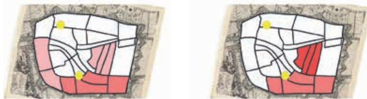
1674 SAAIWEVERS N=25

6b. De verspreiding van de aangegeven beroepsgroepen tegen de achtergrond van de stadsplattegrond van Christiaan Hagen (1670). De gele stippen geven de locatie van de hallen aan, vergelijk afb. 5