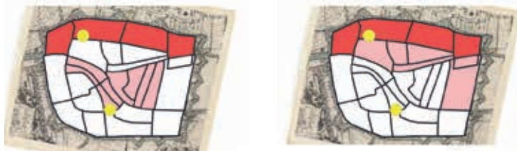
1674 LAKENWEVERS N=12