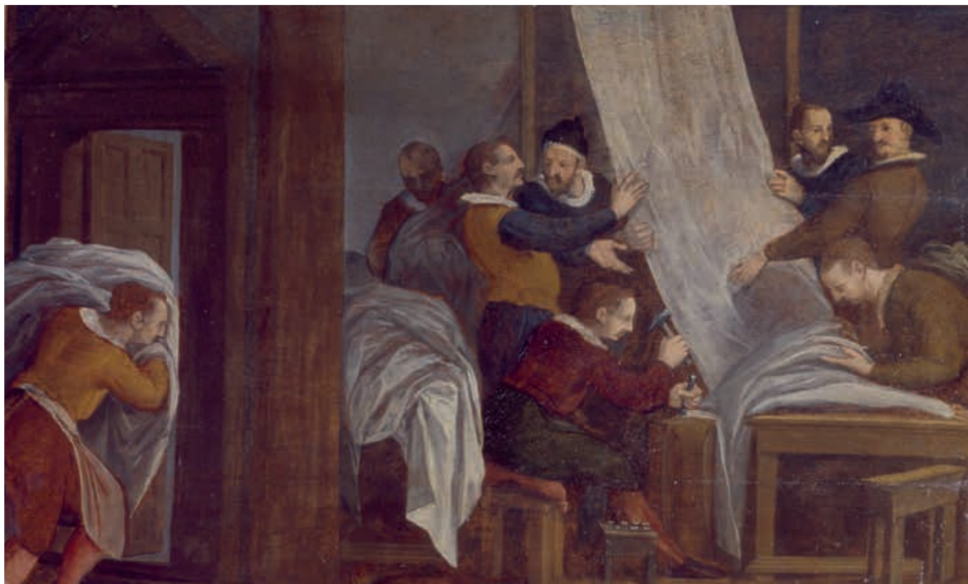
4. Isaac Claesz. van Swanenburg, Het vollen en verven , 1594-1596, uitsnede (Museum De Lakenhal, Leiden)

Ook de wantsnijders waren geclusterd in Centrum-oud (afb. 6a). ‘Want’ is het middeleeuwse woord voor lakense of wollen stof, en wantsnijders zijn zich later kleermakers gaan noemen. 46 Kleermakers verstelden geen kleding, dat deden de naaisters of oudkleerko-