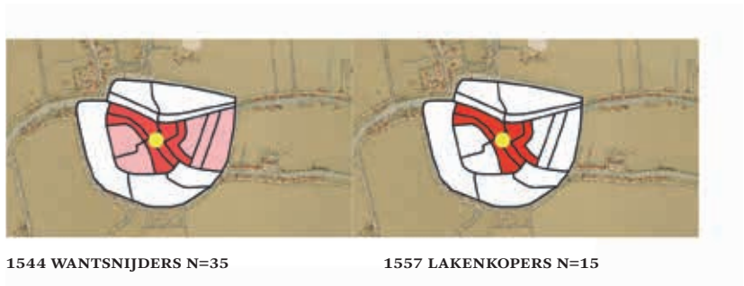
1544 WANTSNIJDERS N=35