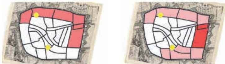
1748 LAKENWEVERS N=369