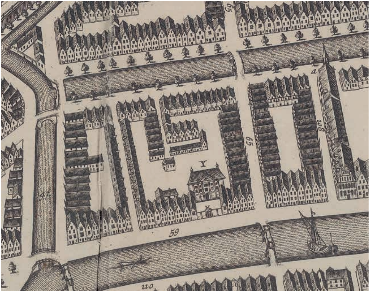
2a en 2b. Stadsplattegrond door Christiaan Hagen, 1670; uitsneden van de Lakenhal aan de Oude Singel (y) en de Saaihal (x) aan het Steenschuur (Erfgoed Leiden en Omstreken)