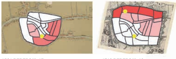
1581 REDERS N=17