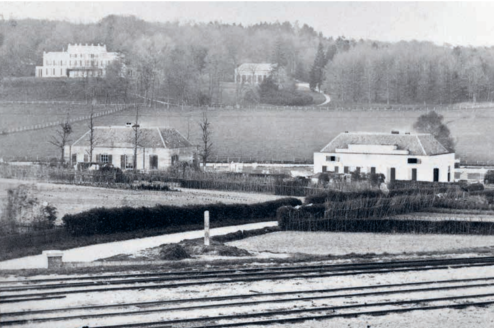
3. Het spoor in Arnhem met uitzicht op Sonsbeek. Album Staats Evers, 1865

de consequenties van de bijna onvermijdelijke financiële krapte bij het verenigingsbeheer?