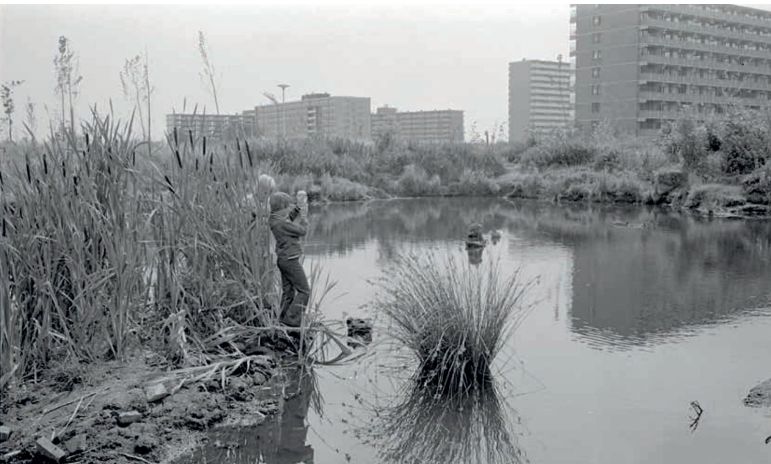
5. Wijktuin Ommoord in Rotterdam, foto Ary Groeneveld 1973 (Stadsarchief Rotterdam)

De inventarisaties van de groeikernen zijn completer. Zoetermeer nam per wijk tuinen, straten en openbaar groen integraal op. 25 De cultuurhistorische verkenning van Purmerend kent een stedenbouwkundige benadering waarin ook watergangen, sportvelden, volkstuinten en binnentuinen aan de orde komen. 26 De gemeente Almere liet zowel experts als publiek objecten aandragen en gaf binnen het thema 'groen-blauw' de groenaanleg een volwaardige positie. 27 De Houtense groenstructuur ten slotte is landelijk, en zelfs internationaal bekend. 28 In de erfgoedvisie die de gemeenteraad in 2023 vaststelde, is de centrale Post 65 groen-blauwe fiets- en wandelaanleg opgenomen. 29