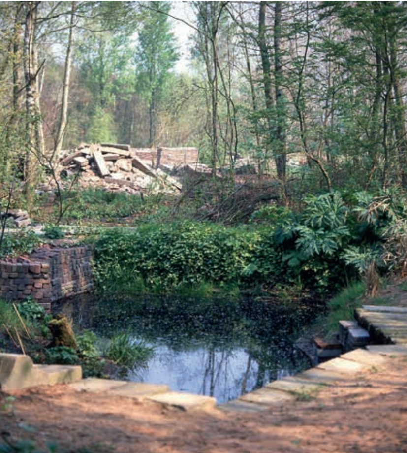
4. Ekokathedraal in Mildam

waren in dienst van rijks- en lokale overheden, Staatsbosbeheer, Grontmij en Heidemij. De genoemde stijlkenmerken waren ook in deze gebieden herkenbaar, met uitzondering van de geometrische vormtaal.