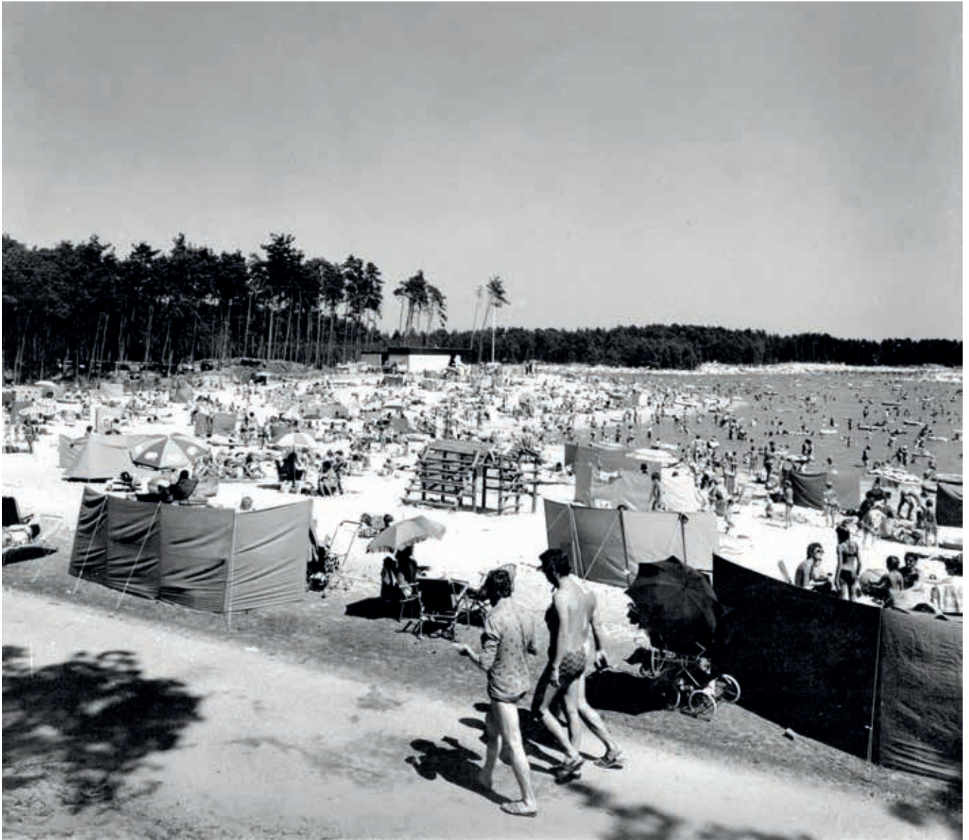
6. Een vol strand aan de recreatieplas het Henschotermeer in Woudenberg, 1985