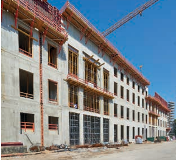
9. Zuidgevel van het Berlijnse stadspaleis, het huidige Humboldtforum, in aanbouw, 2014. Uitvoering in eigentijdse constructiewijze als betonnen casco