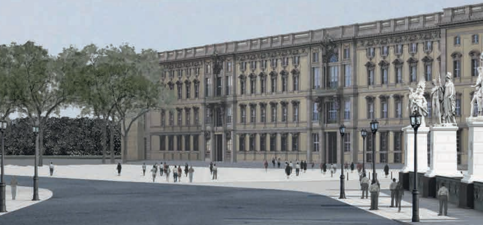
8. Simulatie van de noordwestgevel van het gereconstrueerde Berlijnse stadspaleis