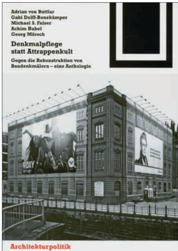
11. Strijdschrift Denkmalpflege und Attrappenkult met op het omslag de gereconstrueerde hoek van Schinkels Bauakademie in Berlijn