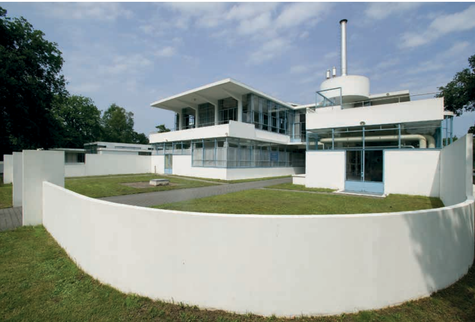
7. Hoofdgebouw Sanatorium Zonnestraal na de restauratie en reconstructie, 2007

opdrachten de vraag nagegaan welke mate van reconstructie tot falsificatie leidt en waar de grens daarbij ligt. 7 Hij komt tot de conclusie dat bij een grootschalig restauratieproject zoals Zonnestraal de acceptatie van verregaande reconstructies ondanks nauwelijks aanwezige originele materialen door de verantwoordelijke monumenteninstanties (ook de RCE) groot was en deze doorgaans in aanmerking kwamen voor subsidie. 8 In deze context past het dat de gemeentelijke monumentenzorg in Hilversum in haar lijst van uitgangspunten voor restauraties van modern erfgoed de 'authenticiteit van het ontwerp' boven de 'authenticiteit van materiaal' plaatst, wat geregeld tot (deel)reconstructies van gebouwen heeft geleid. 9