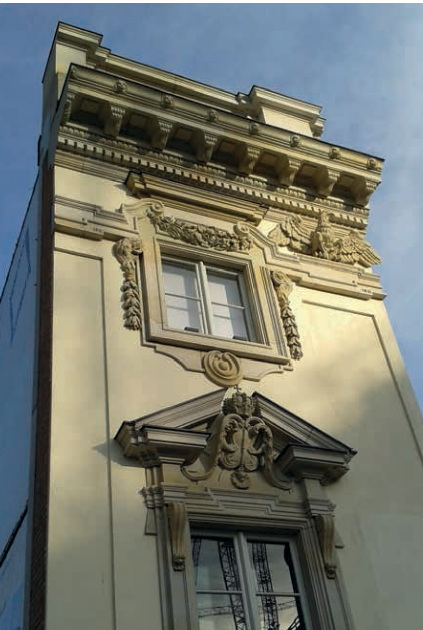
10. Gereconstrueerd gevelfragment van het Berlijnse stadspaleis, 2014

genueanceerde wetenschappelijke discussie over een mogelijke herpositionering van de inmiddels meer dan honderd jaar oude opvattingen van de monumentenzorg in de huidige maatschappelijke en professionele context is.