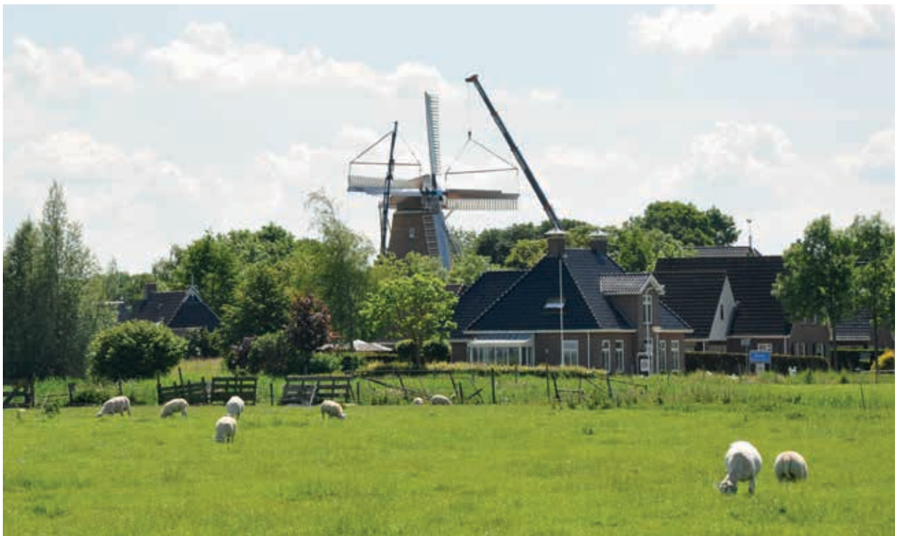
3. Herbouw molen Windlust, 2014