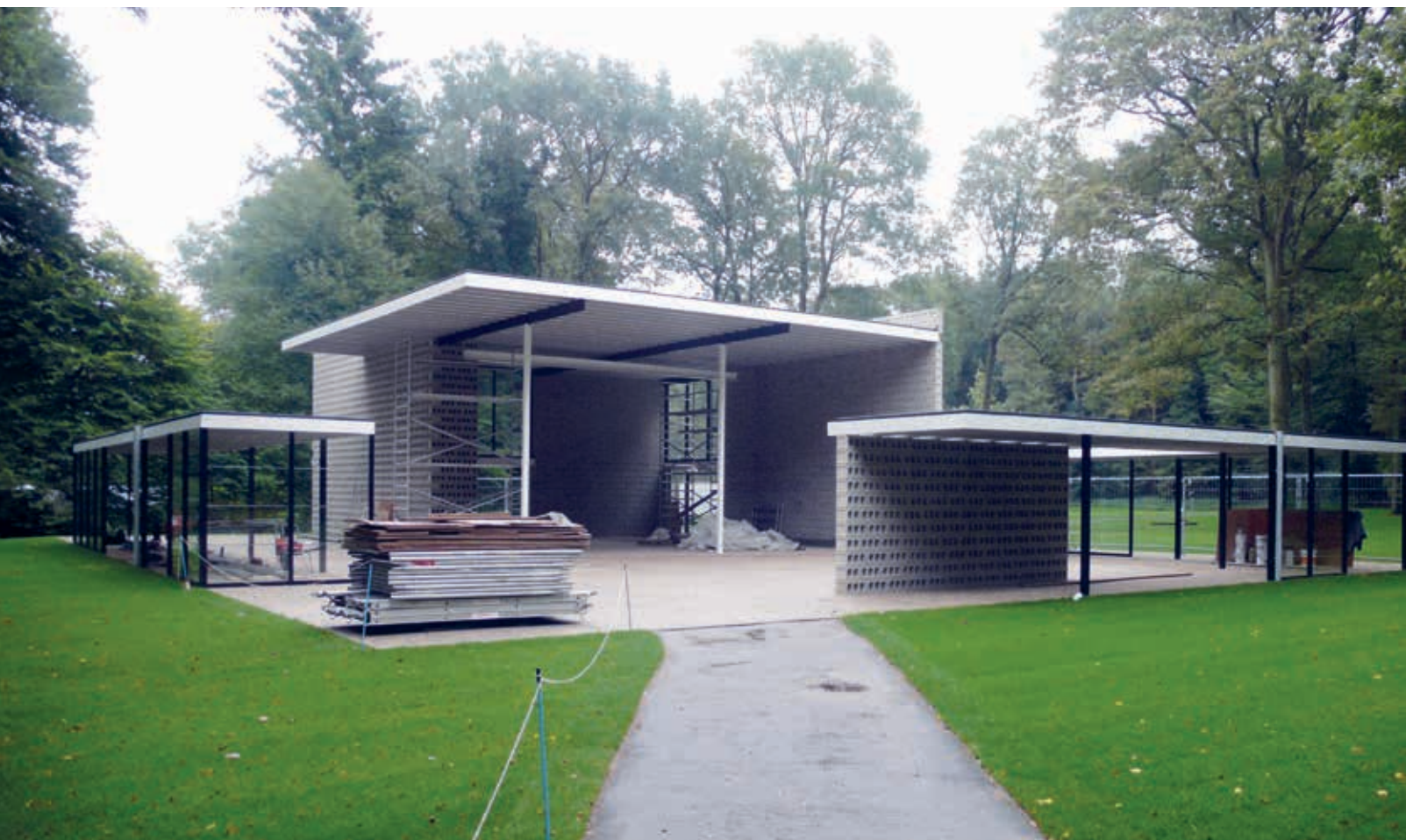
14. Het gereconstrueerde Rietveldpaviljoen in aanbouw, 2010

vakman en de geïnteresseerde leek weten hierdoor waar oorspronkelijk materiaal, gereconstrueerde aanvullingen en nieuwe onderdelen in het Rijksmuseum zijn te vinden. Maar hoe is dit voor de gemiddelde museumbezoeker, die ter plekke nauwelijks restauratiewerk van reconstructie kan onderscheiden? In de maanden na de heropening gaf een kleine tentoonstelling in het souterrain van het museum informatie over de werkzaamheden aan het Rijksmuseum. Inmiddels is informatie over het gebouw voor bezoekers in de vorm van individuele rondleidingen via de Rijksmuseum-app beschikbaar. Zodoende kan de bezoeker tegenwoordig in de rijk gedecoreerde voorhal staan en onder het motto ‘De witkwast erover!’ een historische foto van de in de loop van de twintigste eeuw witgesausde voorhal – zonder terrazzovloer – op zijn tablet of smartphone tevoorschijn toveren. 42 Zulke oplossingen zijn zonder twijfel ook buiten een museale context toe te passen en verder te ontwikkelen.