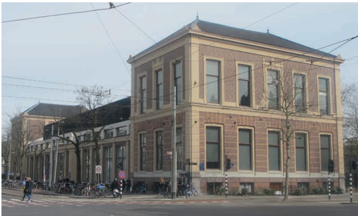
5. Ledenlokalen Artis na de verbouwing in eigentijdse vormtaal, 2015