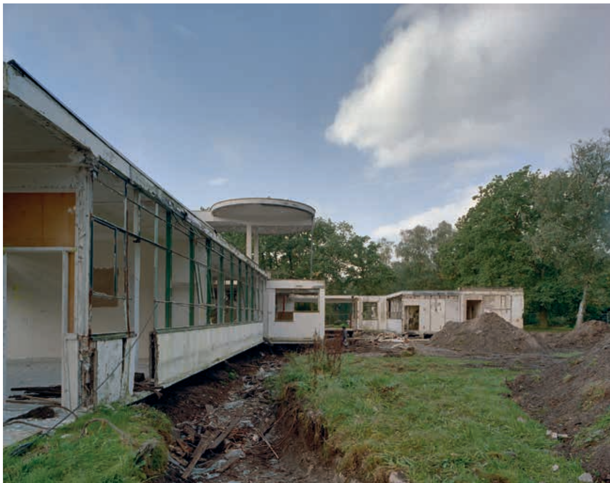
6. Hoofdgebouw Sanatorium Zonnestraal tijdens de restauratiewerkzaamheden, 2001

Dit principe is in Nederland de laatste jaren onder druk komen te staan waar het gebouwd erfgoed van de Moderne Beweging betreft. De vaak gehoorde – en ook in het geval van molen Windlust door de RCE gebruikte – redenering dat de gestage vervanging van bouwdelen tijdens restauratiewerkzaamheden iets wezenlijk anders is dan de (bijna) volledige vervanging van bouw materiaal na een calamiteit, is met projecten als bijvoorbeeld de restauratie van Sanatorium Zonnestraal op de achtergrond niet overtuigend (afb. 6 en 7). Zo is Wessel de Jonge aan de hand van eigen restauratie-