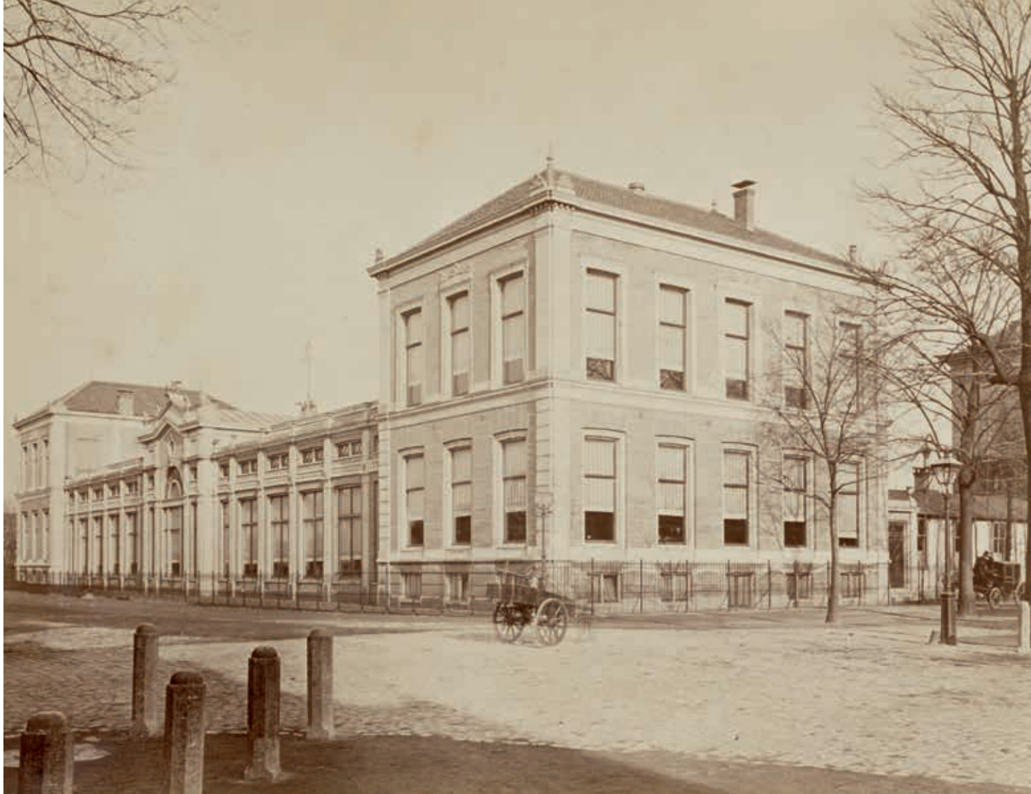
4. Ledenlokalen Artis kort na de oplevering in 1870