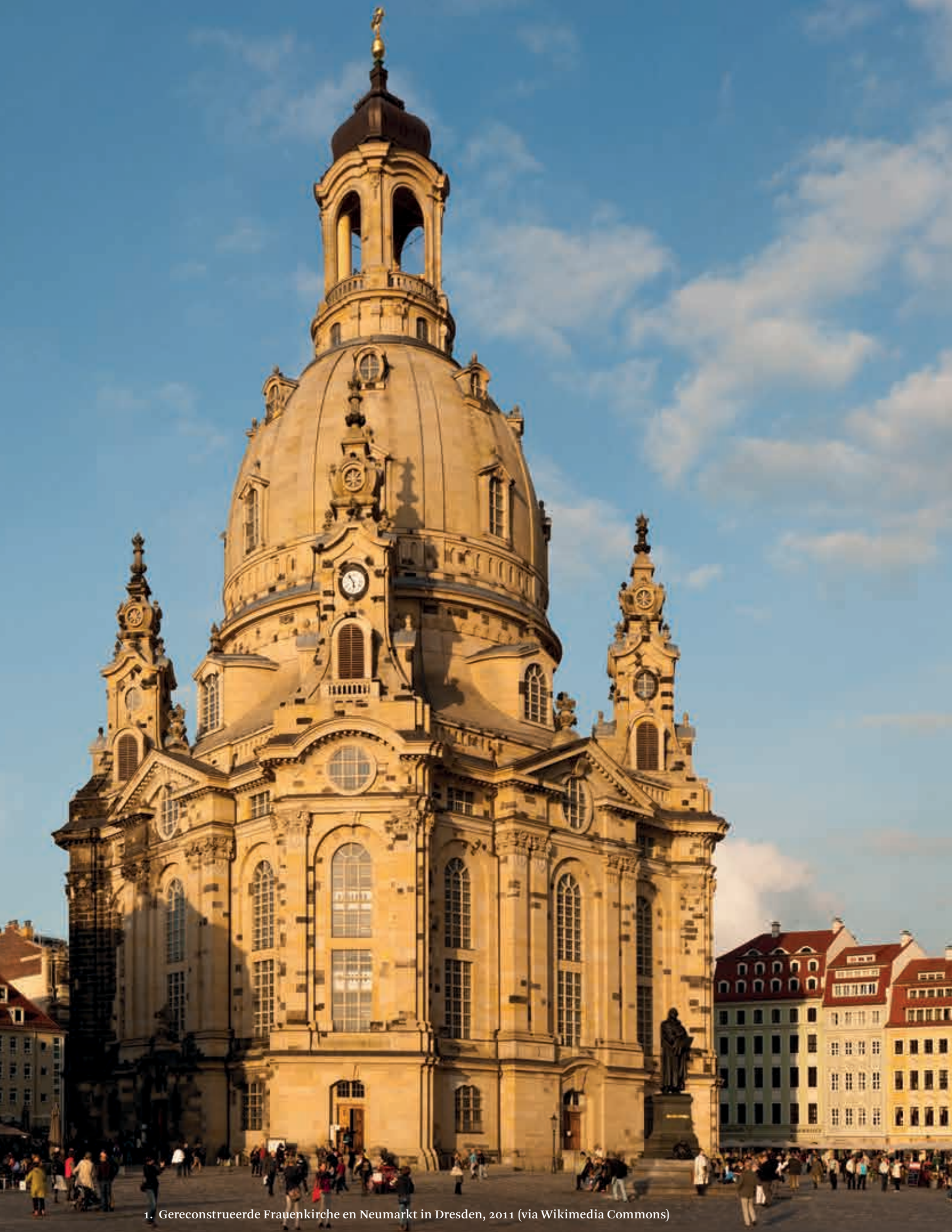
1. Gereconstrueerde Frauenkirche en Neumarkt in Dresden, 2011