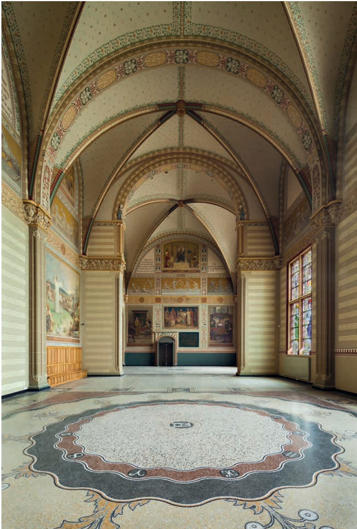
13. De gereconstrueerde voorhal van het Rijksmuseum, 2013