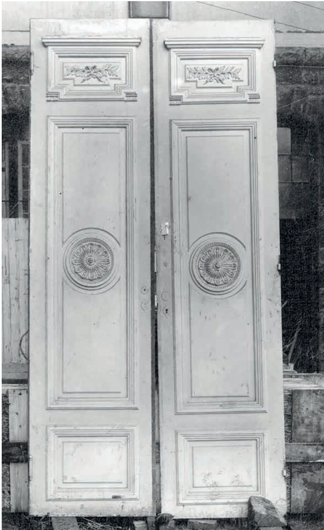
5. Gedemonteerde binnendeur