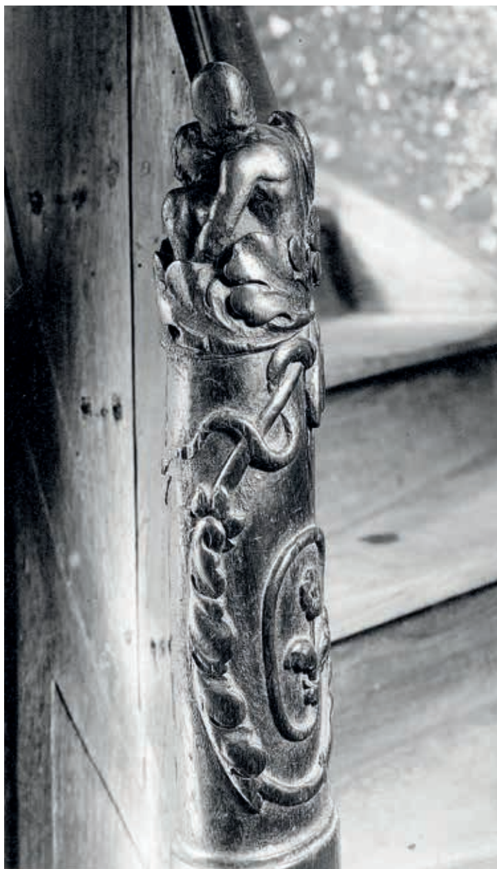
3. De fotoreportages van het Comité d'études du Vieux Bruxelles hadden ook tot doel om potentiële waardevolle elementen te documenteren. Tussen 1903 en 1938 werden verschillende architecturale details van bedreigde gebouwen gefotografeerd, zoals dit voorbeeld uit 1910 van een traponderdeel

behoud of afbraak van monumenten, maar richtte zich vaak op het iconografisch documenteren van gebouwen en gebouwfragmenten aan de hand van foto's, met bijzondere aandacht voor elementen met een 'oud karakter' en 'artistieke' of 'pittoreske' waarde. 19 Deze fotografische documentatie had waarschijnlijk ook een belangrijke functie voor het identificeren van waardevolle elementen die dreigden te verdwijnen door grootschalige projecten zoals de Noord-Zuidverbinding (afb. 3-5). Het Comité ijverde ook voor de fysieke bewaring van objecten: voormalig burgemees-