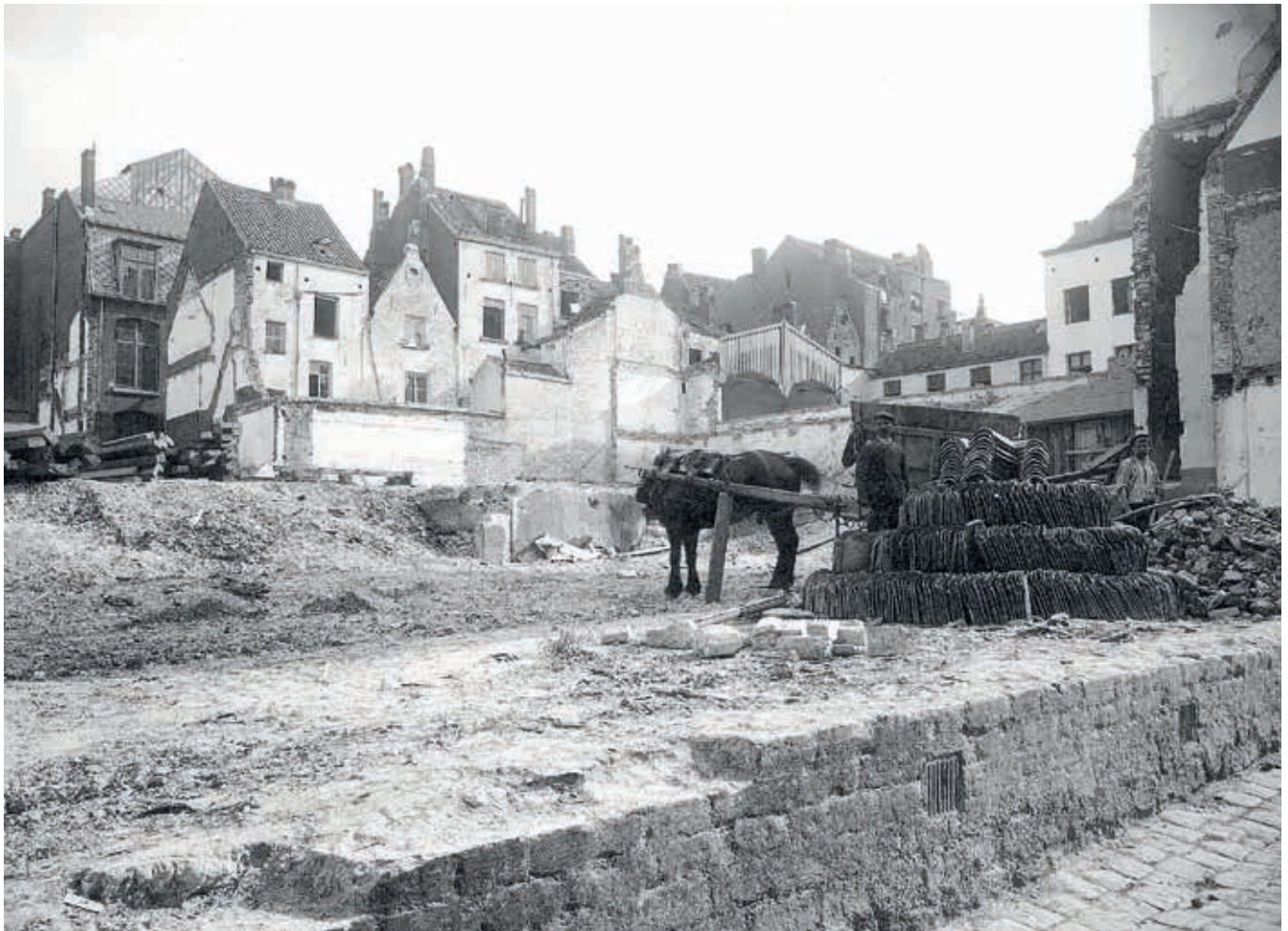
9. Gesorteerde dakpannen en houten balken gereed voor transport in 1911

eiste ze dat aannemers de vrijgekomen materialen en objecten zouden vrijwaren en eventuele schade herstellen of ze vervangen om zo het hergebruik ervan mogelijk te maken. 27 Het hergebruik van bouwmaterialen op de plaats van afbraak liet toe om de bouwkosten van het heropbouwproject te verlagen, maar dit was enkel mogelijk wanneer afbraak en heropbouw naadloos op elkaar aansloten. Bij grootschalige stadsvernieuwingsprojecten was deze strategie minder toepasbaar, aangezien er vaak lange perioden tussen waren. Bovendien verschilde de opdrachtgever voor de afbraak (de stad Brussel) meestal van de opdrachtgever voor de heropbouw (bouwpromotoren of particulieren), waardoor de stad een leeg terrein moest achterlaten na afbraak.