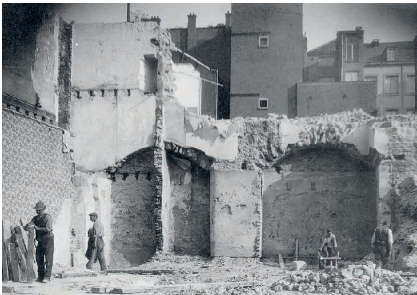
8. De bewerking en het transport van gedemonteerde houten planken en bakstenen rond 1905