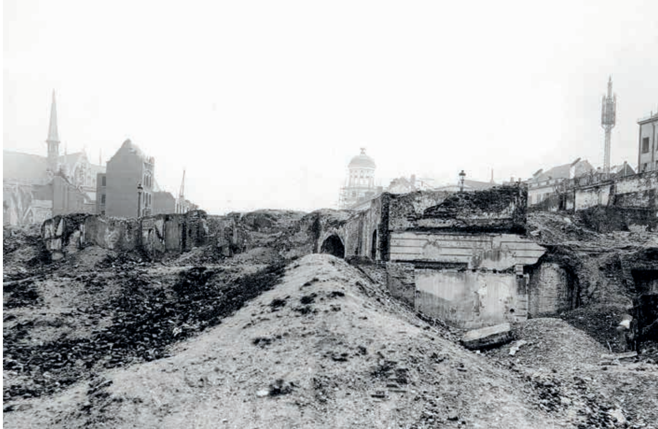
2. Aan het begin van de twintigste eeuw werden delen van de volksbuurt Putterij gesloopt om ruimte te maken voor de Noord-Zuidverbinding. De braakliggende terreinen, met inbegrip van de restanten van muren en de achtergebleven afbraakmaterialen, bleven lange tijd onaangeroerd

suggereert een zekere stabiliteit in het beleid.