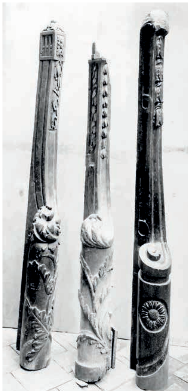
4. Gedemonteerde traponderdelen