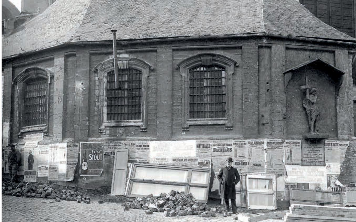
7. Afbraakmaterialen zijn te zien in de foto's die tijdens afbraakwerken werden gemaakt in Brussel tussen 1860 en 1940. Deze foto, genomen in 1907, toont gesorteerde houten balken, bakstenen en gedemonteerde ramen