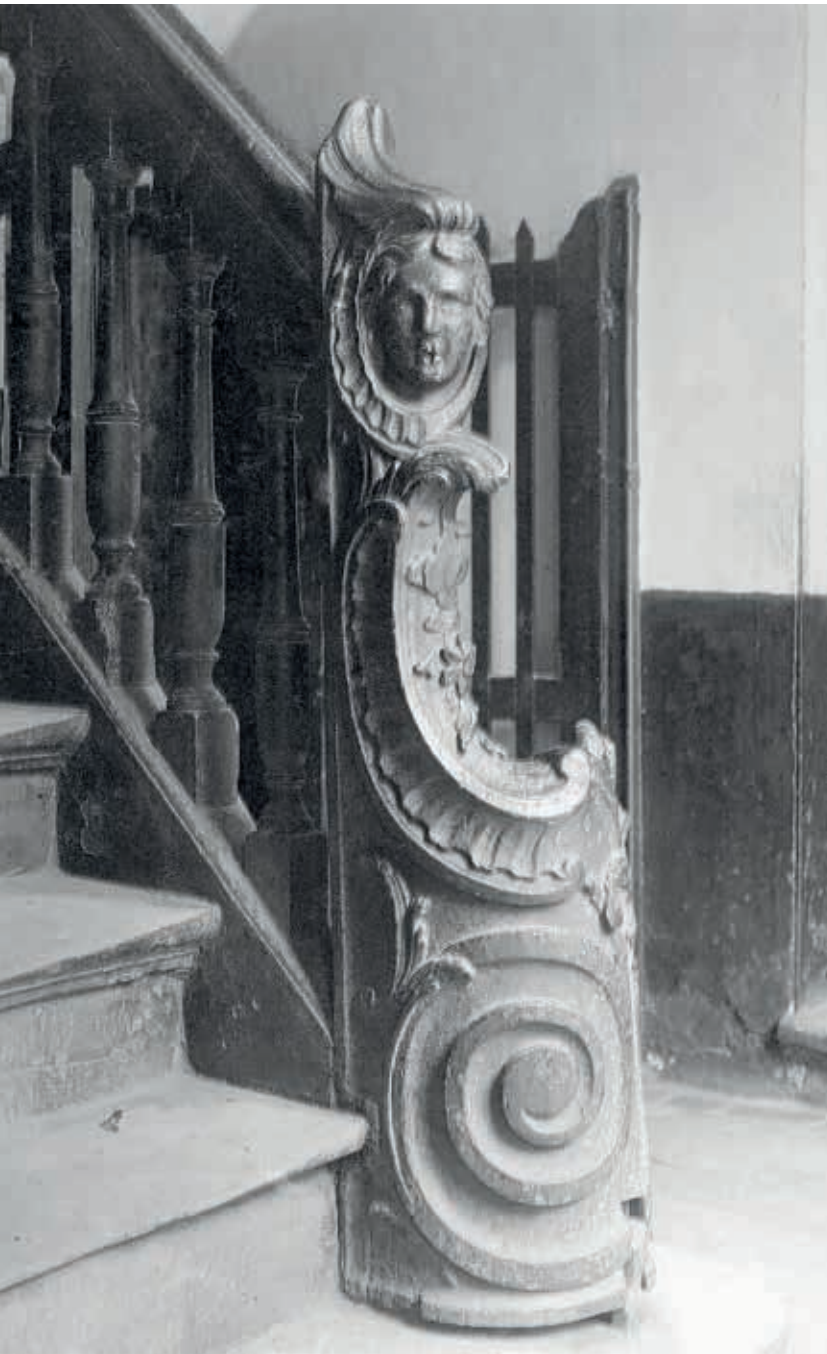
6. Foto genomen door het Comité d'Etudes du Vieux Bruxelles van een traponderdeel in de Terarkenstraat 12, dat later in 1909 werd opgeslagen in de stadsdepots in Sint-Jans-Molenbeek (foto Comité d'Etudes du Vieux Bruxelles, KIK-IRPA, Brussel)

ter Buis, die het Comité van 1906 tot 1914 leidde, stelde voor om in het Jubelpark een architectuurhistorisch openluchtmuseum op te richten waar interessante bouwfragmenten konden worden tentoongesteld. 20 Hoewel dit openluchtmuseum niet werd gerealiseerd, hebben de inspanningen van het Comité ongetwijfeld bijgedragen aan de bewaring van meer dan tweehonderd architecturale elementen in de stadsdepots in Sint-Jans-Molenbeek (afb. 1, 6). 21