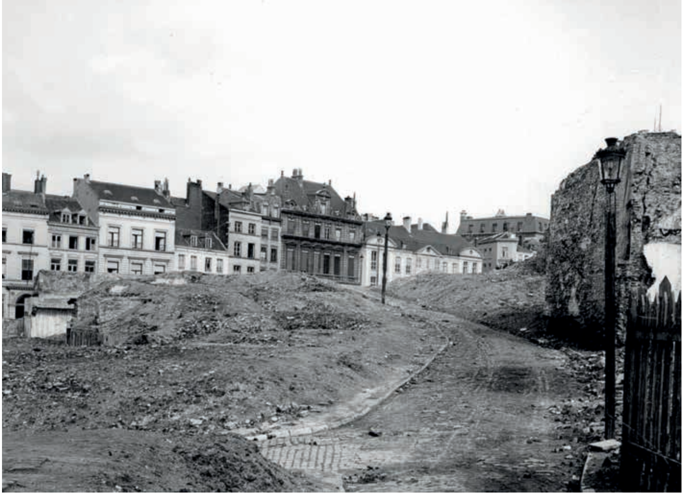
12A en B. De stedelijke overheid vroeg afbraakaanemers om kelders, beerputten en andere putten op te vullen met puin en aarde tot op straatniveau. Dit resulteerde in een heuvelachtig landschap dat de kronkelende straten van de oude wijken volgde, zoals te zien is op een foto uit 1910 van de voormalige Putterijwijk