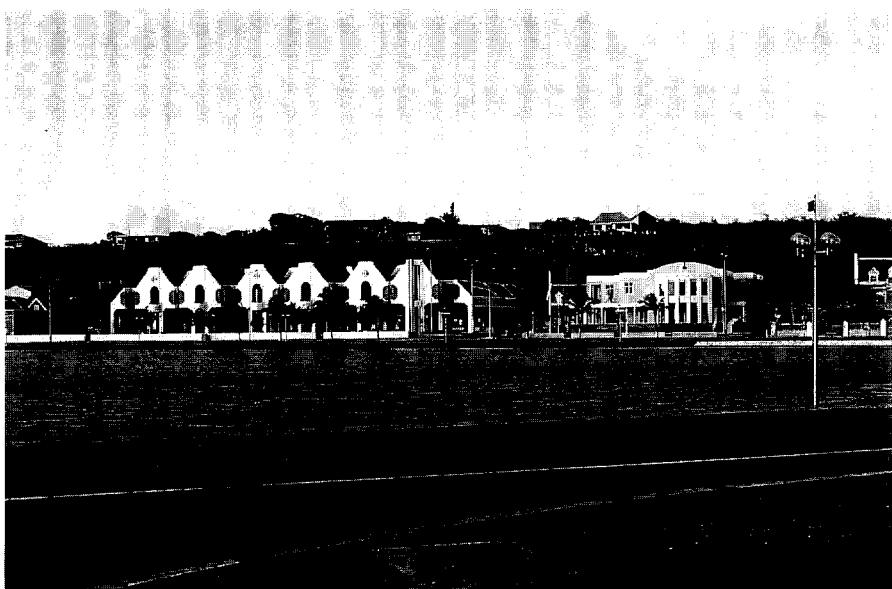
Afb. 3. Links de Openbare Bibliotheek van architect Janga, rechts het Curoil-gebouw.

buur rekening houdt met de oude buurtbewoners, maar nu eenmaal zijn eigen karakter heeft.