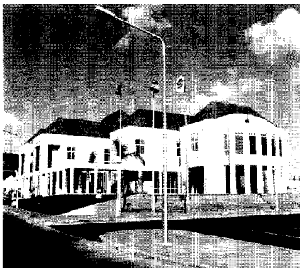
Afb. 2. In moderne schaal bouwen met oude elementen: het Curoil-gebouw.

De derde stroming streeft eveneens een assimilatie van oude en nieuwe vormen na. Het verschil zit in de manier waarop dit bereikt wordt. Men toont respect voor de schaal en vormtaal van de omgeving, maar handhaaft toch een eigentijdse identiteit. In wezen ontstaat een modern vormgegeven gebouw, maar het verband met de omgeving is onmiskenbaar. Een goed voorbeeld is de Openbare Bibliotheek van architect Janga. Het bewijst dat het mogelijk is om grote bouwvolumes terug te geleiden naar de maten van de omliggende oude bebouwing. De materiaaltoepassing is eerlijk: ieder tijdperk bouwt met de materialen die het zelf voortbrengt, of heeft geërfd vanwege gebleken functionaliteit. Het resultaat is een modern gebouw dat als goede nieuwe