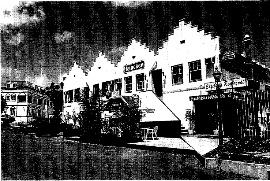
Afb. 4. New Amsterdam Plaza, Sint Maarten: waar imitatie een toeristische truc wordt.

Maar niet alleen de buitenwijken vallen ten prooi aan de 'open' stedenbouw. Ook in de binnenstad wordt de voetganger vaak geconfronteerd met grote onbeschutte vlaktes. Niet dat dit ingegeven is door de oorspronkelijke structuur. In het oude Willemstad bestonden geen grote pleinen, met uitzondering van het Wilhelminaplein dat meer als een plantsoen was opgezet, het Fort Amsterdam, het Brionplein, en het huidige Hendrikplein, waarvan de twee laatste een militaire achtergrond hadden. Zelfs kleinere pleinen als het Pietermaai-plein en het Gomezplein zijn pas ontstaan in de eerste helft van deze eeuw, als gevolg van kaalslag. In tegenstelling hiermee staat bijvoorbeeld de ontwikkeling van de busterminaal van Otrabanda, die zich als een open vlakte uitstrekt naast het brugviaduct, dat ook al een onbeschutte open voor door de stad trekt.