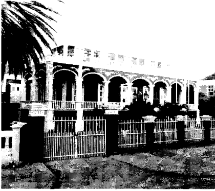
Afb. 6. De 'bruidstaart'. De charmante chaos die dit mooie woonhuis aan het einde van de Scharloeweg veroorzaakt door haar afwijkende dakvorm, geleding en ornamentiek, zou nooit ontstaan zijn indien op basis van de voorliggende ontwerpvoorschriften een bouwwaanvraag was ingediend.

Parafaserend kan worden gesteld: Een stad vernieuwt zichzelf. De taak van de overheid is het toezien op een evenwichtige en sfeerhoudende ontwikkeling van de stedelijke functies, door de actieve bescherming van te behouden objecten en gezichten, en een stimulerende begeleiding van vernieuwende ontwikkelingen.