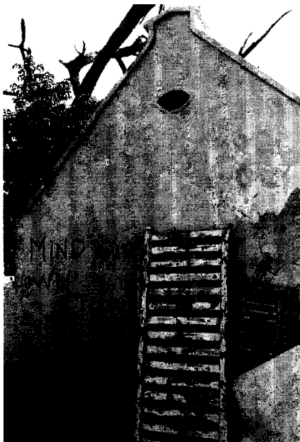
Afb. 8. Inpraak in het binnenstadsbeleid...

Secretariaat Stadsvernieuwing geleid tot een verbetering van de onderlinge afstemming tussen de verschillende actoren in de besluitvorming. Overheidsdiensten, andere openbare lichamen zoals de volkshuisvestingsstichting FKP, en particuliere organisaties als de Stichting Monumentenzorg en de buurtorganisatie Plataforma Otrabanda, alsmede de externe adviseurs treffen elkaar regelmatig, met een beslissingsgerichte agenda.