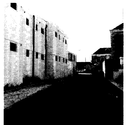
Afb. 7. Hoek IJzerstraat/De Rouvilleweg: de stad de rug toekeren mag in de IJzerstraat.

Het geïnstitutionaliseerd overleg over de binnenstad heeft onder de bezieling van het