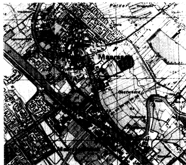
Topografische kaart Maarsse en omgeving.

In maart 1988 verscheen deel a van de Vierde nota over de ruimtelijke ordening: de voorbereiding. Een nota over de ruimtelijke ordening heeft tot doel richting te geven aan het ruimtelijk beleid in Nederland en doorloopt de procedure van de planologische kernbeslissing. Dat wil zeggen dat na het voorbereidende deel twee delen volgen die betrekking hebben op de inspraak, waarna deel d de regeringsbeslissing geeft. Deel e, tenslotte, bevat de definitieve beleidsbeslissing zoals die in de Kamer is genomen. De delen a, d en e bestaan uit tekst en kaarten, die met elkaar aangeven wat, waarom en waar. In de delen a en d zijn naast de (voorlopige) beleidskaart, waarover beslist moet worden, ook toelichtende kaarten opgenomen, die samen met de tekst de achtergrond geven van waaruit de nota geschreven is. Als een van die toelichtende kaarten maakte ik een kaart van Noordwest-Europa. . . Op die kaart wordt nog meer malen teruggekomen.