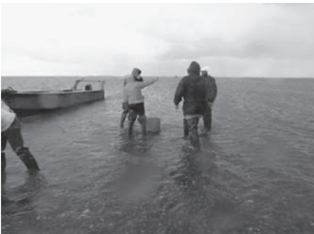
Oesters rapen en eten bij eb (Jos Bosman)

Waddenvereniging pleitte hij voor het alternatief om de bestaande dijk te verhogen en het buitendijks gebied te laten zoals het is. Na aandacht voor de keuze tussen de twee alternatieven in het dagblad Trouw , in 1978, ging het plan voor de laatste inpoldering van het buitendijkse gebied in 1979 van de baan. 'Pootaard-appelen zijn mooi voor Friesland maar de Waddenzee is nog mooier' zei toen premier Dries van Agt. 14 De uitspraak getuigt van een bewustwording en veranderd begrip van de Waddenzee in Nederland, terwijl het in de beleving van de Duitse burens nog steeds om de Noordzee ging, waar zij bij gebrek aan strand in diezelfde jaren zeventig ijverig het buitendijkse wad met zand opspotten, ter uitbreiding van de zonnebaadcapaciteit op de er tegenover gelegen overvolle Waddeneilanden. Nederland kent ook een hoek vlakbij de Duitse grens waar hetzelfde voor een ander doel gebeurde. Een enorm stuk wad werd met zand opgespoten als stabiele basisvorm voor de contour van de Eemshaven. De aanleg van de Eemshaven is posthuum uitgevoerd naar ontwerp van waterstaatkundig ingenieur Johan van Veen, die overleed in 1959. De Provinciale Staten van Groningen besloten in 1968 de Eemshaven te realiseren. Het begin van de aanleg startte in 1972 en de haven werd al in juni 1973 door koningin