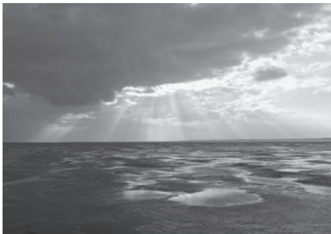
Hilgenriedersiel, grijze Waddenstemming tussen het eiland Norderney en de vastelandskust van Ostfriesland

De Waddenzee is een trilateraal beheerd gebied, en vormt om die reden een bijzondere uitzondering in het rijtje van de - tot dusver negen - 'objecten' van het Werelderfgoed van Nederland. 1 Het natuurmonument wordt in het bijzonder vanuit een platform in Wilhelmshaven wereldwijd onder de aandacht