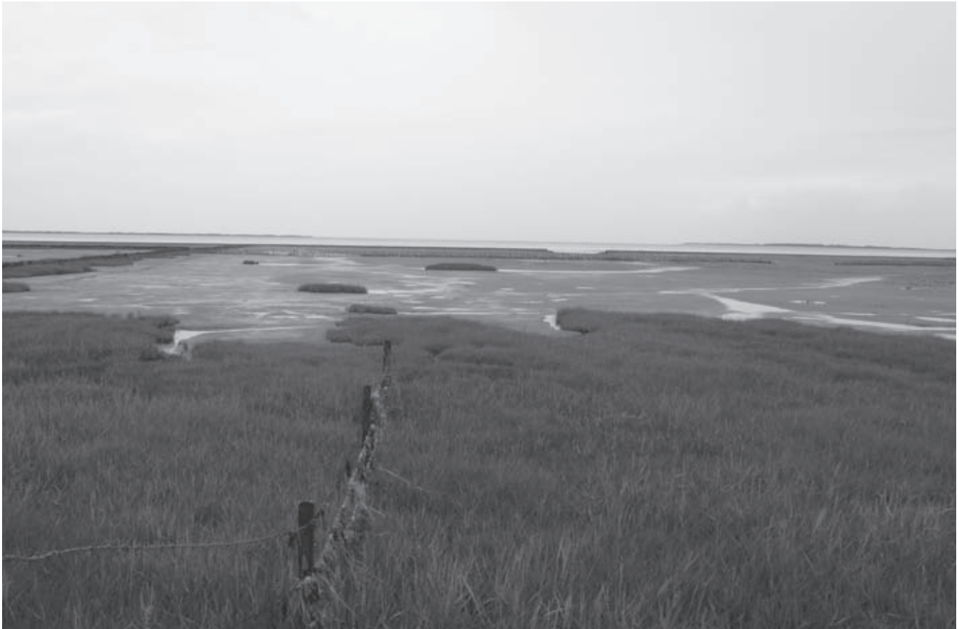
Zicht op de Waddenzee bij Nessmiersel, Ostfriesland (Jos Bosman)

proces hebben achtergelaten. Het coherente, totale, dynamische getijdengebied wordt vijf keer door diepe, extra uitgebaggerde – en in die zin statische – vaargeulen onderbroken. De oorsprong van drie geulen maakt overigens wel deel uit van het natuurlijke getijdengebied: ze vallen samen met en liggen in het verlengde van de estuaria (mondingen) van de Eems, Wezer en Elbe. De twee andere geulen zijn aangelegd voor de havens van Esbjerg (1868) en Wilhelmshaven (1896, als marinebasis van Pruisen). Behalve dat de havenactiviteiten van de grote steden hun sporen hebben getrokken door de Waddenzee – wat betreft Amsterdam is dat spoor uit de Gouden Eeuw zo goed als uitgewist sinds de Afsluitdijk er staat – zo lopen er vanuit de stedelijke gebieden ook hele gerichte sporen over land en via het luchtruim naar de kust. Amsterdam, Berlijn en Hamburg zijn vrij efficiënt aangetakt op hun voorkeurseilanden, respectievelijk Texel, Vlieland en Terschelling (vanuit Amsterdam) en Sylt (vanuit Hamburg en Berlijn). 18 Vanuit de Ardennen en het Roergebied worden vooral de Oost-Friese eilanden druk bezocht.