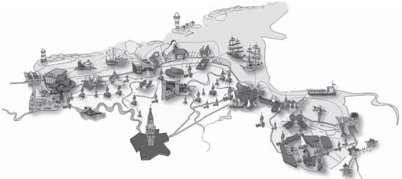
Waddenkroon, schets van bureau Bosch en Slabbers