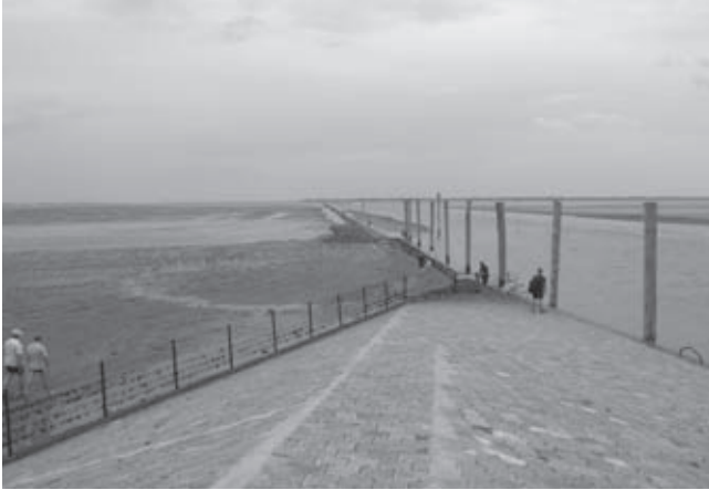
Bezoekers van de Waddenzee bij Nessmiersel, Oostfriesland

zelf, boven de generieke vette kibbeling, die er op dit moment meestal als de ‘authentieke’ lokale hap wordt verkocht.