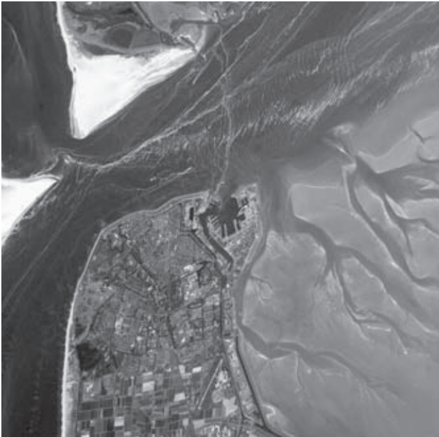
De punt van Texel en Den Helder, en het getijdengebied duidelijk zichtbaar in beeld (NASA, 2007)

Waddenzeekust onder woorden worden gebracht, zowel vooruitkijkend naar de toekomst als terugkijkend naar het verleden. 7