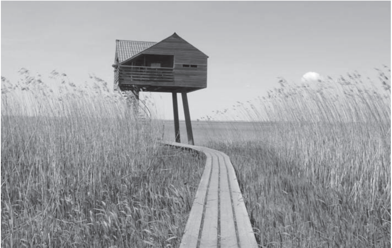
De vogelkijkhut Kiekkaaste in Nieuwe Statenzijl (Jos Bosman)

dijk aanleggen, op locaties waar tot dusver nog geen fietspad bestaat, zodat een lange fietstocht langs de Waddenzee mogelijk wordt in 2015. In Friesland wordt daar blijkbaar anders over gedacht dan in Groningen, want It Fryske Gea stelt dat fietsen voor langs de dijk vrijwel overal in Friesland mogelijk is, maar dat dat niet wenselijk wordt geacht. 26