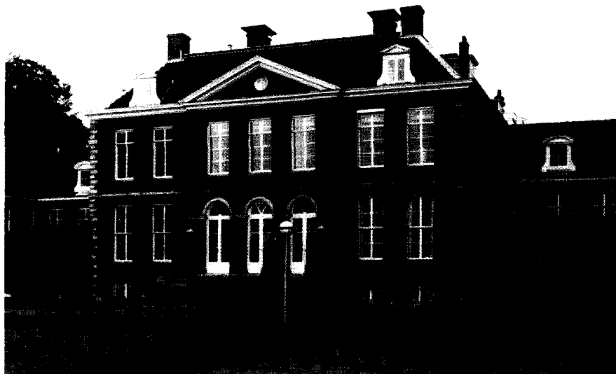
Afb. 2. Abraham van der Hart (toegeschreven), De Bilt, huis Houdringe, voorzijde, 1799.

Meertens, die al eerder in de kolonie Deme-