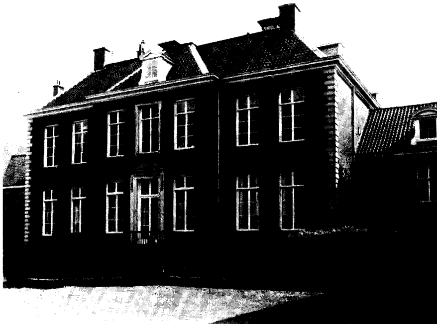
Afb. 3. Abraham van der Hart (toegeschreven), De Bilt, huis Houdringe, achterzijde, 1799.