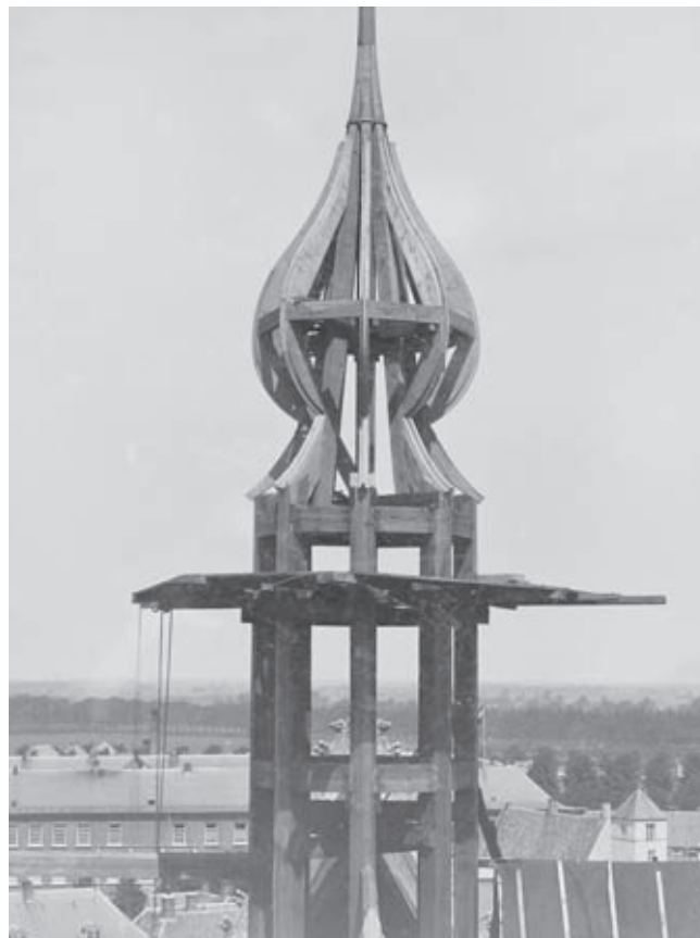
Afb. 7. Vieringtorentje Grote Kerk Breda in aanbouw (foto RDMZ circa 1905)

Ondanks de bovengenoemde strubbelingen verliepen de werken van de eerste fase zo voorspoedig dat in 1908 voorzitter Tydeman trots aan de algemene vergadering van de restauratiecommissie kon melden dat de eerste fase van zes jaar was afgerond. In die zes jaar waren de daken van de middenbeuk aangepakt, de balustrades vervangen, de bovenste anderhalve meter muurwerk van de lichtbeuk hersteld (afb. 8) en de toppen van de transeptgevels herbouwd. Verder was de H.Grafkapel zo goed als herbouwd. Hierbij is een aantal zeer ingrijpende maatregelen volledig buiten alle discussie gebleven,