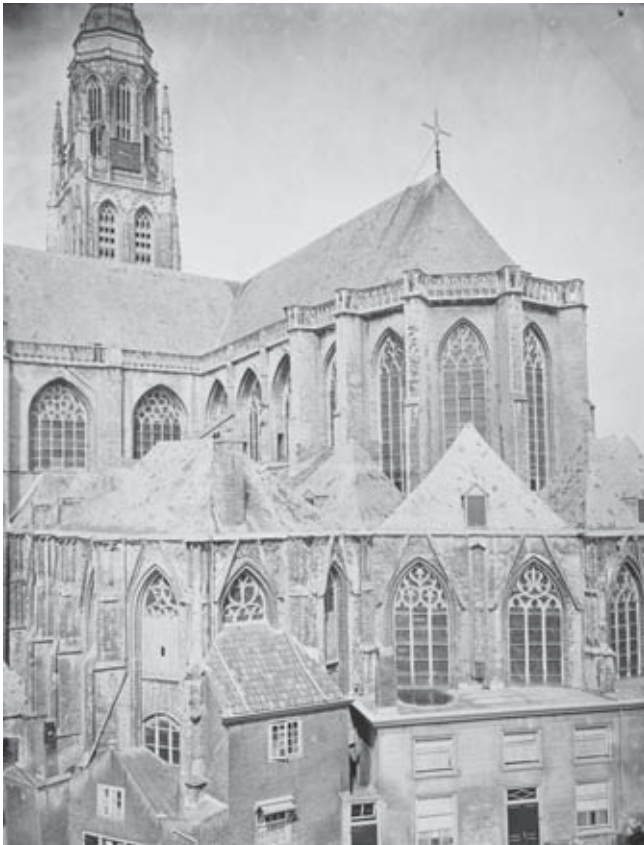
Afb. 1. Grote Kerk Breda gezien vanaf het zuidoosten, oudste foto van het exterieur (foto Kannemans & Zoon Breda, 1865)

Restauratiegeschiedenissen van monumenten beginnen doorgaans met de grote en relatief goed gedocumenteerde restauraties uit de tweede helft van de negentiende eeuw. Gezien de tegenwoordig gebruikelijke cyclus van veertig tot zestig jaar voor een grote restauratie, kunnen we aannemen dat in de vier eeuwen tussen het bouwen en het restaureren (vanaf midden negentiende eeuw) er diverse ingrijpende 'reparaties' hebben plaatsgevonden die ook in de huidige optiek de benaming 'restauratie' verdienen. Uiteraard verschilt de theoretische, organisatorische en financiële achter-