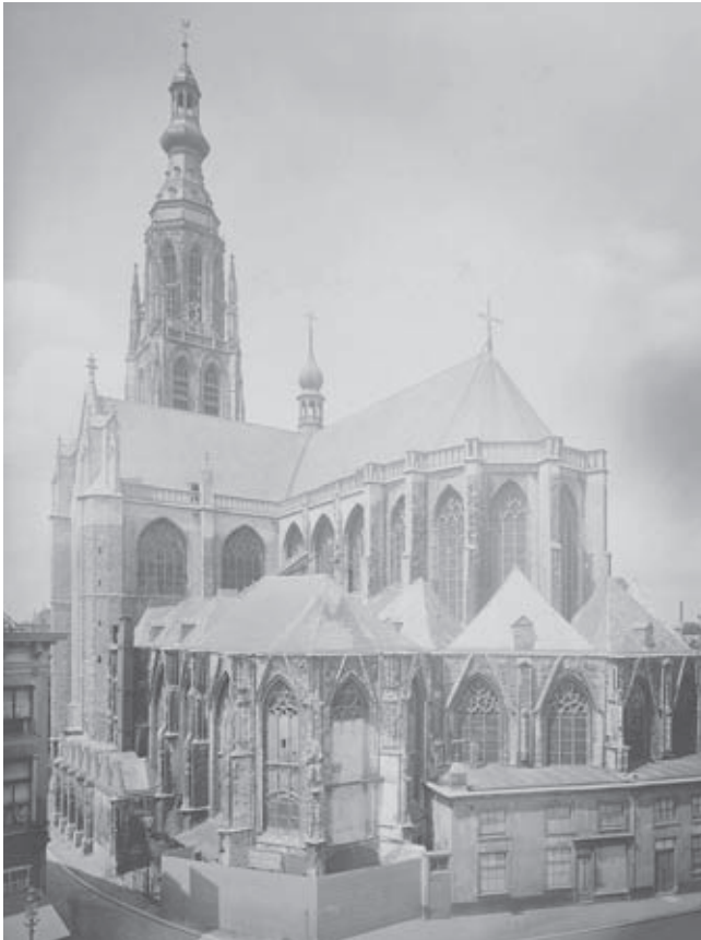
Afb. 8. De Grote Kerk in Breda gezien vanuit het zuidoosten (foto RDMZ begin 20e eeuw)

In deze fase werden eerst het hoogkoor met het herenkoor, de prinsenkapel en Niervaartkapel aangepakt. Vervolgens was de consistorie, waarmee men al begonnen was, met de bovenliggende zogenaamde kapittelzaal aan de beurt en als laatste onderdeel de kooromgang.