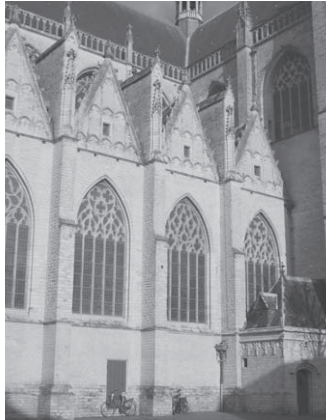
Afb. 10. Zuidzijde van het schip, huidige toestand (foto D.J. de Vries 2010)