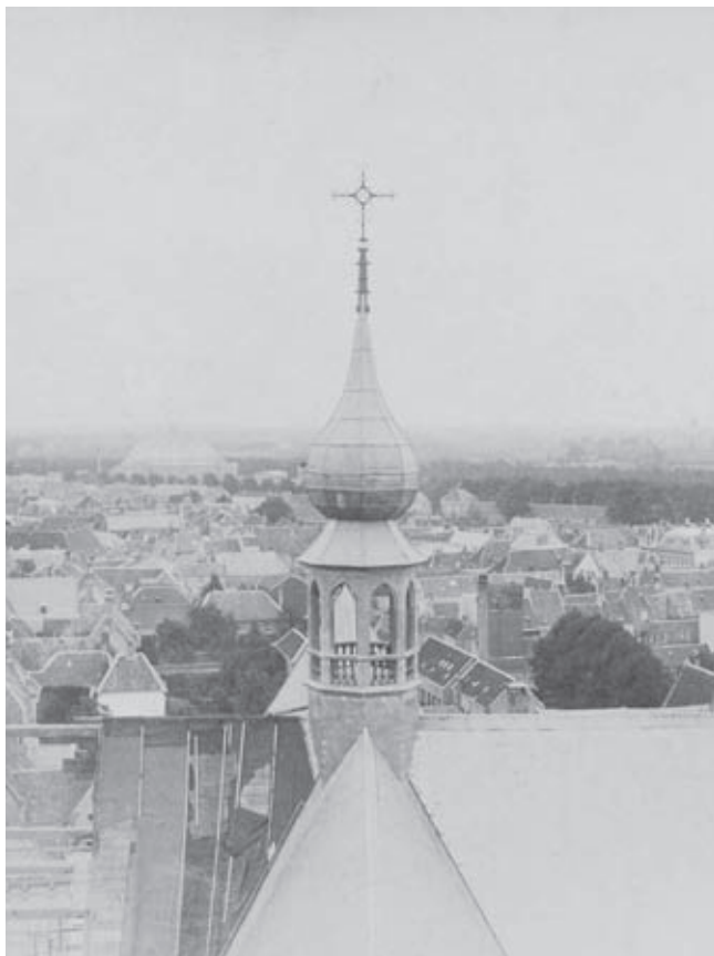
Afb. 6. Vieringtorentje Grote Kerk Breda gereed

meter brede achtkante lantaarn met hoge naaldspits: een echte 'angelustoren'.