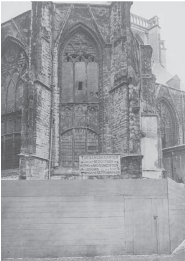
Afb. 2. Oostgevel van de consistorie en 'librije' waarbij de vergaande verwerking van het beeldhouwwerk duidelijk te zien is

Terwijl Rijk, provincie en stad de restauratie van de toren in 1874 tot een goed einde brachten, zat de kerkvoogdij nog opgescheept met het zo mogelijk nog grotere probleem van de zorgwekkende toestand van de kerk. Het tegenstribbelen van de kerkvoogdij als het op betalen voor de toren aankwam, was voor een groot deel te verklaren uit de wekelijkse confrontatie van de ambtsdragers met een steeds verder aftakelend kerkgebouw. Door alle perikelen rond de toren was de kerkvoogdij er wel van doordrongen dat op de geldelijke bijdragen van de Domeinen niet meer gerekend hoefde te worden en dat het Rijk diende bij te springen. Uiteraard was het voor onder anderen P.J.H. Cuypers duidelijk dat ook de kerk ingrijpen behoefde. Victor de Stuers, referendaris van de afdeling Kunsten en Wetenschappen van het ministerie van Binnenlandse Zaken, stuurde in 1874 een wat verwarrende brief aan de kerkvoogdij waarin hij wees op ernstige gebreken van “de S. Maria Magdalenakerk...met haar choor met ambulatorium en kapellenkrans, schone proportiën en zeldzame graad van voltooidheid”. 28 Dankzij de grote waarde van gebouw en meubilair zou een oproep om financiële steun bij de restauratie volgens hem niet onbeantwoord blijven.