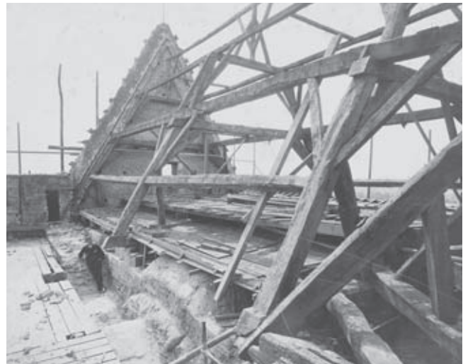
Afb. 5. Toestand van de kap boven het zuidtransept na ontmanteling. Het muurwerk is sterk afgebrokkeld en de kapvoet door houtrot grotendeels verdwenen