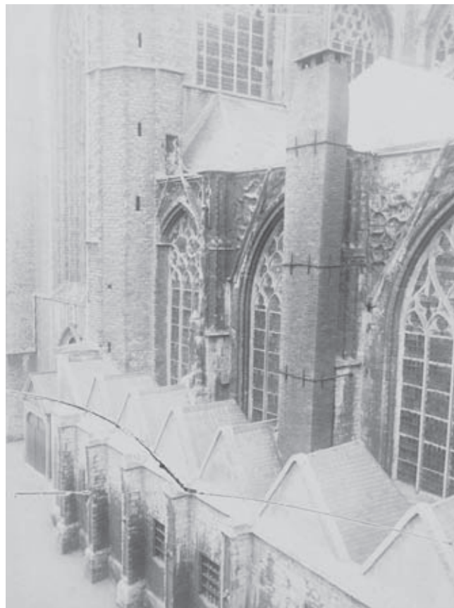
Afb. 4. Zuidgevel van het nieuwe pastoorshuis