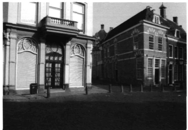
Afb. 1 Onbegrijpelijke niet toegankelijke gevels met combinaties van stijlen en perioden in de geschiedenis die voor de restauratie nooit gezamenlijk zichtbaar waren: Hoek Kromme Nieuwegracht, Achter de Dom, Utrecht (juni 2006)

hun architectuur heeft leren kijken. Dat gebeurde naast de reeks reisboeken door de uitgave van de Penguin Dictionary of Architecture en tenslotte door vanuit 'Engeland' in An Outline of European Architecture een beknopt overzicht en afgerond verhaal te presenteren dat voor generaties architectuur- en kunsthistorici als eerste kennismaking voor hun verder te ontwikkelen visie bepalend is geweest. 5 Ondertussen zullen Nederlanders anders naar de architectuur gaan kijken door de reeks maar ook doordat stijlontwikkeling in een zeer beknopt boekje door Stenvert en Blijdenstein is vastgelegd. 6 Het wachten lijkt nu op een vanuit Nederlands perspectief geschreven beknopte architectuurgeschiedenis. Maar misschien kunnen en willen steeds meer onderzoekers die niet meer los zien van de ons omringende en omringd hebbende architectonische culturen. Misschien is het tijd voor een nieuwe 'Outline of European Architecture' die probeert samenhang te schetsen maar met gebruikmaking van de tot nu toe vooral nationaal en regionaal en in mindere mate toch ook al typologisch gegroepeerde studies. Dat zou verstandiger zijn dan een bewerking van de voornaamste elementen van deze boeken tot een architectuurgeschiedenis van Nederland. Dan zou namelijk de auteurs kunnen overkomen wat Pevsner