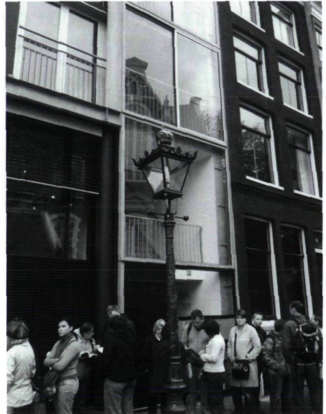
Afb.3 De rij om de hoek van de toegang naar Anne Frankhuis met historiserende fantasielantaarn, Amsterdam (foto auteur, juni 2006)

ring'. 8 Dat Nederland als cultureel onderscheiden eenheid misschien nauwelijks langer dan een eeuw bestaat maakt dit wel een moeizame opgave. Het is zelfs de vraag of ondanks oranjetrots bij schaatsen, voetbal en 'Dutch Design' de voltooid verleden tijd in de vorige zin niet adequater is.