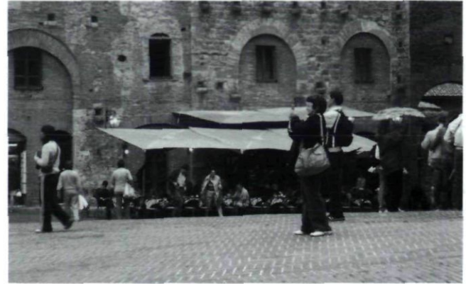
Afb.6 Toeristen in San Gimignano, Italië, september

Belangrijk is dat kunsthistorici en architecten steeds meer in gesprek raken en dat ook in nog wijder kring van andere historische, geografische en sociaal-wetenschappelijke disciplines steeds meer bereidheid blijkt tot samenwerking. Daarbij moet niet gelijk gestreefd worden naar een totaal geïntegreerd verhaal, maar zou eerst gekeken moeten worden welke vragen aan architectuurhistorici gesteld zouden kunnen worden