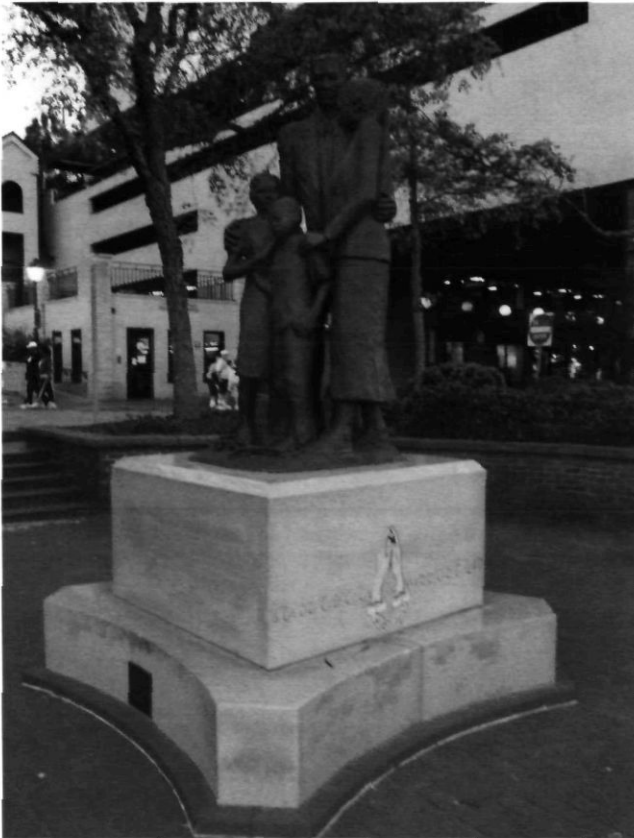
Afb. 7 Slavery Monument, Riverfront, Savannah Georgia, V.S., 2002 (mei 2006)