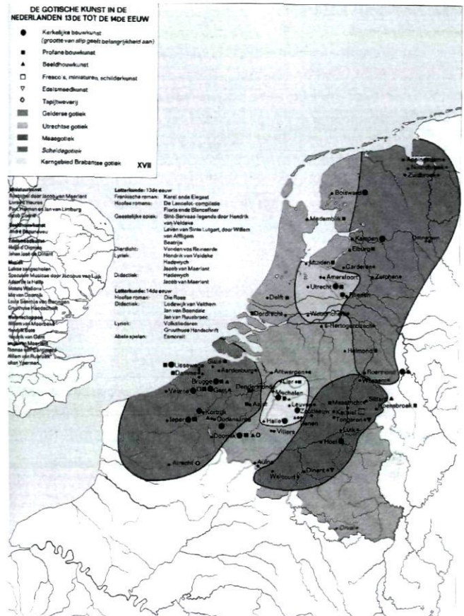
Afh.5 De Nederlandse regio's in de 13de en 14de eeuw (idem XVII)

Maar ook de schijnbare vanzelfsprekendheid van de natiestaat als ordenend principe bij architectuurhistorisch onderzoek werd voorzichtig aan de orde gesteld bij de Universiteit Utrecht en de Katholieke Universiteit Leuven. Het onderzoek naar de 17de en 18de eeuw in de Nederlanden wil dan ook de constructie van de tegenstelling land van Rembrandt en land van Rubens niet meer accepteren. Nieuw is dit niet geheel want ook historici hebben meermalen geprobeerd tenminste de geschiedenis van Nederland en België gezamenlijk te behandelen. Heel mooi wordt deze problematiek ook getoond door twee kaarten in de Kleine historische Winkler Prins, die wel al Nederland en België gezamenlijk maar nog vrijwel totaal gescheiden behandelt. 10 Al snel is ook bij het Nederlands Vlaamse project besloten bij vrijwel alle deelonderzoek-