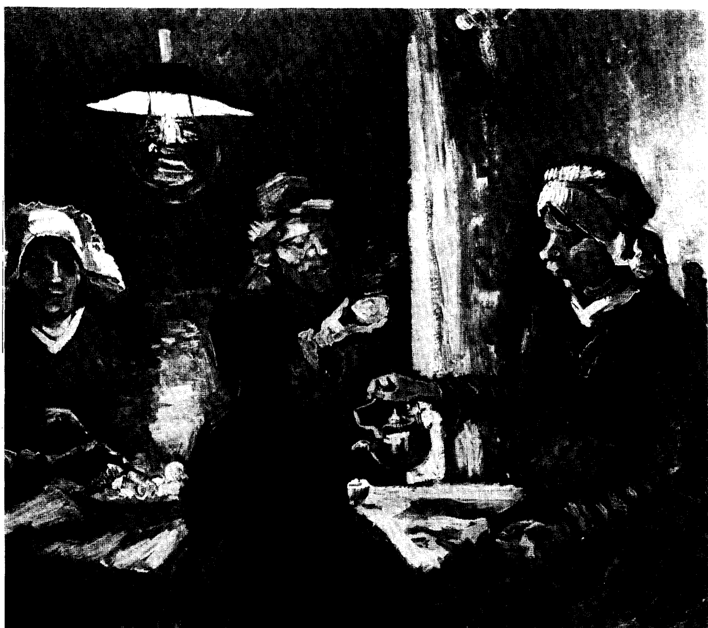
▲ Vincent van Gogh, aardappeleters, 1885.

gelakt staalmat o.i.d. waren voorzien en bij de schilderijen consequent aan de achterzijde extra hang- en sluitwerk was aangebracht zou een dergelijke diefstal, gezien de vertragingen welke dan optreden, aanzienlijk riskanter zijn geweest en mogelijk achterwege zijn gebleven. Tot op het moment dat dit geschreven wordt zijn dergelijke simpele, maar effectieve maatregelen, welke voor het gehele museum de f 50.000,— niet zullen overschrijden, om onbegrijpelijke redenen achterwege gebleven. Misschien toch een kwestie van mentaliteit, zoals de Algemene Rekenkamer al eerder constateerde, maar dan wel met als gevolg iets wat men nu langzamerhand wel als grote naïviteit en grove nalatigheid zou kunnen betitelen.