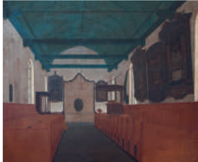
Afb. 5. Schilderij van het kerkinterieur van IJsbrechtum kort voor 1865. De lutherse predikant Wolter, die in 1869 wordt rondgeleid door de pas gerealiseerde kerk, merkt na dit bezoek op dat de Nederlandse kerken een koude, kale indruk maken en contrasteren met de kerken in zijn herkomststreek en de vriendelijkheid van de Nederlanders (foto J. Mellema, in opdracht van het kerkbestuur)

naar witters voor dat stucwerk toe. Stukadoors beschikten over de grondstof en de speciale vaardigheid om het verwerkingsgereed te maken: het blussen van de kalk.