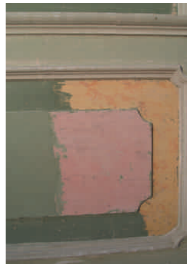
Afb. 13. Bij de restauratie van het stucwerk in de kerk van Baaijum, oorspronkelijk in 1876 door de Oldenburgse stukadoor J.D. Fast gemaakt, kwamen wanddecoraties met roze, gele en groene kleuren te voorschijn. Bij de betrokken restauratie-architect en ingewijden in de Friese kerkenbouw is zo'n toepassing in Friesland niet bekend. Dit wijst op een Duitse invloed

Nam de invloed van Oldenburgers op de architectuur in ons land sinds Logeman af, in de derde periode drukten enkele geëmigreerde en geïntegreerde stukadoors lokaal een Duits stempel op het straatbeeld. Misschien groeide het zelfbewustzijn bij deze groep zodanig dat dit kon gebeuren. Gebouwen die zij op eigen initiatief maakten, weerspiegelen die Duitse invloed. Het betreft een vrijstaand woonhuis en een kleinschalige