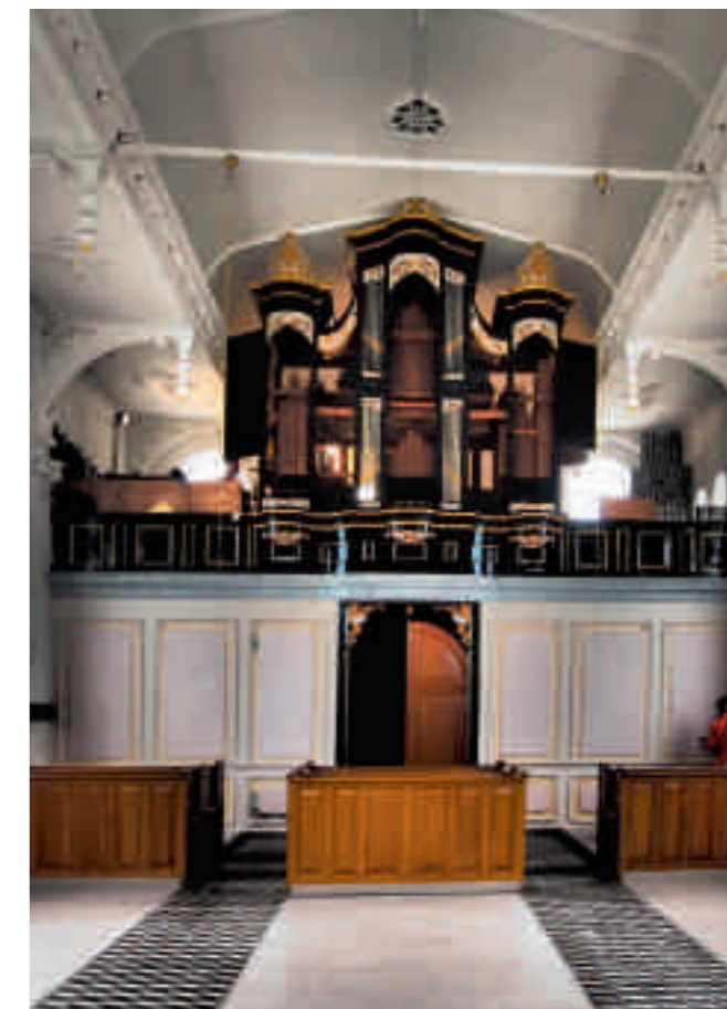
Afb. 14. Vanwege het stucwerk in de kerk van Baaijum kreeg deze kerk de status van monument. De restauratie is in 2012 voltooid onder leiding van de architecten Kijlstra & Brouwer (foto Kijlstra & Brouwer)

Hoogwaardig vakmanschap kenmerkt het Oldenburgs stucwerk in de pioniersfase van 1775 tot 1825. In de sporen van Husly droeg Logeman bij aan de verbreiding van het neoclassicisme in