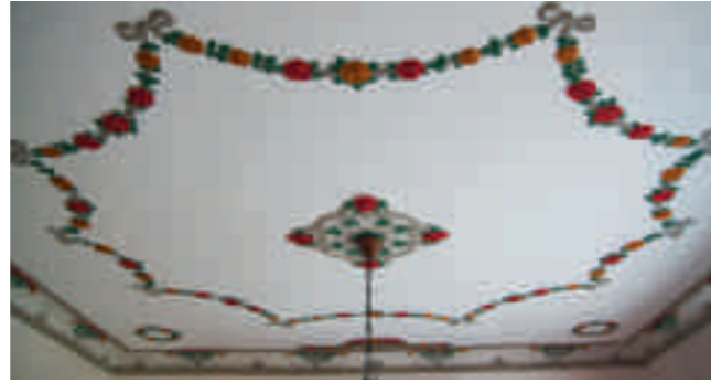
Afb. 7. Het stucwerk in de boerderij van familie Willers in Oberlethe, het geboortedorp van J.B. Logeman, is waarschijnlijk gebaseerd op werk dat de maker kende uit Nederland. De boerderij is sinds de begintijd van de Oldenburgse stucraditie in bezit van de familie Willers die tot de vroegste stukadoorsfamilies kan worden gerekend

Nederlandse kerkinterieur dat afwijkt van wat hij gewend was: 'In IJsbrechtum führte mich dominee Waalkes in seine neue, helle und freundliche Kirche, die gewiss für Holländer schön war, aber für uns Deutsche immer etwas Kahles und Kaltes hatte' (afb. 5). 68 En predikant Schauenburg in 1886: 'Der saubere und nüchterne Sinn der Holländer liebt weisse Decken und Wände und auch die Verzierungen in weiss übertünchter Stuckarbeit. Beide, sowie die äussere Versehung der Häuser mit Stückverzierung beschaffen die stukadoors. Wie lohnend diese Arbeit sein muss, sieht man an den mit städtische Eleganz eingerichtete Häusern der Stuckmeister' (afb. 6). 69