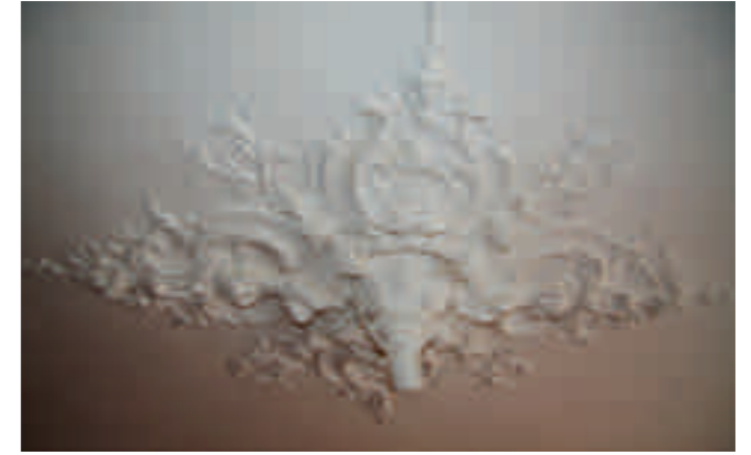
Afb. 8. Dit ornament in de 1890 door Gerdes gebouwde boerderij in Oberlethe is gegoten en identiek met het ornament in een villa in Borne, die gebouwd is in 1891. Het ornament in Borne is onderdeel van een gesjaboneerd plafond (noot 13, 497). Die techniek werd in de loop van de negentiende eeuw vaker toegepast

De opdrachtgevers in deze periode waren burgers, ondernemers en publieke en particuliere instellingen. De orderportefeuille van