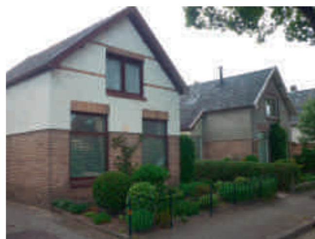
Afb. 12. Stukadoor B.H. Brüggemann, telg uit van één van de vroegste stukadoorsfamilies in Oberlethe, bouwde in 1926 in zijn woonplaats Apeldoorn een aantal huizen met een gepleisterde bovengevel. Volgens zijn nazaten is deze stijl geïnspireerd op woningbouw in Noord-Duitsland

In deze periode zijn 400 nieuwkomers genoteerd. 84 Vooral het aantal seizoenarbeiders daalde. De totale vraag naar stucwerk was