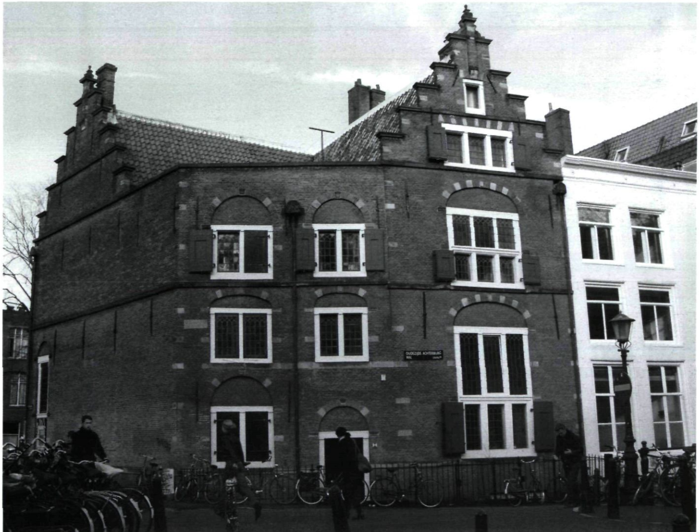
Afb. 2 Amsterdam, Oudezijds Voorburgwal 249, achtergevel na de restauratie van Jan de Meijer (M. Haaksman 2003)

De eigenaar van het pand, de firma Boele en van Hensbroek, wenste een reconstructie naar de oorspronkelijke toestand en gaf De Meijer hiervoor de opdracht. 5 Om de reconstructie zo correct mogelijk uit te voeren, deed De Meijer uitgebreid archief- en bouwhistorisch onderzoek. Dit onderzoek is gepubliceerd in het tijdschrift Bouwkunst uit 1910. 6 Met de reconstructie kregen alle toppen hun getrapte vorm terug en de vensters in de voorgevel werden vervangen door kruiskozij-