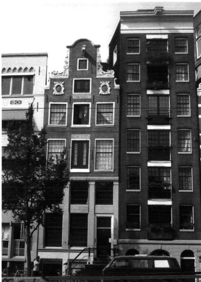
Afb. 11 Amsterdam, Nieuwezijds Voorburgwal 66, na de restauratie van A.A. Kok (M. Haaksman 2003)

architectonische argumenten oordeelen; ongetwijfeld spreken beide partijen met volle overtuiging haar meening uit; echter is het in dit geval gewenscht, de betrokkenen op de snelste wijze te helpen". 40 De plannen van Kok konden dus uiteindelijk doorgaan doordat het belang van de eigenaar en de schoonheid van het pand belangrijker bleken te zijn dan de historische ontwikkeling van het gebouw.