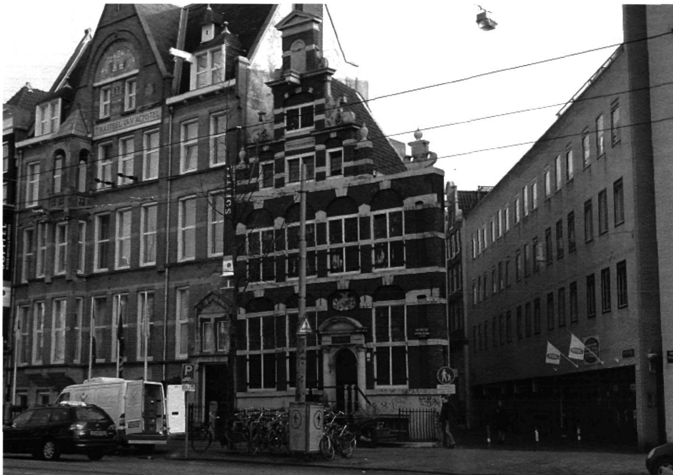
Afb. 4 Amsterdam, Nieuwezijds Voorburgwal 75, na de restauratie van Jan de Meijer, inmiddels in een nieuwe omgeving (M. Haaksman 2003)

nog voor het aantreden van een Schoonheidscommissie. Hoe er in de tijd van deze restauratie over de reconstructie gedacht werd is daarom niet meer te achterhalen. Opvallend is dat de restauraties van De Meijer van na het opstellen van de Grondbeginselen en het aantreden van de Schoonheidscommissie weinig verschil vertonen met de restauratie van Oudezijds Voorburgwal 249. Het Makelaarscomptoir, Nieuwezijds Voorburgwal 75, gerestaureerd in 1937, is hier een voorbeeld van. 9 Het exterieur van dit van oorsprong renaissancepand, gebouwd van 1633 tot 1634, was in de negentiende eeuw drastisch veranderd. Door inwatering van het metselwerk en verrotting van de strijk balk en spanten waren de ankers en houvasten losgeraakt, waardoor de gevel dreigde in te storten. 10 In 1836 was daarom besloten de gevel vanaf de eerste verdieping af te breken en opnieuw op te metselen. De zeventiende-eeuwse trapegevel werd hierbij vervangen door een klokgevel naar negentiende-eeuws model (afb. 3). De oorspronkelijke kruisvensters van de bel-etage waren bij een eerdere verbouwing in 1739 al vervangen door schuifvensters met een roedenverdeling van vier roeden in de breedte. Van