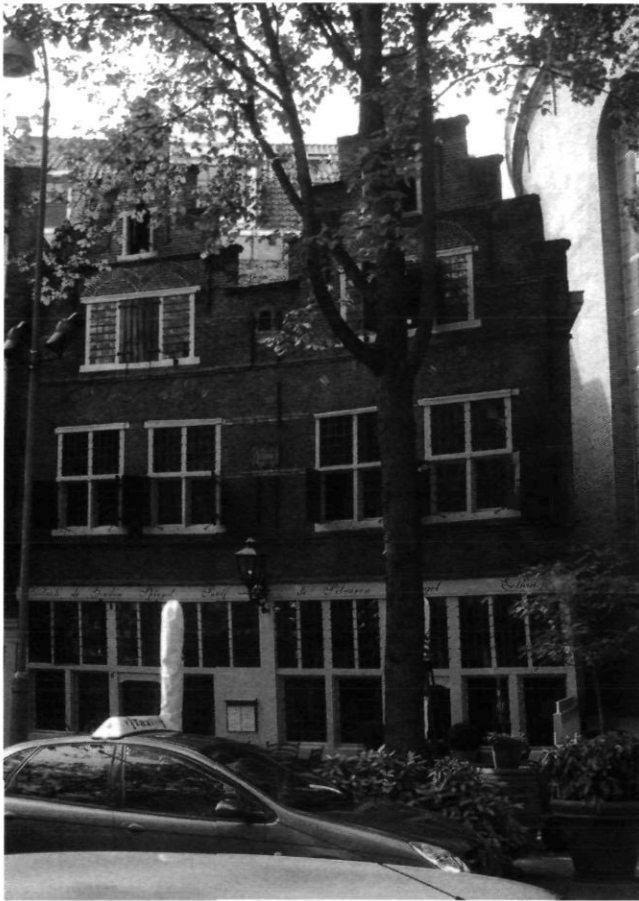
Afb. 8 Amsterdam, Kattégat 4-6, na de restauratie van A.A. Kok (M. Haaksman 2003)

voor Kok belangrijker dan historiserende toevoegingen en de mate waarin hersteld moest worden hing af van de toestand van een gebouw. Kok was van mening dat het beste was “zoo min mogelijk te sloopen en op te nemen (...), want hoe meer men sloopt hoe meer men nieuw moet maken en dan komt weer de mogelijkheid van oude materialen die zoo schaarsch zijn. Oude baksteen is in den regel nog wel bijpassend te maken, doch andere materialen, zooals echt oud lood, echt oud glas, dikke oude eiken balken, vloerplanken enz. – is nagenoeg niet verkrijgbaar zodat men dan noodgedwongen nieuw-oud moet maken in materialen die de valsheid verraden en voor latere kunsthistorische studie waardeloos zijn”. 32 Toch was het af en toe nodig om delen van een gebouw te slopen en te vervangen door nieuwe delen. Om het gebouw zijn schoonheid en historische uitstraling te laten houden, was herstel van oude materialen de beste oplossing, waarbij veelvuldig gebruik werd gemaakt van oude bouwfragmenten, afkomstig van gesloopte panden.