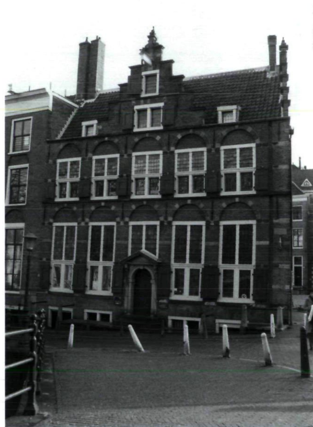
Afb. 1 Amsterdam, Oudezijds Voorburgwal 249, voorgevel na de restauratie van Jan de Meijer (M. Haaksman 2003)

waren aangebracht. Hij zag het silhouet teloor gaan "door het slopen van de bekronende, ambachtelijke geveleindingen" en noemde dat, "verarmende verminkingen". 3 De later veranderde delen en toevoegingen aan deze panden waren volgens De Meijer niet door ambachtslieden uitgevoerd en daarom 'verarmende verminkingen'. "Verarmend. Ja alle theorie moet stranden, indien zij niet uitgaat van het 'ambacht'. Gaat men er van uit, dan is er geen theorie, de praktijk, de ondervinding