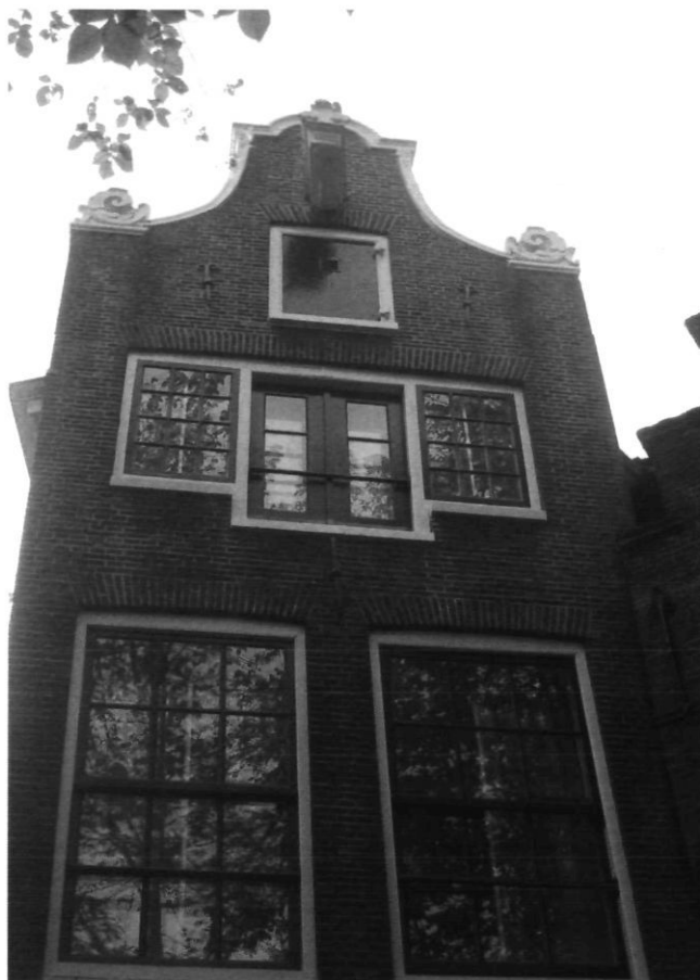
Afb. 12 Amsterdam, Kattégat 8, na de restauratie van A.A. Kok

In 1942 voerde Kok een zeer vergaande restauratie uit. De restauratie kon gemakkelijk doorgang vinden, daar de leden van de Commissie voor de Oude Stad de gevel niet belangrijk genoeg vonden om het in zijn bestaande toestand te bewaren. 41 Het pand Nieuwezijds Voorburgwal 66 uit 1666 veranderde daarom van een huis met rechte lijst in een huis met halsgevel (afb. 10 en 11). Verder kregen de vensters schuiframen met kleinere roedenverdeling dan voor de restauratie. Tijdens de restauratie werd de gevel vanaf de bovenkant van de vensters van de tweede verdieping afgebroken en opnieuw met oud materiaal opgebouwd in de vorm van een halsvormige geveltop. Deze geveltop was afkomstig van het gesloopte pand Prinsengracht 50. Op een foto van de Prinsengracht uit 1932 is het pand nog te zien met precies dezelfde halsgevel, klauwstukken en gebogen fronton als tegenwoordig bij Nieuwezijds Voorburgwal 66 te zien zijn. De natuurstenen schou-