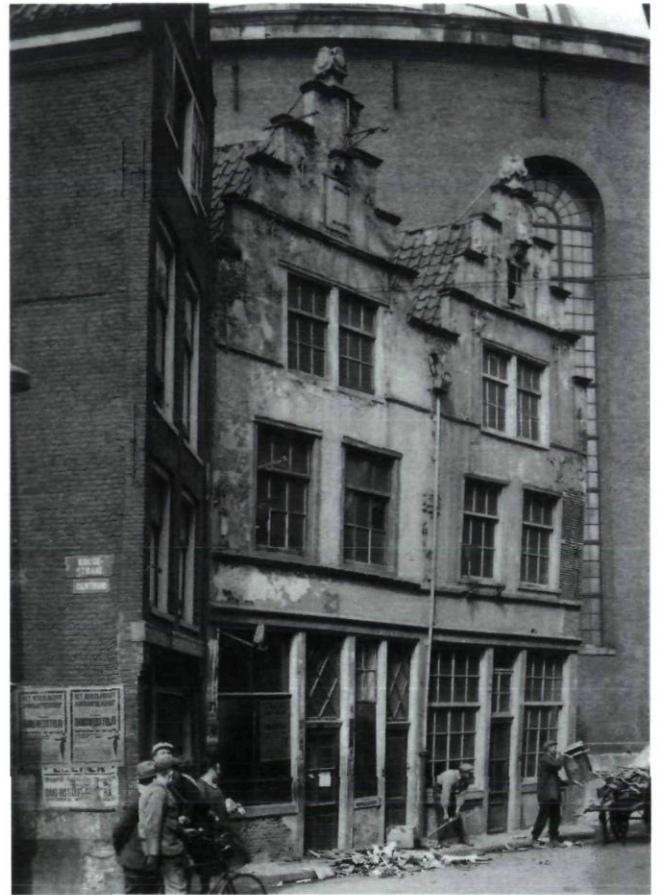
Afb. 7 Amsterdam, Kattegat 4-6, voor de restauratie van A.A. Kok, foto uit 1929 (Archief Rijksdienst voor de Monumentenzorg 1929)

waren dus een belangrijk uitgangspunt voor de restauraties van De Meijer. Hij idealiseerde de gebouwen uit deze tijd, de ambachtelijke bouwwijze en de reden voor het gebruik van het kruiskozijn. Deze opvattingen zorgden ervoor dat hij zich niet aan de gevestigde restauratietheorieën hield, maar volledig zijn eigen gang ging.