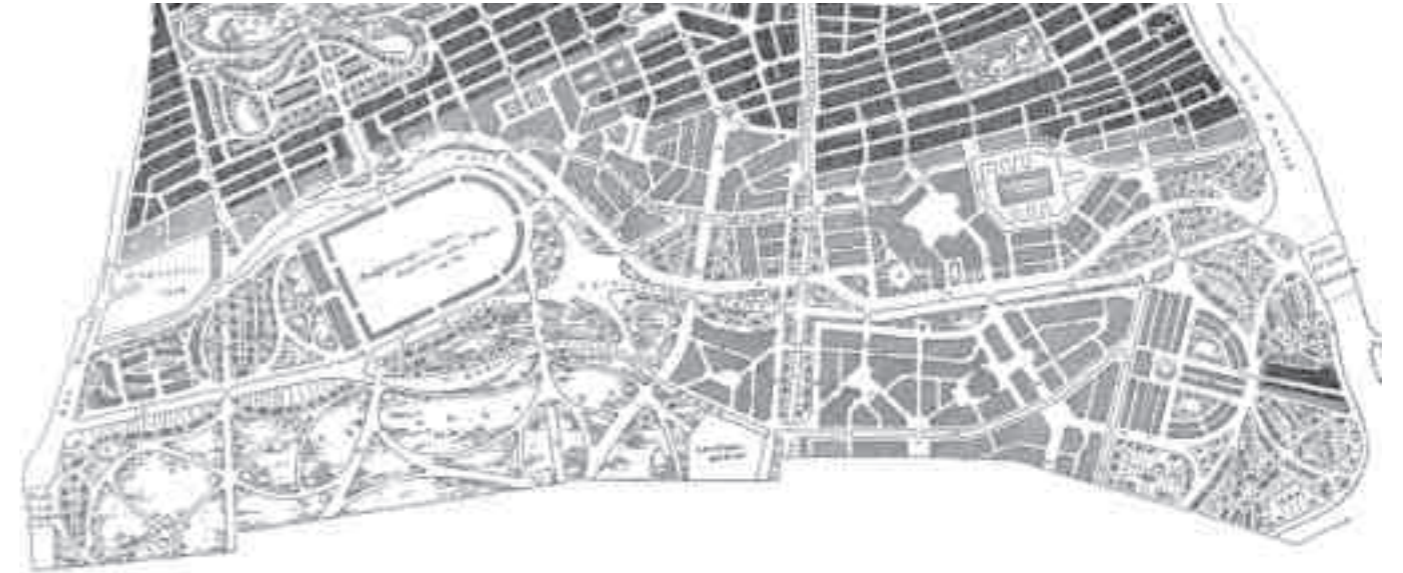
Afb. 1. H.P. Berlage, Plan Zuid, 1900, getekend 1918 door J. Stübben (TU Library)

Door Sitte en Stübben te combineren kon Berlage in zijn bekende lezing ‘Bouwkunst en Impressionisme’ uit 1893 concluderen dat voor een succesvol stedenbouwkundig plan samenhangend