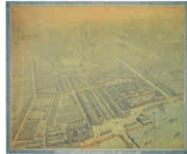
Afb. 6. H.P. Berlage, Amsterdam-Zuid gezien van boven de Zuiderbrug, 1915

vijf expliciet als 'plein' benoemt. 61 Waar we op basis van dit woord tegenwoordig vooral een autovrije ruimte met verblijfskwaliteit verwachten, tekende Berlage ze slechts bij kruispunten van hoofdwegen en een enkele keer bij een openbaar gebouw. In het renvooi worden ze ook niet gespecificeerd. Dit sluit aan bij Berlages lezingen uit 1914, waarin hij aangaf pleinen minder belangrijk te vinden dan straten en ze vooral te zien als 'knooppunten in het stratennet'. 62 Alhoewel de woordenboeken voor dit woord minder uitgesproken verschillen kennen dan bij 'gracht', blijft het mogelijk dat 'plein' in de afgelopen eeuw betekenis-specificatie heeft ondergaan. 63 Hierop duidt ook de opkomst van de verklarende samenstelling 'verkeersplein'. 64 Een andere verklaring kan gevonden worden in een verandering in de werkelijkheid – namelijk een toename van het autoverkeer, waardoor verkeersfunctie en verblijfskwaliteit steeds moeilijker te combineren vielen.