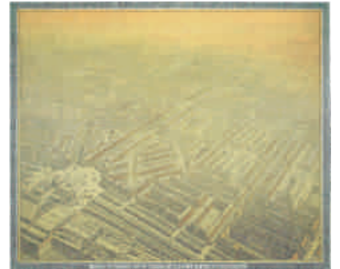
Afb. 7. H.P. Berlage, Amsterdam-Zuid gezien van boven het Zuiderstation, 1915

Op de oorspronkelijke plankaart zijn de drie woningbouwklassen met verschillende kleuren aangegeven. Om te beginnen is in lichtrood 20 hectare aan zogenoemde 'éengezinshuizen', zowel open als gesloten bebouwing' opgenomen. 65 Deze '1ste klassewoningen' bevinden zich in gesloten bouwblokken van vier lagen hoog plus kap in het noordwesten van het ontwerp en als vrijstaande woningen of twee-onder-een-kapwoningen langs het Noorder Amstelkanaal, de Boerenwetering en de Amstel (de open bebouwing, in zijn lezingen gebruikt hij hiervoor ook het woord 'villa'). 66 In wit is vervolgens 39 hectare opgenomen aan 'tweegezinshuizen' of '2de klassewoningen', dat wil zeggen beneden-bovenwoningen van vier lagen plus kap, gelegen langs