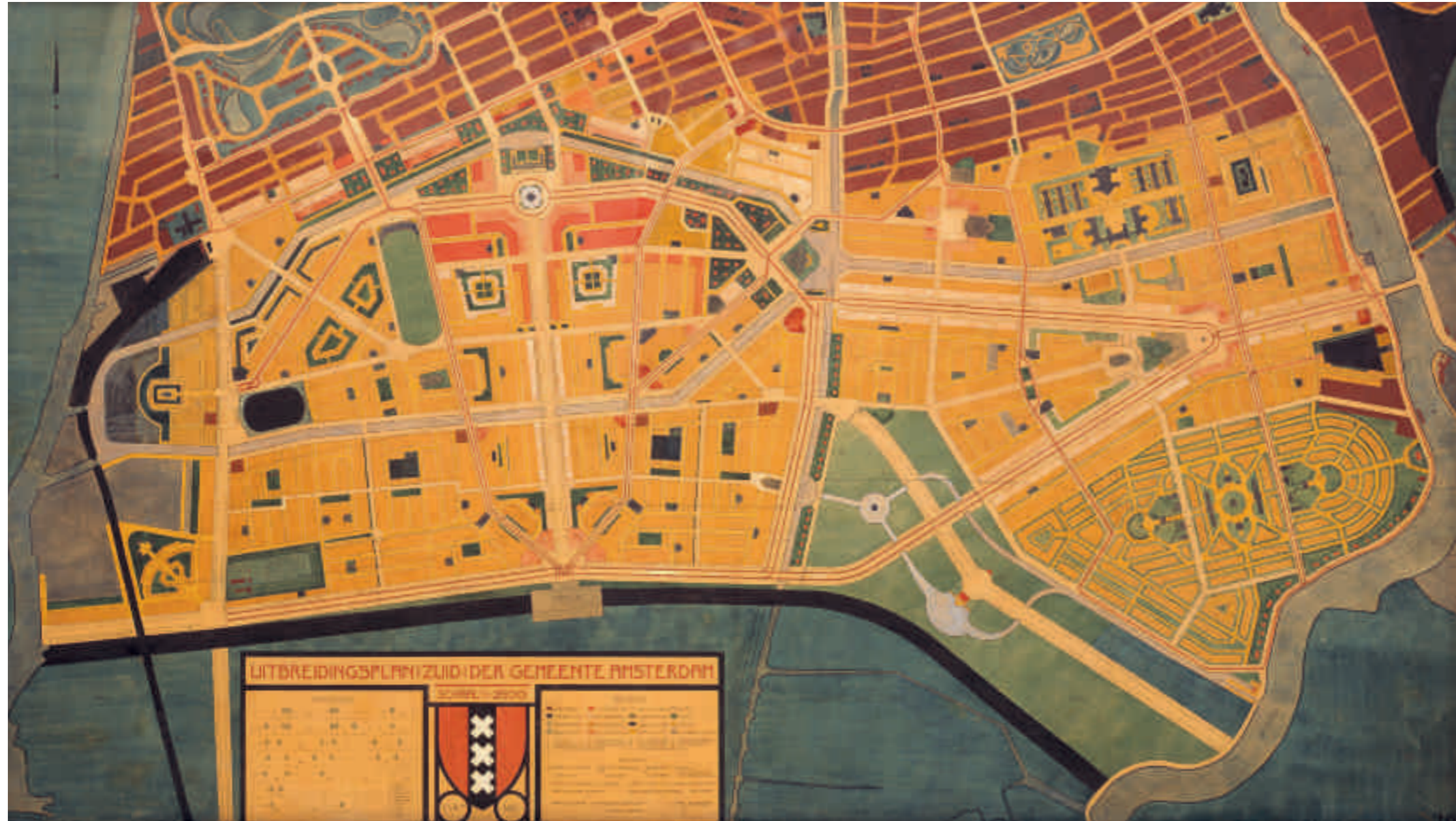
Afb. 3. H.P. Berlage, Plan Zuid , 1915, met correcties 1916 (Amsterdam Museum)

rol bij de beschrijving van de hoofdmomenten van het plan – hun functionaliteit (afwatering en verbinding over water) stond voorop.