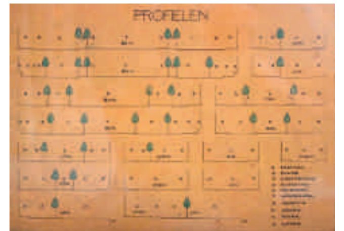
Afb. 8. H.P. Berlage, profielen, 1915 (Amsterdam Museum)

Bij de woorden die Berlages tijdgenoten gebruiken voor de ontworpen woningen zien we net als bij de openbare ruimten meerdere woorden voor dezelfde referenten. Omdat bij woningen de referenten duidelijker te onderscheiden zijn (waar straat en weg overlappende categorieën zijn, behoort een huis immers maar tot één klasse) is de situatie hier bovendien eenvoudiger. Voorbeelden zijn naast 'villa' al sporadisch 'twee onder een kap', 'hee-