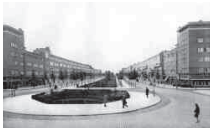
Afb. 10. Berlages 'breede verkeersweg' uitgevoerd met 'wandelpad' als Amstellaan in 1925 en als Vrijheidslaan met trambaan in 2010

De openbare gebouwen zijn door Berlage in de oorspronkelijke plankaart met verschillende kleuren aangegeven, de meeste in grijs of zwart (op de presentatiekaart zijn ze niet als zodanig te herkennen, maar wordt hun naam soms vermeld). Tien gebouwen komen slechts één keer voor en worden in de toelichting specifiek genoemd: het reeds bestaande 'stadion' in het westen, het nieuwe '(Zuider)station', een 'Academisch Ziekenhuis' in het noordoosten, een 'tramremise' aan de Amstel, een 'Academie van Beeldende Kunsten' halverwege het Noorder Amstelka-