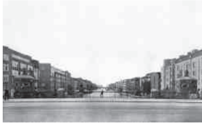
Afb. 9. Berlages 'gracht' uitgevoerd met groene oevers als Amstelkanaal in 1925 en 2010, gezien vanaf de Amstel

renhuis' en simpelweg 'huis' of 'woonhuis' voor 'ééngzinshuis', 'bovenhuis/-woning' en 'benedenhuis/-woning' voor 'tweegezinshuis', en 'arbeiderswoning' voor '3de klasse woning' of 'volksklassehuis'. 71