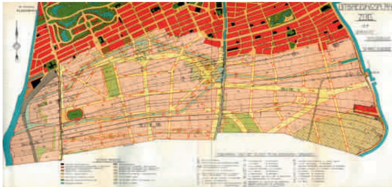
Afb. 5. B en W Amsterdam, 'Geraamteplan', 1917

Op de plankaart kunnen tot slot achttien pleinen en pleintjes worden onderscheiden, waarvan Berlage er in zijn toelichting