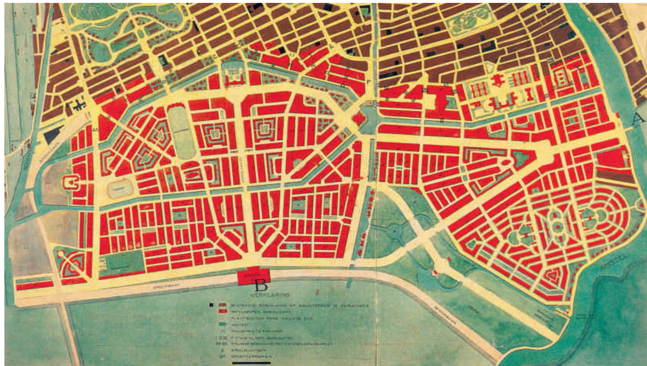
Afb. 2. Dienst der Publieke Werken, Plan Zuid, 1917

dat elk uitbreidingsplan na tien jaar herzien moest worden, leidden ertoe dat de Dienst der Publieke Werken Berlage op 6 oktober 1914 om een aanpassing van zijn ontwerp verzocht. 26