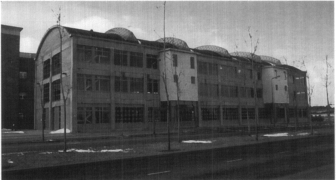
Afb. 1. Exterieur Wiebengahal (foto: René Hoppenbrouwers, 1997)

In 1990 werd de eerste reguliere schilderijenrestauratie-opleiding in Nederland gestart. Kort hiervoor had de SRAL een atelier geopend in Maastricht en deelde zij ruimtes en faciliteiten met de Academie voor Bouwkunst in de Capucijnenstraat. Voortaan zou voornamelijk daar de opleiding plaatsvinden. Na drie jaar werd begonnen met de studierichting Onderzoek van Historische Binnenruimten gevolgd door het studietraject Restauratie van Historische Binnenruimten ,