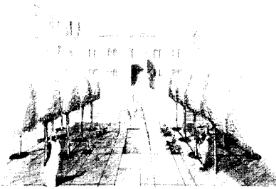
Afb. 3 Gevelaanzichten kasteel St. George d'Elmina, 1987. Opmeting A. K. Joustra en D. L. Six.

Elmina was tot en met de 19de eeuw een bloeiende stad. De laatste decennia is zij verstoken gebleven van enige zichtbare economische ontwikkeling. Hierdoor is de waardevolle stedelijke structuur voor een groot deel intact gebleven, maar tevens dreigt deze nu aan verwaarlozing ten onder te gaan. Net als met een bouwwerk moet ook een stad goede economische functies hebben om te kunnen bestaan. Met uitzondering van een handjevol gebouwen verkeren de bouwwerken in