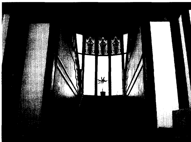
Afb. 4. Trap met gebrandschilderd glas.

bij de Amstel en de plaats waar de Weespertrekvaart in de rivier uitmondde – het ‘piano nobile’ droog te houden. De plattegrond was nagenoeg vierkant. Via een stoep met vijf treden betrad men de vestibule en vervolgens de centrale hal, vierkant, met afgeschuinde hoeken. Om deze hal waren de vertrekken gegroepeerd: een salon, een studeerkamer, een toilet, een naaikamer, een kinderkamer met vestiaire, een naar achteren uitgebouwde keuken, een bijkeuken met overdekte dienstingang, een eetkamer met buffetkast, een serre (waarboven een lantaarn) en een huiskamer met aangrenzend terras. Via een monumentale ‘keizerlijke trap’ (met één vlucht naar de overloop en twee vluchten naar de verdieping) bereikte men de boven gelegen vertrekken: zes slaapkamers, een logeerkamer, een badkamer, een toiletkamer en een WC en, aan de voorkant, het boudoir van mevrouw Maschmeijer, met een grandioos uitzicht over de Amstel vanuit de driehoekige erker. De kamers op de verdieping waren, zowel aan de voorkant als de achter- en zuidelijke zijkant, royaal voorzien van balkons.