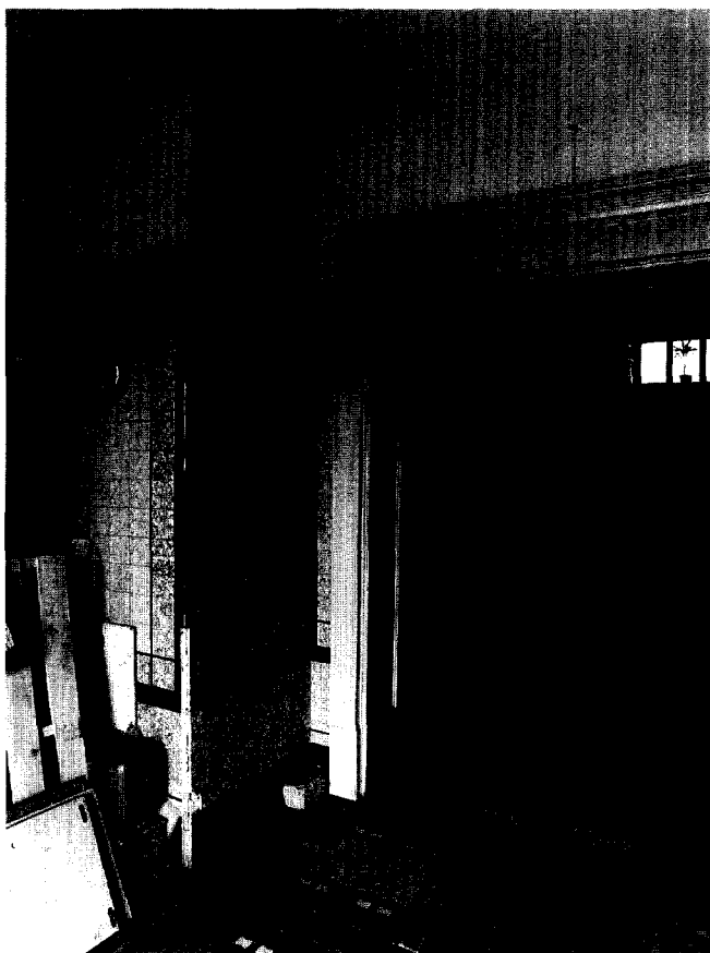
Afb. 3. Vestibule en centrale hal.