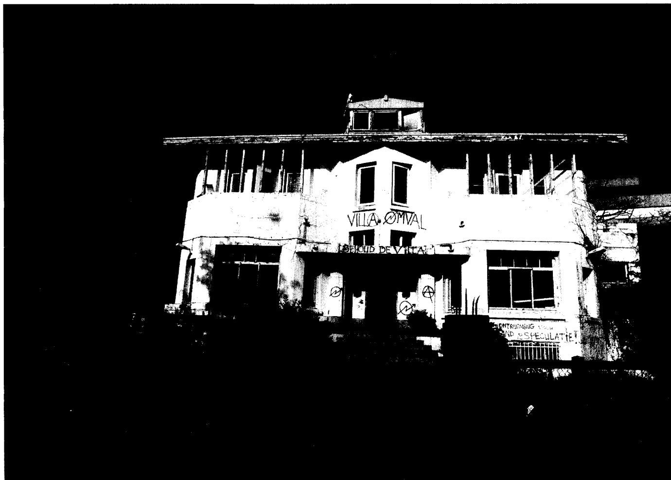
Afb. 1. Villa Omval, voorgevel met gestut dak, 1992.

perrekvaart werden gebouwd, gaven de Omval onmiskenbaar allure; ze zijn alle gesloopt.