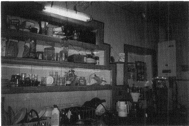
Afb. 6. Betegelde kasten in de keuken.

Minister binnen, die andermaal, conform het advies van de bewaarschriftencommissie Wet Arob van WVC, negatief was. De villa, met 'interessante betonconstructie', had 'ontegenzeggelijk een zekere betekenis', maar voldeed aan geen van de vier hierboven genoemde uitzonderingscriteria.