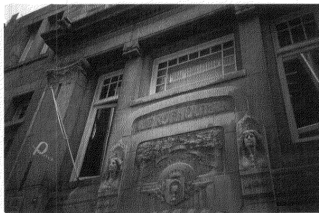
Afb. 7. Voormalige fabriek H. Drijfhout & Zoon, Nes 11-15, Amsterdam; Joseph Herman, 1912 (detail voorgevel).