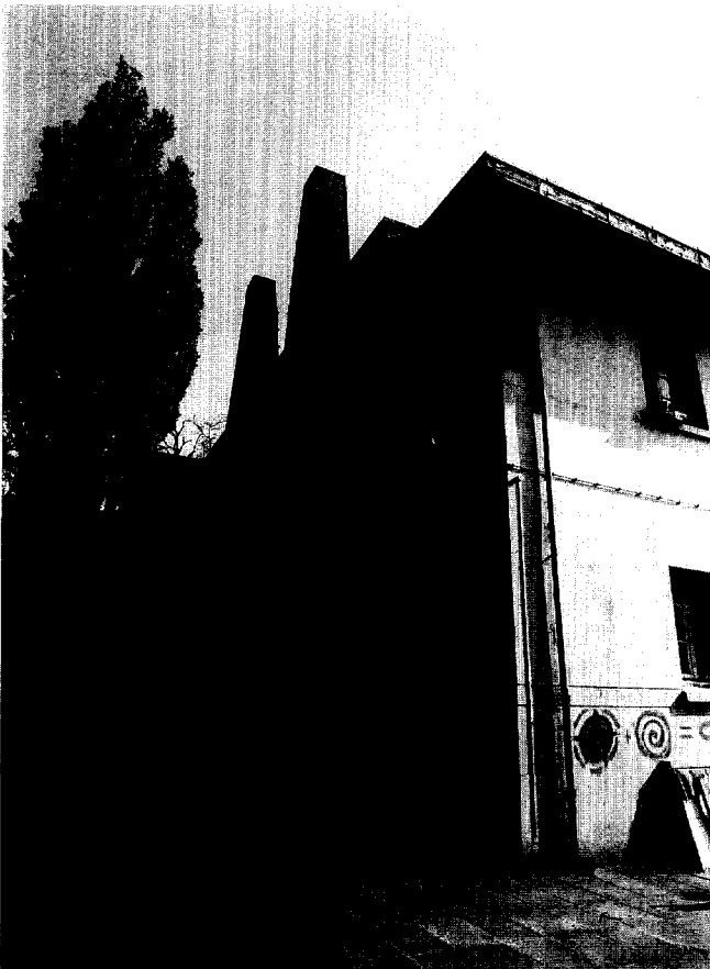
Afb. 2. Achtergevel met dienstingang en schoorstenen.