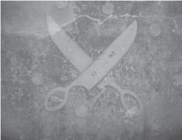
Afb. 2. Grote Kerk Breda detail van schaar met cirkeltjes, wellicht loodzegels, tweede kwart zestiende eeuw