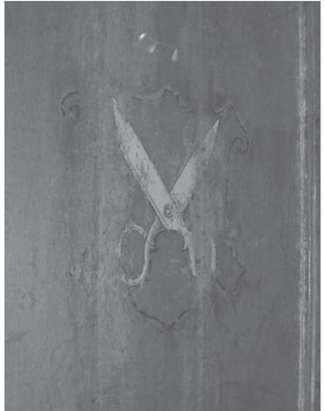
Afb. 4. Achterzijde van Anonim, 'De lakenmarkt te 's-Hertogenbosch', ca. 1530, Den Bosch, Noordbrabants Museum (inv. 1596).

Tijdens de conditie-opname in 2006 bleek de muurschildering met lakenscharen zwaar te zijn beschadigd. De originele verf kwam op sommige plaatsen los van de ondergrond en is hier en daar verpoederd; hetgeen zeer waarschijnlijk is veroorzaakt door vocht en schimmel. Het originele verfooppervlak gaat schuil onder een laag oppervlaktevuil. Daarbij is de schildering in de linker onderhoek tevens beschadigd door het branden van kaarsen (roetsporen). Evenals bij de Joriskapel zijn in de Lakenscharenkapel tijdens eerdere restauraties grote kalk- en cementvullingen aangebracht, die de originele schildering in sommige partijen gedeeltelijk overlappen. 5 De originele verf die onder deze vullingen schuil gaat, geeft een