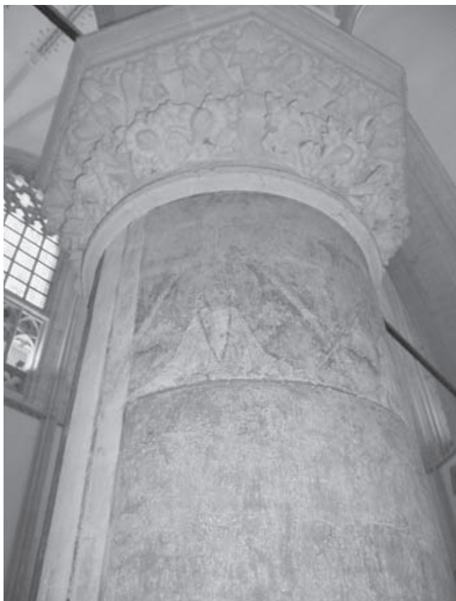
Afb. 9. Detail met de engelen op de tweede koorpijler, ca. 1510-1520

Hoewel een reconstructie op basis van de linker engel mogelijk is, lijkt het beter om deze engel te laten voor wat het is om overinterpretatie te voorkomen. Daar waar de ontbrekende partijen (wit door de onderliggende kalk) in kleur contrasteren met de aanwezige schildering, zullen deze te worden ontstoord door deze aan te vullen met een neutrale toon in een