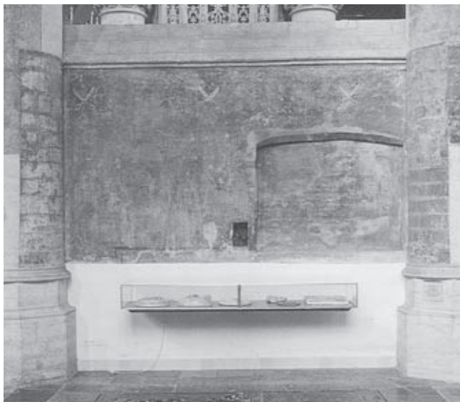
Afb. 1. Grote Kerk Breda, zuidelijke koorwand in de tweede travee van de kooromgang met de lakenscharen, tweede kwart zestiende eeuw

Van oudsher werden in zowel de Zuidelijke- als de Noordelijke Nederlanden met name langs de kust schapen gehouden. 3 Van de wol weefden de plattelandsbevolking kleren en dekens. Vanwege het gecompliceerde productieproces ontwikkelde de lakennijverheid zich al vrij snel tot een activiteit van gespecialiseerde ambachtslieden. Hoewel de lakenindu-