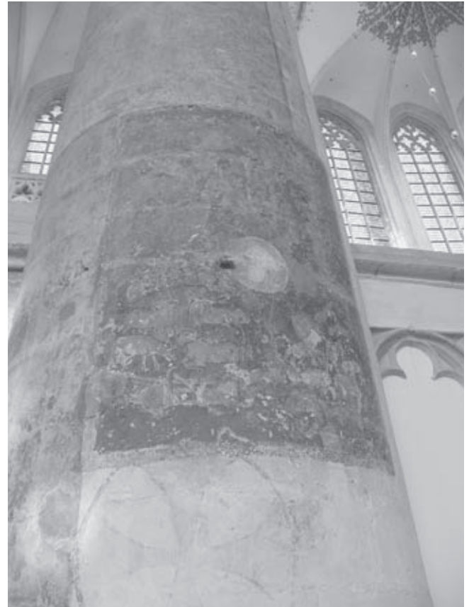
Afb. 8. 'Het scheiden van de schapen en bokken, ca. 1540-1550 in secco-techniek

Zeer waarschijnlijk functioneerde de rood geschilderde eredoek als achtergrond van een sculptuur, zoals dit ook het geval was in de Pieterskerk in Leiden. 9 In de schildering zijn enkele met lood gevulde dookgaten gevonden, die mogelijk oorspronkelijk de consoles vormde van het beeld. 10 Ook in de miniatuur- en schilderkunst zijn verscheidene voorbeelden bekend van heiligen, Maria en Kind, de Heilige Familie en de