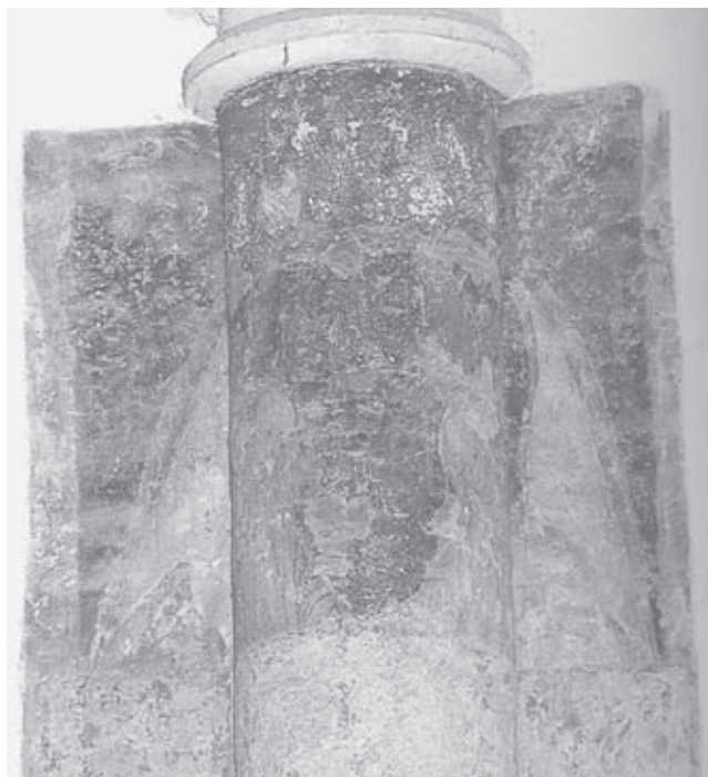
Afb. 10. Tapijtschildering met engelen, tweede helft zestiende eeuw, en schaduw-schildering, eind zestiende-eeuw

Ook op de eerste vrijstaande bundelpijler in de zuidelijke kooromgang is een rode eredoek afgebeeld die wordt opgehouden door twee engelen (afb. 10). 13 Deze schildering is ontdekt en vrijgelegd in 1932 en opnieuw gerestaureerd door Dorota Burgin in 2007. Hoewel het principe van twee engelen die een rode eredoek ophouden, overeenkomt met de hierboven behandelde voorstelling (op de tweede koorpijler aan de zuidzijde aan de koorgangzijde ofwel de pilaar rechts van de Lakenscharenkapel) en mogelijk eveneens functioneerde als achtergrond van een beeldhouwde figuur, dateren deze engelen uit een iets latere periode (tweede helft zestiende eeuw). 14 In tegenstelling tot de engelen die frontaal zijn weergegeven op de tweede koorpijler aan de zuidzijde, zijn de engelen hier met de gezichten driekwart naar elkaar toe gedraaid (afb. 10). De linker engel heeft de ogen geopend en