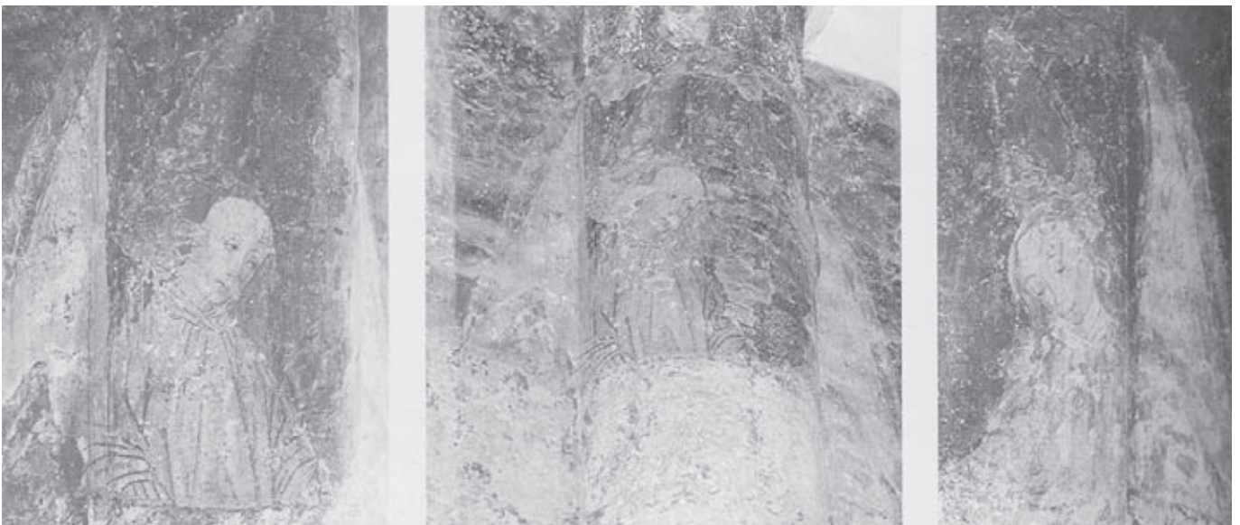
Afb. 11. Details van de tapijtschildering met engelen, tweede helft zestiende eeuw

Op de tweede koorpijler aan de zuidzijde (vanuit het westen geteld) is aan de koorgangzijde onder de rode erdoek, die wordt opgehouden door twee engelen, een voorstelling van een met een hek omsloten weide met twee groepen dieren geschilderd (op de pilaar rechts van de Lakenscharenkapel (afb. 8)). 16 De dieren zijn aan de onderzijde van het groene vlak gesitueerd, dat is voorzien van een rood bloemenpatroon, dat mogelijk tot stand kwam door middel van een stempel. Boven de dieren, net onder het midden van het beeldvlak, is een gele bol zichtbaar. De scène verbeeldt ‘Het scheiden van de schapen en bokken’ en is verbonden met ‘Het Laatste Oor-