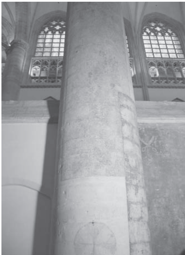
Afb. 5. Westpilaar naast noordwand van de lakenscharenkapel

vullingen), door het genoemde verschil in dikte, het ontbreken van kleur (de grijswitte of crèmewitte) of door verkleuring, zullen worden ontstoord. Evenals bij de Joriskapel (met name de westwand) is het voorstel om hier eveneens te kiezen voor een groentint, lichter dan het origineel, zodat het onderscheid tussen de originele en geretoucheerde partijen voor de geïnteresseerde bezoeker waarneembaar is. Kleine holtes en barsten zullen worden geïnjecteerd met een spuitmortel op basis van kalk en aanwezige lacunes worden opgevuld met een fijne kalkmortel. Zeer kleine beschadigingen, zoals kleine eilandjes verfverlies of krassen, worden integraal geretoucheerd. Van overinterpretatie bij het retoucheren kan hier nauwelijks sprake zijn, aangezien de noordwand hoofdzakelijk groen was geschilderd. Alleen aan de bovenzijde zijn drie gele scharen geschilderd die in vergelijking met het onderste gedeelte van de wand vrij goed bewaard zijn gebleven. Naar de wit geschilderde rondjes, de veronderstelde loodzegeltjes, moet nog nauwkeurig worden gekeken. Of deze –in een meer of minder regelmatig patroon- tot aan de onderrand van de kapel aanwezig waren, is onduidelijk. Er zullen geen rondjes worden aangebracht, als hier geen sporen van zijn teruggevonden. Door de grote vullingen te retoucheren met een neutrale lichtgroene tint zal een rustig en harmonieus beeld wor-