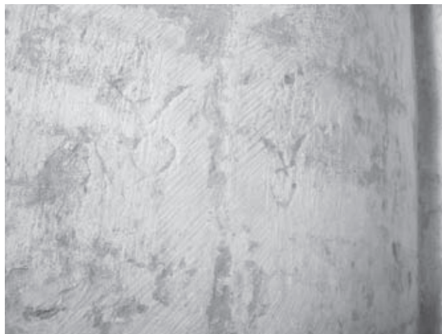
Afb. 6. Ingekraste laagmerken op de linker kolom (westzijde van de lakenscharenkapel)

den gecreëerd. De huidige afkadering van de kapel aan de onderzijde van de noordwand zal behouden blijven.