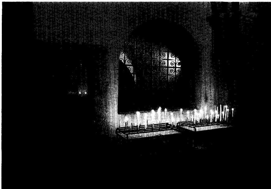
1. Maastricht, St. Servaasbasiliek. Toegang tot het graf van Sint Servaas en de cenotaaf van hertog Karel van Neder-Lotharingen.