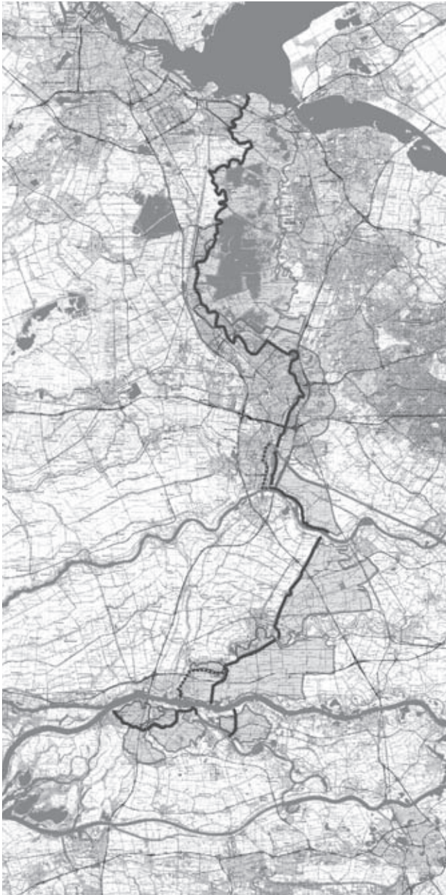
Ruimtelijke regimes van Panorama Krayenhoff (Eric Luiten)

wins werden gerealiseerd, onderging het Uitvoeringsprogramma een maatschappelijke-kosten-en-batenanalyse om vast te stellen of het project in zijn totaliteit in aanmerking kon komen voor financiering uit de Nota Ruimte. Na een gunstige uitkomst werd door Rijk en betrokken provincies gezamenlijk circa 70 miljoen euro gereserveerd. Geld dat de afgelopen en de komende jaren beschikbaar was en is voor herstelwerk, routing, nieuwe voorzieningen, opstarten van exploitatie en projectbeheer. Het succes van het project dat nu een kleine tien jaar 'draait', wordt bepaald door een aantal eigenschappen. Het gaat om een concreet gebied