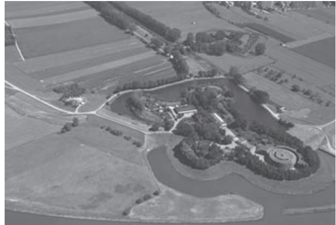
Fort Honswijk langs de Lek

Een heel andere interpretatie van het landschapsbeleid, in de geest van Dick Hudig, namelijk die van integrale kwaliteitszorg bij grote inrichtingsprojecten met een nationaal karakter of bereik, is geleidelijk doorgedrongen in het cultuurbeleid en meer in het bijzonder het architectuurbeleid. Vooral de derde Architectuurnota Ontwerpen aan Nederland uit 2001 is een buitengewoon pragmatisch en specifiek getoonzet beleidsdocument waarin aanvankelijk negen en later tien concrete ruimtelijke opgaven worden gepresenteerd. 11 Aan deze projecten zouden hoge kwaliteitseisen worden gesteld, zo beloofde de nota. Zeker vijf van de tien opgaven zijn van een expliciet landschappelijke schaal en betekenis: de herinrichting van de zandgebieden in Oost- en Zuid-Nederland, het ontwerp van de Zuiderzeelijn (waarvan de uitvoering later werd afgeblazen), de ontwikkeling van de Deltametropool (de Randstad en het Groene Hart), de ruimtelijke inpassing en verankering van rijkswegen (volgens het concept van het routeontwerp) en de revitalisering van de Nieuwe Hollandse Waterlinie. Met die laatst genoemde opgave werd een relatie gelegd met de twee jaar eerder verschenen nota