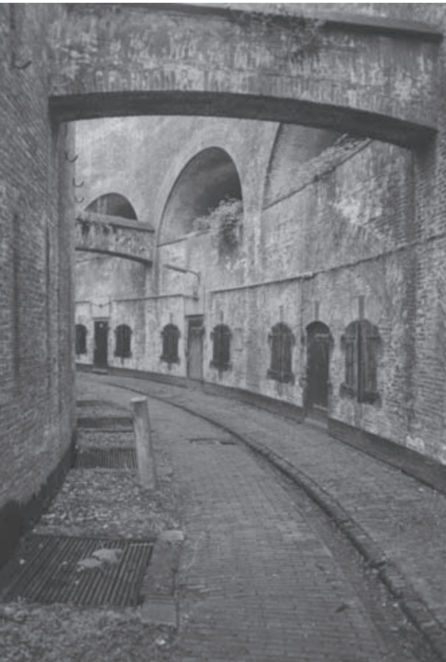
Interieur van het torenfort van Everdingen (Eric Luiten)

elkaar. Ook op het niveau van monumentenzorg worden nieuwe inzichten ontwikkeld. De Monumentenwet maakt het mogelijk een beschermde status toe te kennen aan historische gebouwen en stads- en dorpsgezichten. Sinds 2008 loopt voor de Nieuwe