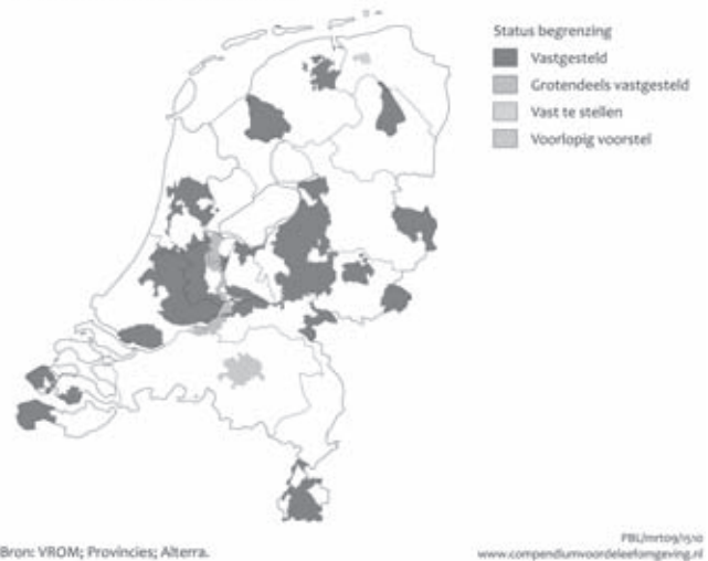
Begrenzing Nationale Landschappen

De begrensde Nationale Landschappen voordat het Rijk besloot het instrument af te schaffen (Planbureau voor de Leefomgeving / Compendium voor de Leefomgeving)