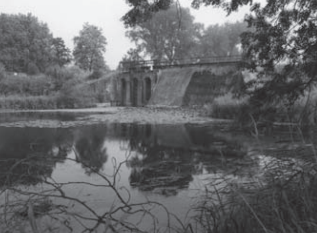
Voormalige inundatiesluis bij fort Everdingen (Eric Luiten)

elkaar. Ook op het niveau van monumentenzorg worden nieuwe inzichten ontwikkeld. De Monumentenwet maakt het mogelijk een beschermde status toe te kennen aan historische gebouwen en stads- en dorpsgezichten. Sinds 2008 loopt voor de Nieuwe