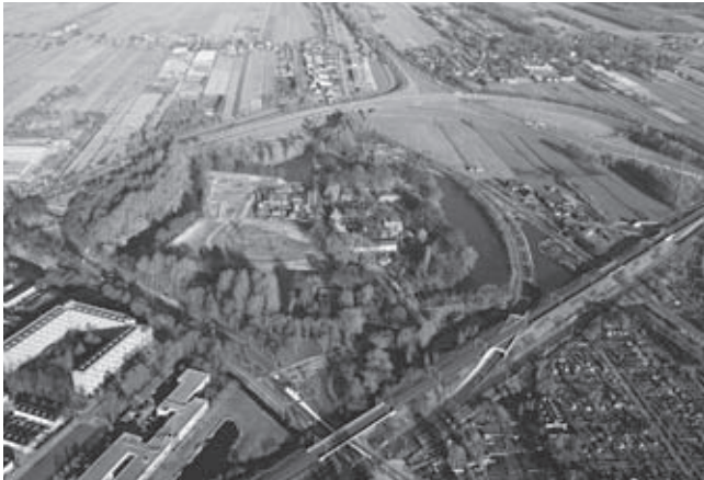
Fort Blauwkapel in de noordrand van Utrecht

van regering in 2010 lijkt het landschapsbeleid zoals verankerd in de ruimtelijke ordening echter definitief te zijn verdampt. De huidige staatssecretaris van Landbouw is van mening dat een vitale, grondgebonden landbouw de beste garantie biedt voor een hoogwaardig landschap en dat het natuurbeleid die landbouw niet te veel in de weg moet zitten. Alleen de internationale verantwoordelijkheden op dit vlak krijgen nog aandacht van de regering, de rest van het beleid voor natuur, recreatie en landschap zijn beter af in de handen van de provincies, zo luidt het betoog. 9 De recent (2011) door het kabinet uitgebrachte ontwerp-Structuurvisie Infrastructuur en Ruimte (de zevende Nota over de Ruimtelijke Ordening) is geheel in lijn met deze nieuwe koers. De regering heeft het beleid en de instrumenten voor de Nationale Landschappen en de Rijksbufferzones afgeschaft, hetgeen historisch-geograaf Hans Renes in zijn recent uitgesproken oratie tot de conclusie brengt dat het nationaal landschapsbeleid als mislukt kan worden beschouwd. 10