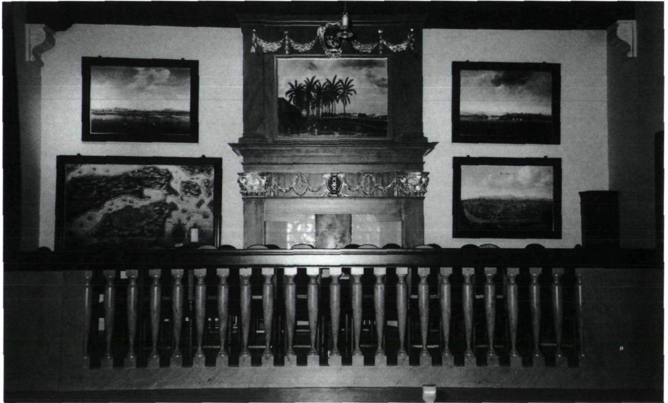
Afb. 2. De gereconstrueerde schouw met een copie van het oorspronkelijke schilderstuk, het stadswapen in vergulde guirlandes en de gefantaseerde gemarmerde balustrade

De vragen worden gesteld in het licht van de actuele discussie over de ethische aspecten van het terugbrengen in de oorspronkelijke toestand van historische gebouwen en binnenruimten. 4 Een vraag die raakt aan de kern van de restauratieproblematiek en in groter verband de monumentenzorg als geheel.