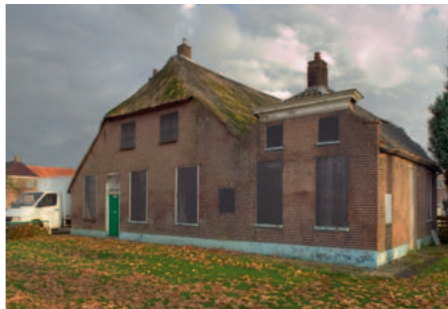
Afb. 6. Gemeenteweg 166-168 in 2005. De eigenaren wilden nieuwbouw plegen en weigerden enig onderhoud aan de monumentale boerderij te doen. Ondanks langdurige inzet van de Rijksdienst en de gemeente kon het gebouw niet worden gered en werd uiteindelijk van de rijksmonumentenlijst afgevoerd

Victor de Stuers sprak in 1910 de verwachting uit dat de beperking van het eigendomsrecht door gewinning en door de goede resultaten uiteindelijk geaccepteerd zou worden als een vanzelfsprekendheid. De belangen van de monumentenzorg zijn niettemin na vijftig jaar ervaring met de Monumentenwet nog steeds niet werkelijk geaccepteerd door wetgever of burger. In het nieuwe monumentenstelsel staat mede daarom de eigenaar centraal. Hij krijgt, onder het mom van verlichting van regelgeving, de mogelijkheid om zelf te bepalen welke onderdelen tot het monument behoren en welke niet. Voortaan is er geen monumentenvergunning meer nodig, voor zo ver de monumentale waarden niet worden aangetast. Deze verankering van een eigenlijk reeds lang bestaande praktijk lijkt sympathiek. Het legt wel de verantwoordelijkheid voor de afweging of iets monumentaal is, geheel bij de eigenaar zelf. De staatssecretaris heeft er ondanks aandringen van onder andere de Federatie Grote Monumentengemeenten en de KNOB niet voor gekozen om een simpele meldingsplicht voor wijzigingen 'die het monument niet raken' in te stel-