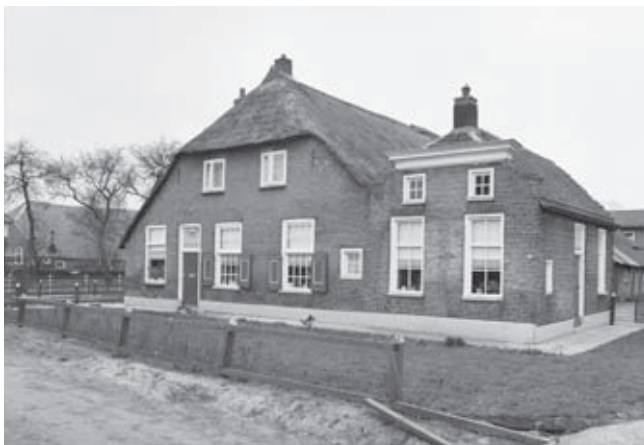
Afb. 5. Gemeenteweg 166-168 te Staphorst in 1980, een fraaie Staphorster boerderij met 'bezoekhuisje' dat als rijksmonument bescherming genoot

particuliere eigenaren wordt door politieke ideologie bepaald. De Nederlandse wetgever vond uiteindelijk een gebod tot onderhoud een te vergaande inbreuk. Het kabinet De Quay had een duidelijke visie op de reikwijdte van de overheidstaak. De burger was daarin zelf verantwoordelijk voor onderhoud en de (in 1947 opgerichte) Rijksdienst voor de Monumentenzorg had op dit gebied slechts een adviserende en stimulerende functie. Eisen over onderhoud worden sindsdien eigenlijk alleen gesteld als de betrokken eigenaar daadwerkelijk een restauratiesubsidie heeft ontvangen. De Nederlandse 'volkseigenaardigheden' in Nederland, vooral op het gebied van de 'onschendbare' eigendom, lieten een dergelijke inbreuk in andere gevallen niet toe. Tot op de dag van vandaag zien monumentenzorgers met lede ogen aan hoe eigenaren hun bezit moedwillig laten vervallen, vaak overigens uit onterechte verontwaardiging over een vermeende inbreuk (afb. 5 en 6). Het compromis van het vervallen van de onderhoudsplicht was wel nodig om de Monumentenwet na vijftig jaar eindelijk vastgesteld te krijgen en de monumentenzorg van een wettelijk kader te voorzien.