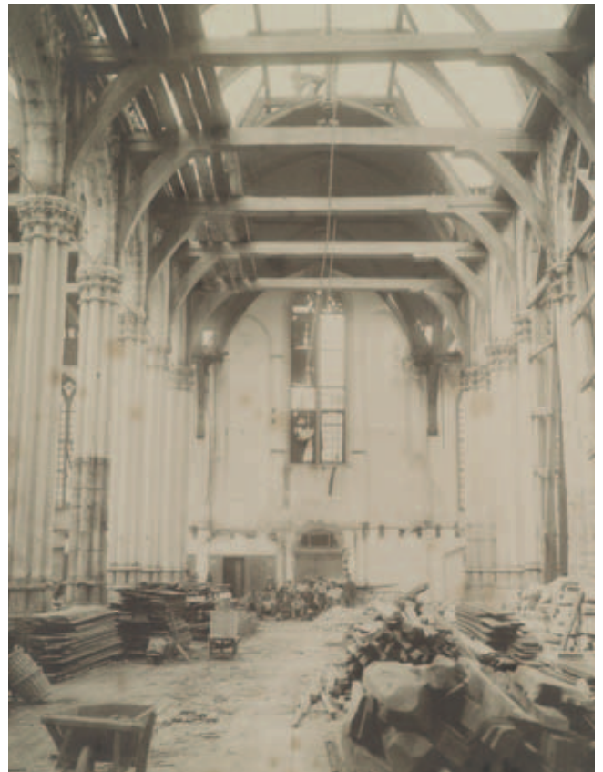
Afb. 3. De Nieuwezijds kapel te Amsterdam tijdens de sloop in 1908

De commissie van de NOB moest de bij monumentenzorg betrokken belangen in een juiste balans brengen met die van (particuliere) eigenaars. Zij zagen uit ervaring de noodzaak in om het gebruiksrecht van de eigenaar bij bijzondere monumenten te beperken. Zo nam de Hervormde kerkenraad in 1908 het definitieve besluit om de Nieuwezijdskapel in Amsterdam te slopen, ondanks herhaalde protesten van belangenorganisaties en aanbiedingen om bij te dragen in de kosten voor restauratie (afb. 3). Dergelijke onredelijke handelingen van individuele eigenaren konden alleen door een wettelijke regeling aan banden worden gelegd. Om de wetgever te overtuigen moet deze rechtsgrond voor de inbreuk duidelijk zijn en de gemaakte inbreuk proportioneel zijn, zowel aan het beoogde doel als aan het belang van de eigenaar. Door niet met een volledig afgekaderd wetsvoorstel te komen liet zij ruimte aan de wetgever om dit naar bevinden uit