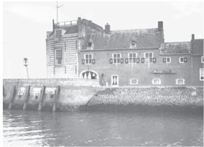
Afb. 2. De Campveersche toren in Veere, voor de restauratie

Al in de eerste jaargang van het Bulletin (1900/1901) verscheen een uitgebreid artikel over de Nederlandse monumentenbescherming door secretaris J.C. Overvoorde (1865-1930), archivaris van Dordrecht en later Leiden. 8 Hij constateerde dat Nederland beschamend achterliep ten opzichte van andere 'beschaafde' Europese landen, zeker voor wat betreft wetgeving. De Nederlandse regering beperkte zich in de monumentenzorg tot het ter beschikking stellen van (beperkte) budgetten voor de restauratie van bijzondere gebouwen en bouwwerken. Over het algemeen ging het om overheidsbezit en in uitzonderlijke gevallen om particuliere eigendommen, met name kastelen en kerkgebouwen. Hoewel deze handelwijze voor individuele gebouwen goed kon uitpakken, was er naar zijn mening ook sprake van willekeur. Kamerleden en de minister konden op basis van eigen smaak subsidie toekennen of onthouden of zelfs de restauratiesubsidies geheel uit de begroting schrappen. 9 Op de politiek hoefde niet te zeer vertrouwd te worden. In Veere besloot de gemeenteraad in deze periode tot verkoop van de Campveersche toren, met mogelijke sloop tot gevolg. De transactie kon alleen worden voorkomen door vernietiging van het besluit door de Staten van Zeeland, die zeggenschap hadden over besluiten van lagere overheden met directe gevolgen voor de financiën en kapitaal (afb. 2).