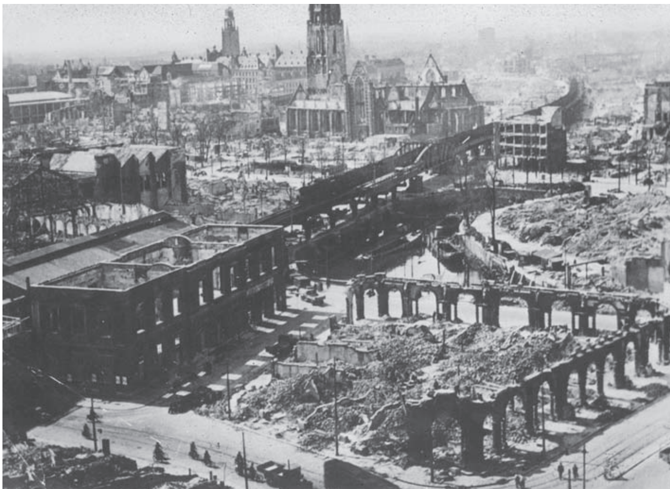
Afb. 4. Het centrum van Rotterdam na het Duitse bombardement aan het begin van de Tweede Wereldoorlog

In mei 1940 bracht de vijandelijke Duitse inval grote oorlogsschade toe, die ook vele monumenten trof (afb. 4). Bij gebrek aan een monumentenwet, vaardigde de opperbevelhebber van Land- en Zeemacht, generaal H.G. Winkelman (1876-1952), twee besluiten uit met betrekking tot de wederopbouw en de monumentenzorg. 35 Hierin werd kortweg bepaald dat het verboden was kerken en gebouwen die op de Voorlopige Lijst als