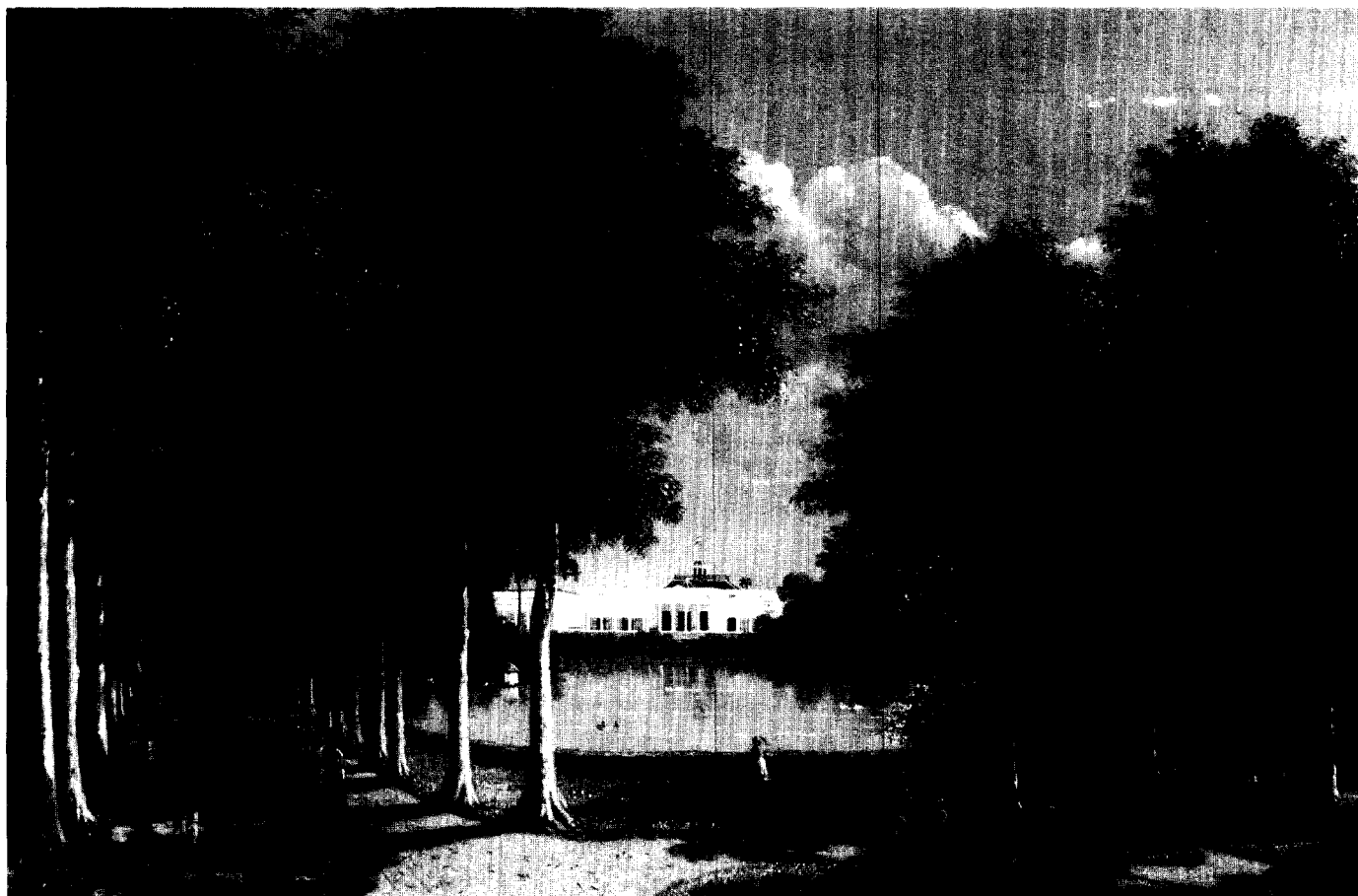
Afb. 3. Gezicht op de Kenarilaan / Raden Saleh, 1871. Coll. KTOMM Bronbeek.