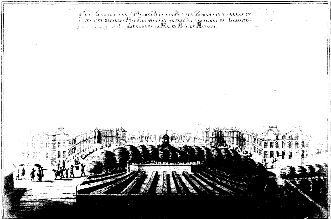
Afb. 1. Het Gezicht van 't Heere Huys van Buyten Zorgh.../ Johannes Rach, 1772. Tekening. Coll. Kon. Inst. v. Taal-, Land- en Volkenkunde.

verwantschap vertoonde. Op zoek naar een 18de-eeuws(e) ontwerp of plattegrond van Buitenzorg, vond ik vele 19de-eeuwse aanzichten 2 – van overigens steeds weer andere (verbouwde) huizen Buitenzorg – en een vrij onbekende tekening van Huis Buitenzorg van Johannes Rach, gedateerd 1772, precies hetzelfde jaartal als de bekende plattegrond van Beeckestijn van J. G. Michael. 3 Deze laatste tekening wil ik vooral in dit artikel onder de aandacht brengen. De 19de-eeuwse situatie is er ter completering voor de lezer in het kort aan toegevoegd.