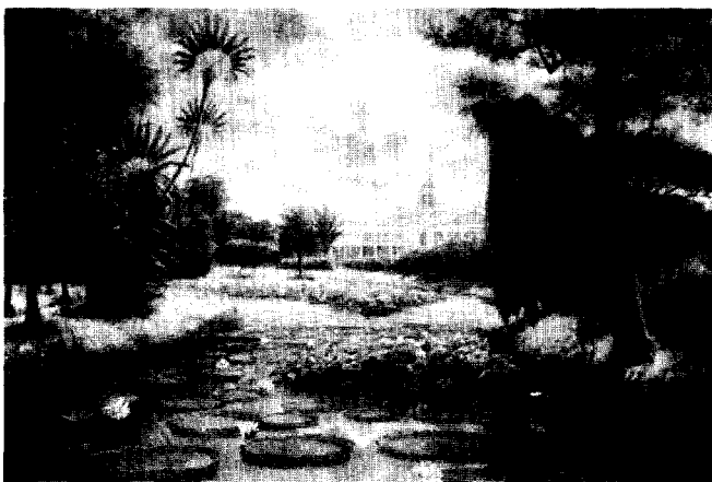
Afb. 4. De plantentuin te Buitenzorg, West Java / Max Fleischer, 1899. Periode Baut. Olieverf op doek. Coll. Tropenmuseum Amsterdam.

elkaars verlengde liggen en aan elkaar gekoppeld zijn. Het middendeel is weer voorzien van een centraal geplaatst toren-element op het dak.