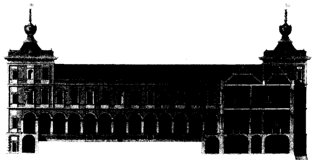
CHATEAU DE RENAIX.

status van Jan van Nassau-Siegen, op gelijke voet met zijn schoonfamilie en andere hoge edelen aan het Brusselse hof. Bovendien kon het paleis van Ronse een vergelijking met de paleizen van zijn eigen familie in de opstandige Republiek, zoals Huis Honselaarsdijk van Prins Frederik Hendrik, met glans doorstaan.