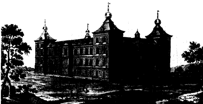
CHATEAU DE RENAIX.

De redactie van het Bulletin KNOB heeft nu een aantal Belgische collegae uitgenodigd om voor dit themanummer