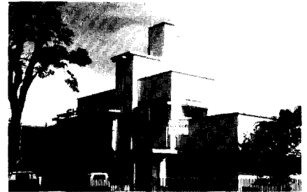
Kantoorgebouw Sharp, ca. 1930. Ontwerp beïnvloed door Dudok.

Ondermeer als gevolg van de verbeterde infrastructuur aan spoor- en auto-wegen en de overplaatsing van overheidsinstellingen van Batavia naar Bandung,