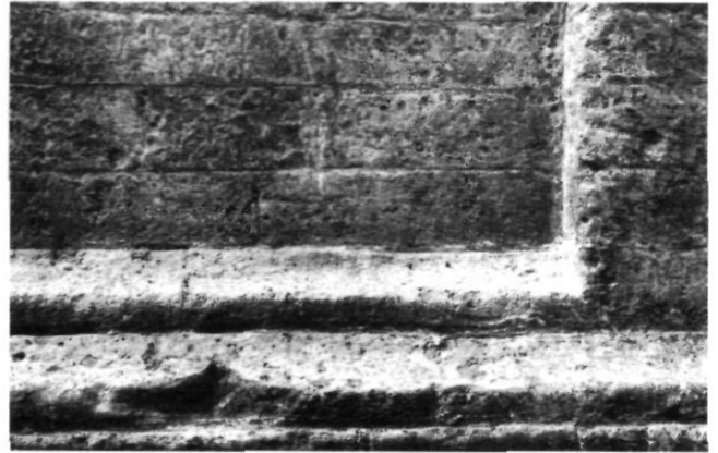
Afb. 4. Utrecht - Vredenburg: restant Romaanse kerk van het eerste Catharijneklooster. Foto auteur, 1976.

Het ideaal is dus niet één centrale site voor cultuur, maar een