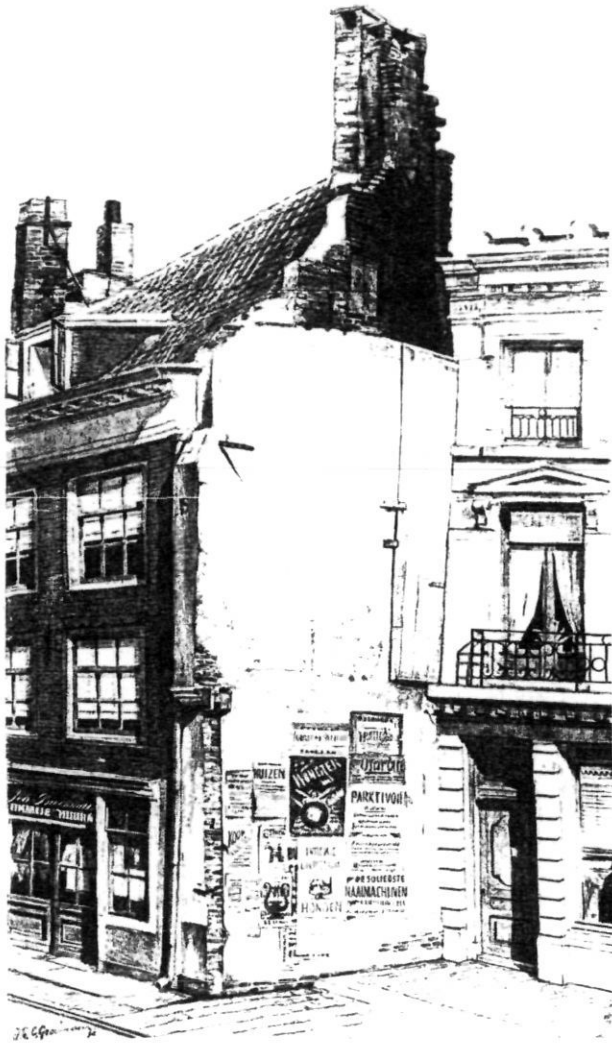
Afb. 1. Utrecht - Lange Viestraat 15 (gesloopt 1985) met links pand Wijk C, nr 191. Aquarel door J.P.C. Grollman, ca 1885.

Utrecht gered, zij het niet in situ. In het licht der ontwikkelingen rijst de vraag hoe duurzaam deze redding was.