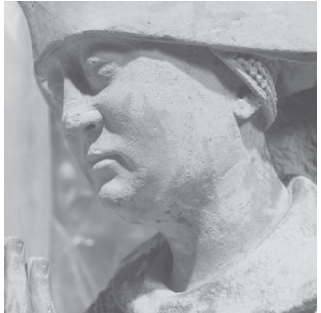
Afb. 9. Grafmonument voor Engelbrecht I en Johanna van Polanen en hun zoon Jan IV van Nassau en Maria van Loon, gelaat Maria van Loon na behandeling met complexon-pasta