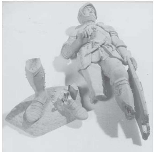
Afb. 5. Grafmonument voor Engelbrecht I en Johanna van Polanen en hun zoon Jan IV van Nassau en Maria van Loon, verwijderen van doken

demontage werd bepaald niet zachtzinnig te werk gegaan met als gevolg dat er veel materiaalverlies optrad; een foto van een voegvlak van een blok uit het graf met grove zaagsporen spreekt in dit verband boekdelen (afb. 4). Om een doek te verwijderen uit een van de beelden werden de onderbenen