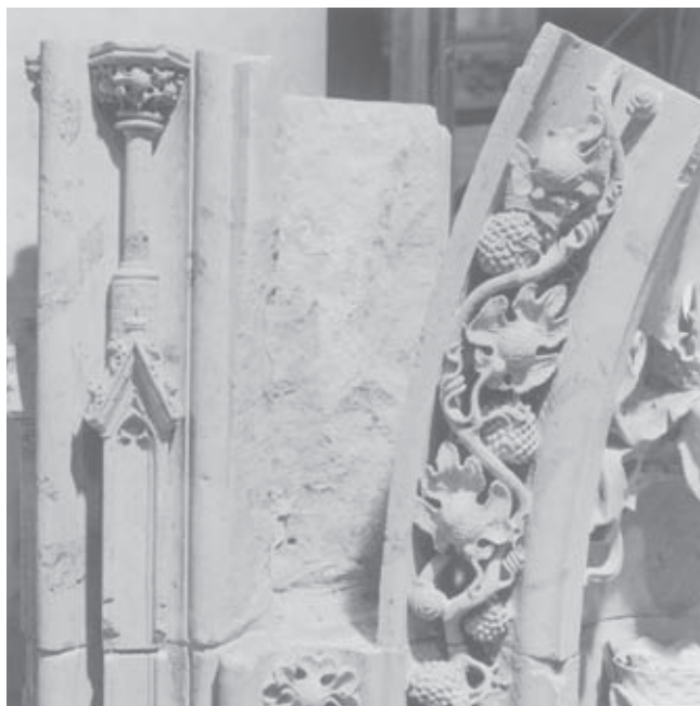
Afb. 7. Grafmonument voor Engelbrecht I en Johanna van Polanen en hun zoon Jan IV van Nassau en Maria van Loon, opbouw tijdens restauratie

gebroken, in plaats van de dook vanaf de onderzijde uit te boren (afb. 5). Een grote ijzeren trekstang, die van links naar rechts door het monument liep, werd door een bronzen exemplaar vervangen; hiervoor werd over de hele breedte van het monument een nieuwe, bredere sleuf door de steen gefreesd. Ook veel van het gedetailleerde beeldhouwwerk, de fijngehakte wijnranken bijvoorbeeld, heeft van de demontage sterk te lijden gehad. Op talrijke plaatsen zijn gebroken stukken gelijmd of is ontbrekend materiaal aangeheeld (afb. 6, 7).