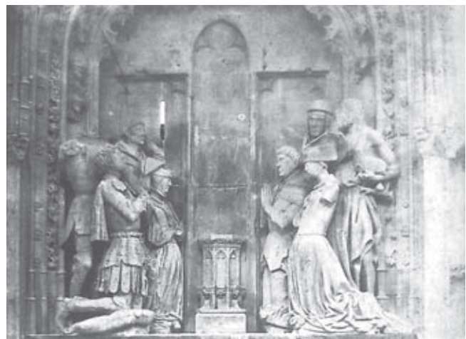
Afb. 3. Grafmonument voor Engelbrecht I en Johanna van Polanen en hun zoon Jan IV van Nassau en Maria van Loon, middendeel 1860