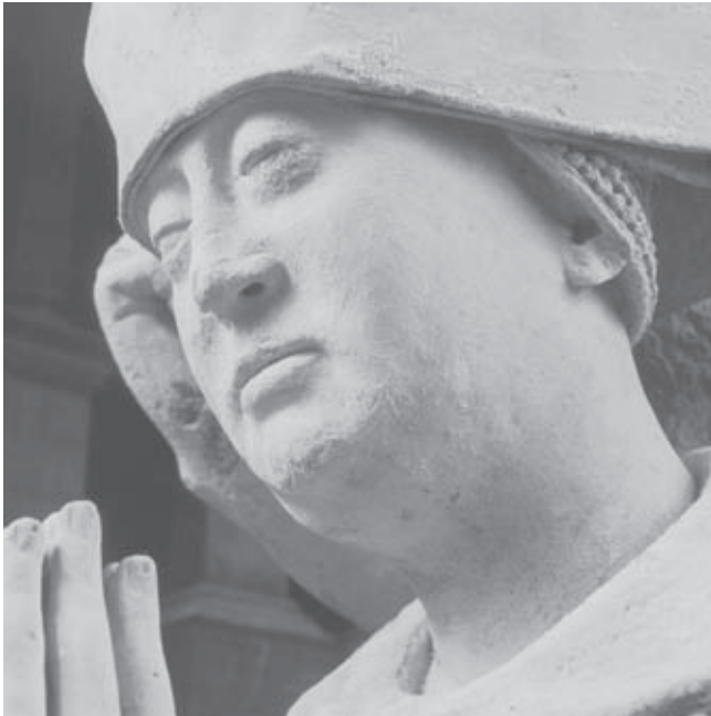
Afb. 10. Grafmonument voor Engelbrecht I en Johanna van Polanen en hun zoon Jan IV van Nassau en Maria van Loon, gelaat Maria van Loon na bijwerken

Aanleiding tot de restauratie was, net als bij de twee eerdere monumenten, de aanwezigheid van ijzeren doken die “door de met zekerheid te voorspellen roestvorming een soort ‘tijdbom’ in het monument” vormden. 20 Zonder hier het gevaar van roestende doken te willen bagatelliseren is dit een wat curieuze constatering, omdat elders in het monument het ijzer niet werd verwijderd (“een zeker gecalculeerd risico”). Overigens bleek bij de ontmanteling dat de beslissing tot verwijdering van de doken een juiste was: de albasten putti in de zwikken waren nog net niet kapot gedrukt door het uitdijende roest. 21 De demontage leverde ook talrijke aanwijzingen op over de complexe samenstelling van het monument, dat is opgebouwd uit hardsteen, Avesnes-steen en albast. Hoewel het omstreeks 1538 als één conceptuele eenheid werd ontworpen, waren bij de uitvoering duidelijk verschillende partijen betrokken zonder goede onderlinge coördinatie. Daardoor ontstond een aantal discrepanties in het monument, die nu voor het eerst goed konden worden onderzocht en geïnterpreteerd. De restauratie bood bovendien gelegenheid tot onderzoek naar de polychromie en resten van vergulding. Deze kleurige afwerking is uiteindelijk door een gespecialiseerde restaurator gerestaureerd en geconserveerd. 22