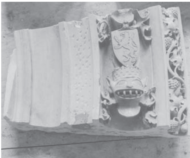
Afb. 6. Grafmonument voor Engelbrecht I en Johanna van Polanen en hun zoon Jan IV van Nassau en Maria van Loon, boogstuk tijdens restauratie

gebroken, in plaats van de dook vanaf de onderzijde uit te boren (afb. 5). Een grote ijzeren trekstang, die van links naar rechts door het monument liep, werd door een bronzen exemplaar vervangen; hiervoor werd over de hele breedte van het monument een nieuwe, bredere sleuf door de steen gefreesd. Ook veel van het gedetailleerde beeldhouwwerk, de fijngehakte wijnranken bijvoorbeeld, heeft van de demontage sterk te lijden gehad. Op talrijke plaatsen zijn gebroken stukken gelijmd of is ontbrekend materiaal aangeheeld (afb. 6, 7).