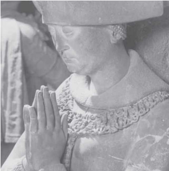
Afb. 8. Grafmonument voor Engelbrecht I en Johanna van Polanen en hun zoon Jan IV van Nassau en Maria van Loon, detail: gelaat Maria van Loon vóór restauratie