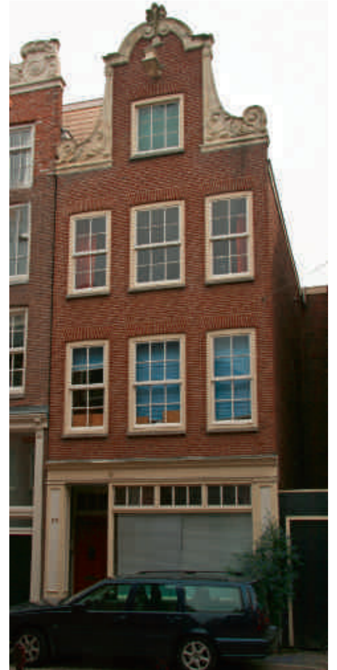
Afb. 8. Anjelijsstraat 23. Alleen aan de gelijke verdiepingshoogte en de vrij hoge borstweringen is te zien dan het een Van Houtenpand is (foto W. Schoonenberg)

Aan het andere uiteinde van het spectrum bevinden zich Van Houtenmonumenten die vrijwel niet te onderscheiden zijn van oude gevels. Een goed voorbeeld hiervan is Anjelijsstraat 23 (afb. 7 en 8). Van Houten was hier zo tevreden over dat hij het pand expliciet noemt in Amsterdamsche Merkwaardigheden , een enkele malen herdrukt boekje in de Heemschutreeks dat allerlei bijzonderheden van Amsterdamse woonhuizen beschrijft. Bij dit pand was een restauratieve benadering gekozen, waar de adviezen van de bouwinspecteur naar de letter waren opgevolgd, zelfs zodanig dat Van Houten als één van de architecten wordt genoemd. Het resultaat is naar zijn volle tevredenheid omdat 'het uiterlijk zoveel mogelijk met het oude stads karakter in overeenstemming (is) gebracht', 22 door het gebruik van een dunne, rode handvormsteen, het op vlucht bouwen van de gevel, de verdeling van de kozijnen in overeenstemming met de hals, gelijkvormige ruiten met een goede verhouding en, een roedenverdeling. Op die manier werd de kritiek van architecten dat de gevel-