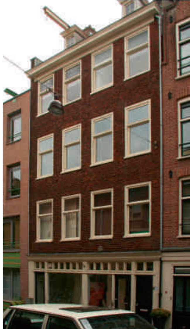
Afb. 6. Uitgevoerde nieuwbouw Laurierstraat 59-61 zonder hergebruikte oude toppen, maar met veel stilistische eigenschappen van Van Houtenpanden, die in feite de eigenschappen zijn van het jaren dertig-bouwen

dat hier sterk op lijkt, schreef Van Houten dat het is 'ingericht naar de thans geldende voorschriften, doch zonder eenige architectonische pretentie'. 18 Van dergelijke panden bestaan talrijke voorbeelden. In sommige gevallen worden ze gecombineerd met elementen als balkons en erkers die wezensvreemd zijn aan het karakter van de historische bebouwing van de binnenstad. 19 Van Houten had begrip voor het feit dat er niet altijd meer mogelijk was dan het herplaatsen van een geveltop, omdat de woningen ook in een moderne behoefte moesten voorzien. 20 Dit vereiste immers een bepaalde plattegrond en dus een corresponderende gevelindeling. Dit kwam niet altijd overeen met het door hem gewenste historische gevelbeeld. Bij een pand op de Reguliersgracht, waar een garage-ingang werd gemaakt, merkt Van Houten op dat twee moeilijk verenigbare zaken met elkaar in overeenstemming moesten worden gebracht: 'de omgeving niet storen en toch in moderne behoefte voorzien'. 21 Veel Van Houtenpanden zijn dus feitelijk jaren dertig-woningen met als enige verschil de hergebruikte geveltop. Dit beeld is echter niet wat Van Houten nastreefde. Hij probeerde ook belangrijke andere