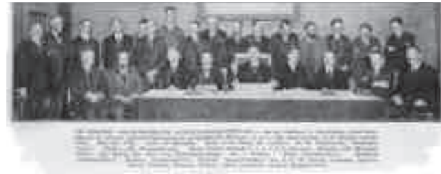
Afb. 9. Krantenknipsel, gedateerd 9 september 1924, in het archief van Van Houten (KOG archief). Door Van Houten uitgeknipt en van datum voorzien. Van Houten vond dit een 'handig' knipseltje omdat alle leden van de nieuwe Schoonheidscommissie met naam werden vermeld