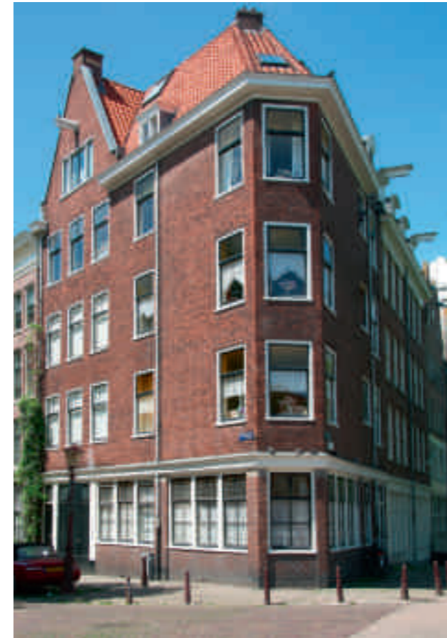
Afb. 3. Typerende nieuwbouw uit de jaren dertig. Palmgracht 2, hoek Brouwersgracht. In alle opzichten een Van Houtenpand, maar dan zonder herplaatste geveltop

merkt dat het geen kopie is van het oude. 14 Deze benadering maakt het mogelijk een groot aantal panden in de Amsterdamse binnenstad als Van Houtenmonumenten te identificeren, maar gaat voorbij aan de vraag of Van Houten daadwerkelijk bij de bouw betrokken was.