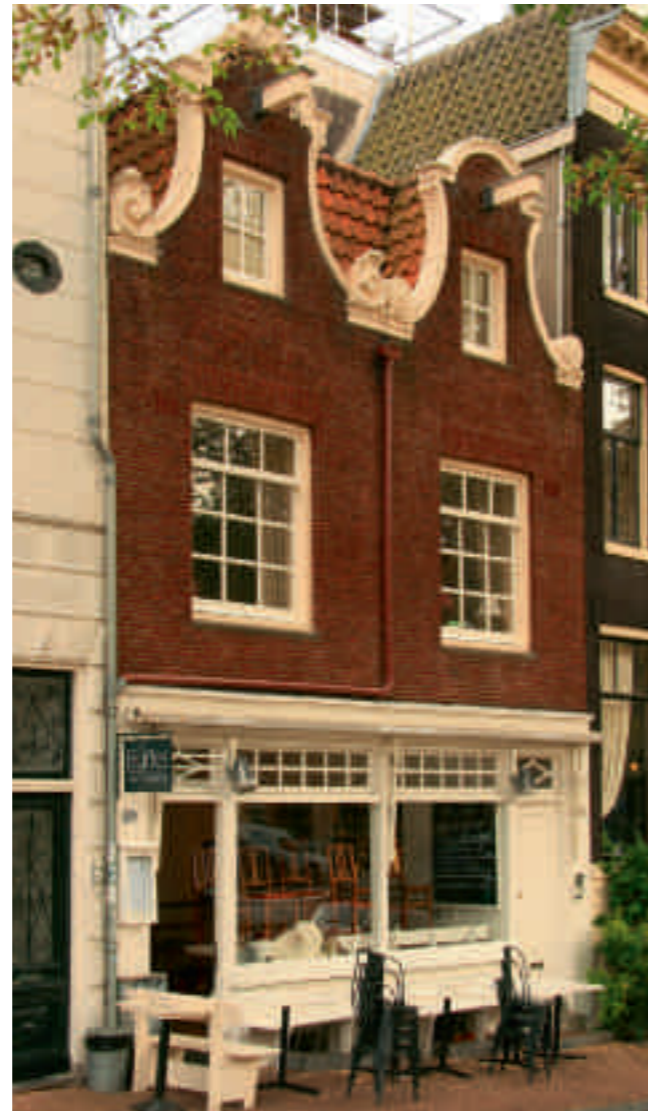
Afb. 2. Herengracht 309-311 (1935)

topgevel. 13 Ook aan de 'slechte verhoudingen' ten gevolge van de grootte van de gevels in relatie tot de topgevels kan men Van Houtenmonumenten herkennen. Op grond van deze kenmerken werd een lijst van 205 gebouwen vastgesteld. De Van Houtenpanden blijken niet alleen waardevol vanwege de herplaatste geveltoppen, maar ook omdat ze representatieve en herkenbare voorbeelden van eigentijdse nieuwbouw zijn (afb. 2 en 3). De Van Houtenmonumenten zijn doorgaans geen reconstructies van zeventiende- of achttiende-eeuwse woonhuizen, onder andere omdat de panden moesten voldoen aan de bepalingen van de Woningwet en vanwege de crisistijd goedkoop werden gebouwd. Een Van Houtenpand lijkt oppervlakkig beschouwd op historische architectuur, maar is in werkelijkheid een modern woonhuis. Achter de gevel gingen moderne etagewoningen schuil, van hetzelfde type dat in menige nieuwbouwwijk werd gebouwd. Over het 'Van Houtenmonument' Keizersgracht 464 hoek Leidsegracht bijvoorbeeld werd door tijdgenoten opge-