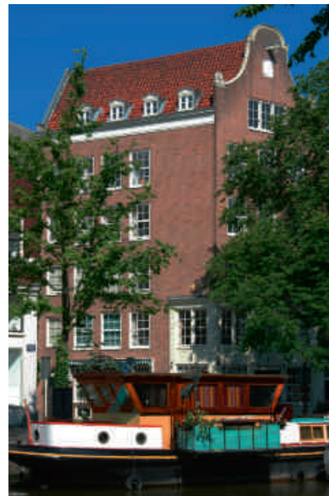
Afb. 12. Prinsengracht 274, hoek Elandsstraat (A.A. Kok, 1936)

Een inventarisatie op basis van een beperkt aantal stilistische kenmerken levert een geheel andere lijst van Van Houtenmonumenten op dan een opsomming van alle panden waarbij Van Houten aantoonbaar was betrokken. De door Van Houten opgestelde lijst bevat 127 geveltoppen, waarvan er in de periode 1928-1947 slechts 65 daadwerkelijk zijn gebruikt bij nieuwbouw of restauraties. Van Houten leverde niet alleen geveltoppen voor typische jaren dertig-nieuwbouw, maar ook voor projecten met een meer restauratieve benadering die overigens zijn voorkeur genoten. Tegelijkertijd betekent deze conclusie dat Van Houten in zijn werkwijze niet alleen stond. Het grote aantal Van Houtenpanden op de BMA-lijst zou anders niet te verklaren zijn. Het streven van Van Houten om oude gevelfragmenten te herplaatsen werd dus op grote schaal nagevolgd.