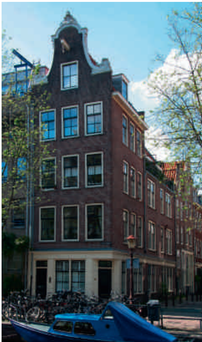
Afb. 1. Lauriergracht 62, hoek Eerste Laurierdwarsstraat (1933)

De zeventiende-eeuwse Amsterdamse binnenstad is met haar achtduizend monumenten een beschermd stadsgezicht in de zin van de Monumentenwet en sinds 2010 is de grachtengordel