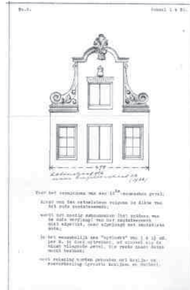
Afb. 7. Anjelijsstraat 23. Tekening top nr. 2, afkomstig van Kalverstraat 116, met voorschriften van Van Houten waaraan de herbouw van een gevel moest voldoen (Tekening Van Houten, KOG archief.)

eigenschappen van oude Amsterdamse gevels gerealiseerd te krijgen, zodat een pand er minder eigentijds uit zou zien en zich beter zou voegen in de omgeving. Hij lijkt zich bewust van de architectenkritiek dat een geveltop moet passen op de gevel, meer dan alleen in afmetingen. Van Houten probeerde behalve het herplaatsen van een geveltop ook te bereiken dat de gevel niet loodrecht werd opgetrokken, maar op vlucht werd gebouwd en dat daarbij een dunne handvormsteen werd toegepast, in plaats van de grove jaren dertig-baksteen. Bovendien streefde hij een historisch verantwoord gevelbeeld na, zoals verticale ramen met roedenverdeling, een driedelige raamverdeling, een top in overeenstemming met de rest van de gevel, muurdammen in lijn met de hals, hanenkammen boven de vensters en historisch kleurgebruik. Anders gesteld: Van Houten trachtte dat de stilisti-