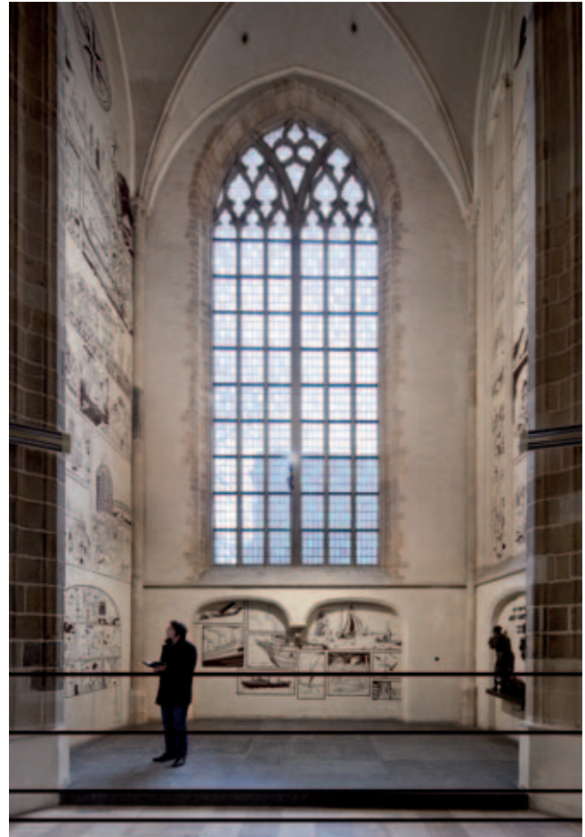
Laurenskerk, bezoeker in Kapel van de Zending (ontwerp Kossmann.dejong)

onderzoek van Heemskerk gaf 93,8 % van de bezoekers aan specifiek voor de tentoonstelling naar de kerk te zijn gekomen. Van dit percentage maakte 67,9% gebruik van de audioguide. 6 Bij de ingang probeert het baliepersoneel de bezoekers enthousiast te maken voor de audiotour, maar sommige mensen willen blijkbaar alleen maar even door het gebouw en langs de tentoonstelling lopen. Uit de bevraging bleek daarentegen wel, dat als de bezoekers voor de audioguide kozen, zij de tentoonstelling anders ervoeren; met de verhalen en muziek op de achtergrond wordt de ruimte op een heel andere manier beleefd. De enquête van Heemskerk had ook aangetoond dat bezoekers gemiddeld langer in de Laurenskerk vertoefden dan in de Grote Kerk in Dordrecht of in de Sint-Janskerk in Gouda, wat waarschijnlijk verband houdt met de audioguide. 7 Een jonge student, die de markt bezocht en besloot ook even de kerk binnen te lopen, gaf aan dat hij zonder de audioguide weer snel buiten had gestaan, maar nu een uurtje de tijd genomen om alles te bekijken en beluisteren. Een wat oudere mevrouw uit Rotterdam was van mening dat dankzij de expositie met audioguide de kerk nu meer een rustpunt in de stad was geworden, waar je kan rondwandelen, naar muziek luisteren en nadenken.