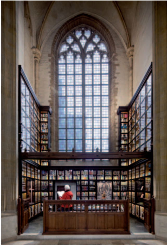
Laurenskerk, bezoeker in Kapel van de Librije (ontwerp Kossmann.dejong)

onderzoek van Heemskerk gaf 93,8 % van de bezoekers aan specifiek voor de tentoonstelling naar de kerk te zijn gekomen. Van dit percentage maakte 67,9% gebruik van de audioguide. 6 Bij de ingang probeert het baliepersoneel de bezoekers enthousiast te maken voor de audiotour, maar sommige mensen willen blijkbaar alleen maar even door het gebouw en langs de tentoonstelling lopen. Uit de bevraging bleek daarentegen wel, dat als de bezoekers voor de audioguide kozen, zij de tentoonstelling anders ervoeren; met de verhalen en muziek op de achtergrond wordt de ruimte op een heel andere manier beleefd. De enquête van Heemskerk had ook aangetoond dat bezoekers gemiddeld langer in de Laurenskerk vertoefden dan in de Grote Kerk in Dordrecht of in de Sint-Janskerk in Gouda, wat waarschijnlijk verband houdt met de audioguide. 7 Een jonge student, die de markt bezocht en besloot ook even de kerk binnen te lopen, gaf aan dat hij zonder de audioguide weer snel buiten had gestaan, maar nu een uurtje de tijd genomen om alles te bekijken en beluisteren. Een wat oudere mevrouw uit Rotterdam was van mening dat dankzij de expositie met audioguide de kerk nu meer een rustpunt in de stad was geworden, waar je kan rondwandelen, naar muziek luisteren en nadenken.