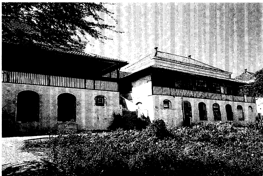
Afb. 2. Het voormalig hospitaal Plantersrust uit 1891. Dit gebouw is vrijwel een kopie van een gebouw in Bogor bij Jakarta.

Het dwingt tot de vraag naar het ontstaan en vervolgens naar de vraag of wij zelf niet in staat zijn monumenten voor morgen te maken. Het aanschouwen van een monument moet leiden tot zelfvertrouwen en niet tot valse schaamte. Het mag niet slechts een bron van inspiratie zijn voor hen die oppervlakkig stilistische kenmerken willen kopiëren. Een praktijk die welig tiert onder de noemer van harmonisch aansluiten op het verleden. Historische gebouwen moeten gezien worden als documenten. Documentaties van doeltreffende antwoorden op toenmalige maatschappelijke behoeften, waarbij men ondanks gebrekkige technische kennis en primitief bouw materiaal toch kans zag om in te spelen op het klimaat. Als wij geïnspireerd door monumenten onszelf met het bouwen deze doelen opnieuw zouden stellen, in plaats van deze oppervlakkig te kopiëren, zou al heel wat bereikt zijn. Ik kan mij namelijk niet aan de indruk onttrekken dat zich in Willemstad, met inzet van het cultureel erfgoed, een klein drama afspeelt. Een drama dat zich, wie Willemstad bekijkt, onmiddellijk opdringt. Ik ben niet de eerste die dit signaleert.