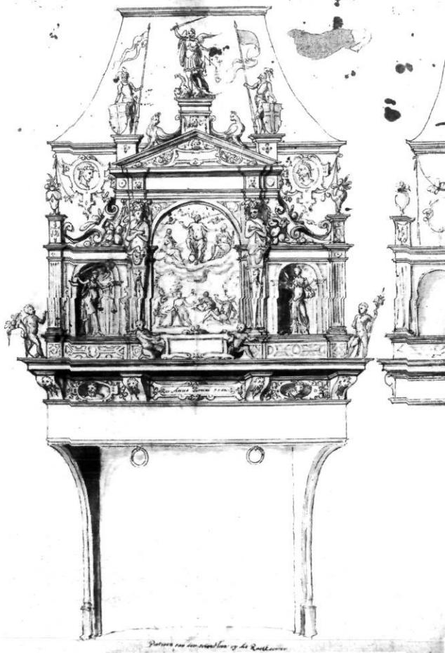
Afb. 1. Patroen van den schorsteen up die Raetkaemer -Anno domini 1560- voor de raadzaal in het stadhuis van Zwolle, inkttekening toe te schrijven aan mr. Jelis Jelissen uit Kampen (Gemeente Archief Zwolle, foto Th.J. de Vries)

Het Zwolse Gemeente Archief bezit een uit 1560 daterend ontwerp van een schouw bestemd voor de raadzaal in het stadhuis (afb. 1). 1 Tot uitvoering in deze vorm is het nooit gekomen. Het ontwerp bleef anoniem, hoewel Erwin Panofsky in 1959 een toeschrijvingspoging deed. 2