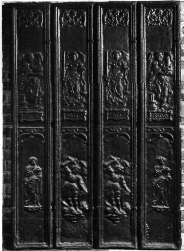
Afb. 12. Schouw in de raadzaal te Zwolle, vier gietijzeren haardplaten, midden 16 de eeuw