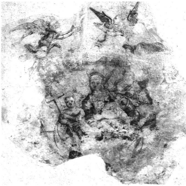
Afb. 8. Bethlehemkerk Zwolle, muurschildering hoog op de oostelijke sluitingsmuur van de zuidbeuk, midden 16 de eeuw, thans afgenomen

Een soortgelijk conflict deed zich in 1532 voor te Utrecht. Colijn de Nole had zich daar in 1530 gevestigd als steenhouwer 55 maar werd lid van het zadelaarsgilde waarin schilders en beeldsnijders opgenomen waren. Omdat hij ook beelden in steen vervaardigde, ontstond in 1532 een aanvaring met het Utrechtse steenbikkersgilde. Colijn de Nole weigerde (eveneens) lid van dat gilde te worden en kreeg daarin gelijk. Zowel in Utrecht als in Kampen werden processen gevoerd en getuigen gehoord. Er waren problemen met de acceptatie van ambachtelijk gezien veelzijdige of juist theoretisch geschoolde meesters, mogelijk ook met vaklieden zonder