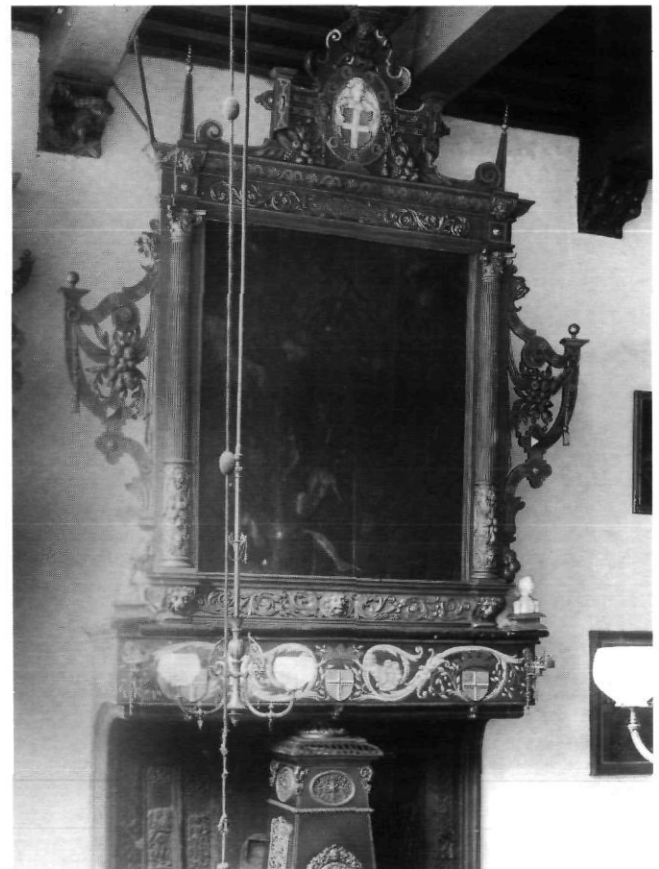
Afb. 11. Schouw in de raadzaal te Zwolle, hier is de 15 de -eeuwse frontplaat nog voorzien van een beschildering

Van Jelis Jelissen weten we niet meer dan dat hij gildenmeester en daarmee burger van Kampen was en dat zijn overlijden