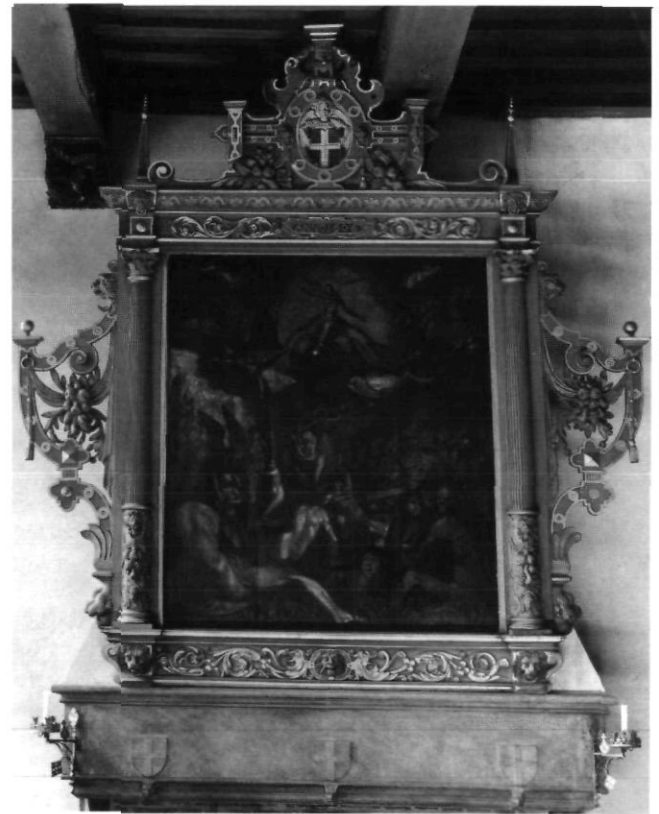
Afb. 4. Raadzaal Zwolle, schoorsteenstuk met Laatste Oordeel van anonieme schilder en lijst uit 1606 van Sweer Kistemaker (foto A.J. van der Wal RDMZ 1970)

In de reeks vernieuwingen aan het stadhuis speelt deze Jelis rond 1560 een bijzondere rol omdat het nu om speciaal steenhouwerswerk gaat. Met het bedragje dat de raad hem als stienhouwer van campen laat betalen kan bezwaarlijk iets anders bedoeld zijn dan een vergoeding voor het in 1560 gedateerde ontwerp van de schouw ten behoeve van de raads-