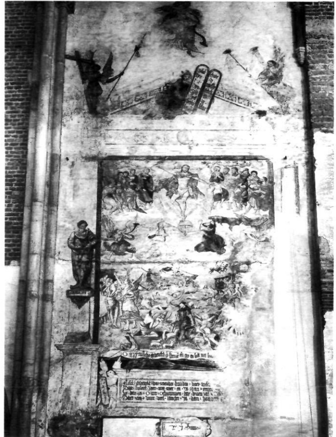
Afb. 9. Grote- of St. Lebuinuskerk Deventer, Laatste Oordeel uit 1549 op de noordmuur van de noordelijke zijbeuk

vaste verblijfplaats. Het verschijnsel van mobiliteit bestond echter in de middeleeuwen al, contrarie de overall geldende eis van burgerschap en gildendwang. De gangbare praktijk toont dat mobiliteit overkomelijk was, ook omdat men voor bepaalde of bijzondere opdrachten dikwijls niet over lokale menskracht beschikte.