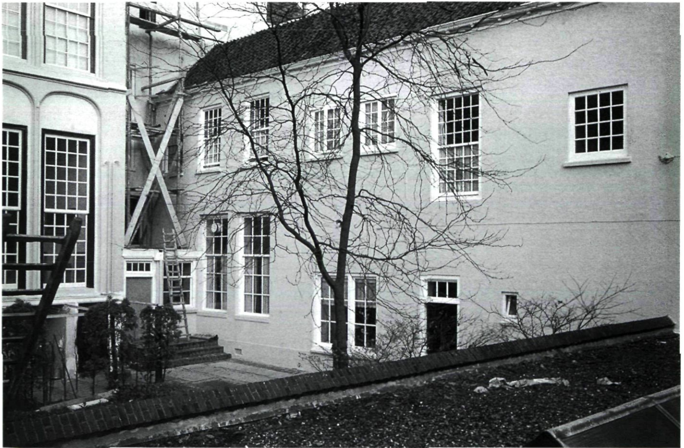
Afb. 2. Stadhuis Zwolle, zuidelijke aanbouw van het Meentehuis met links daarin de Schrijfkamer die in 1973 gesloopt werd; geheel links op de b.g. de vensters van de raadzaal