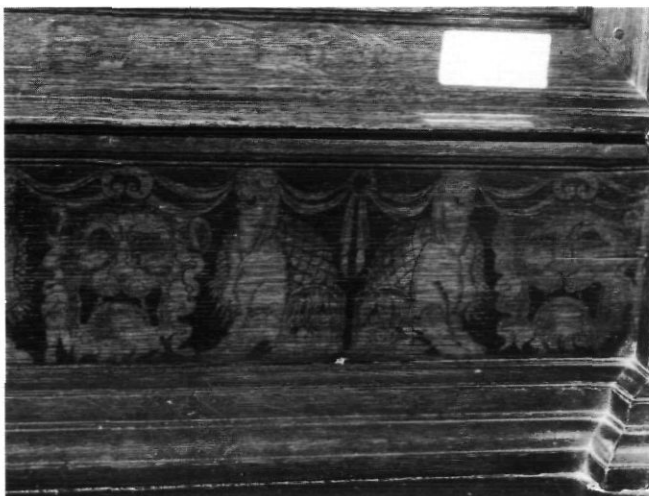
Afb. 10. Paneel met geschilderde voorstellingen op de bank midden in de Raadzaal te Kampen, circa 1545