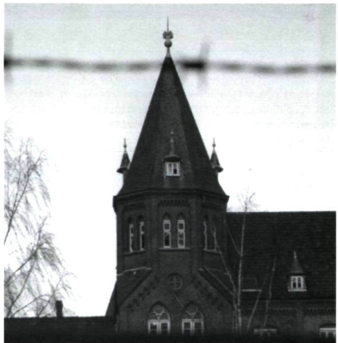
Afb. 1. Foto uit november 2002. Een van de hoektorens vertoont duidelijk zichtbare sporen van verwaarlozing.

In 1978 kocht het rijk het complex van de paters. Van 1978 tot 1984 circuleerden verschillende plannen voor een nieuwe bestemming van St. Ludwig. Eerst zou een opleidingscentrum