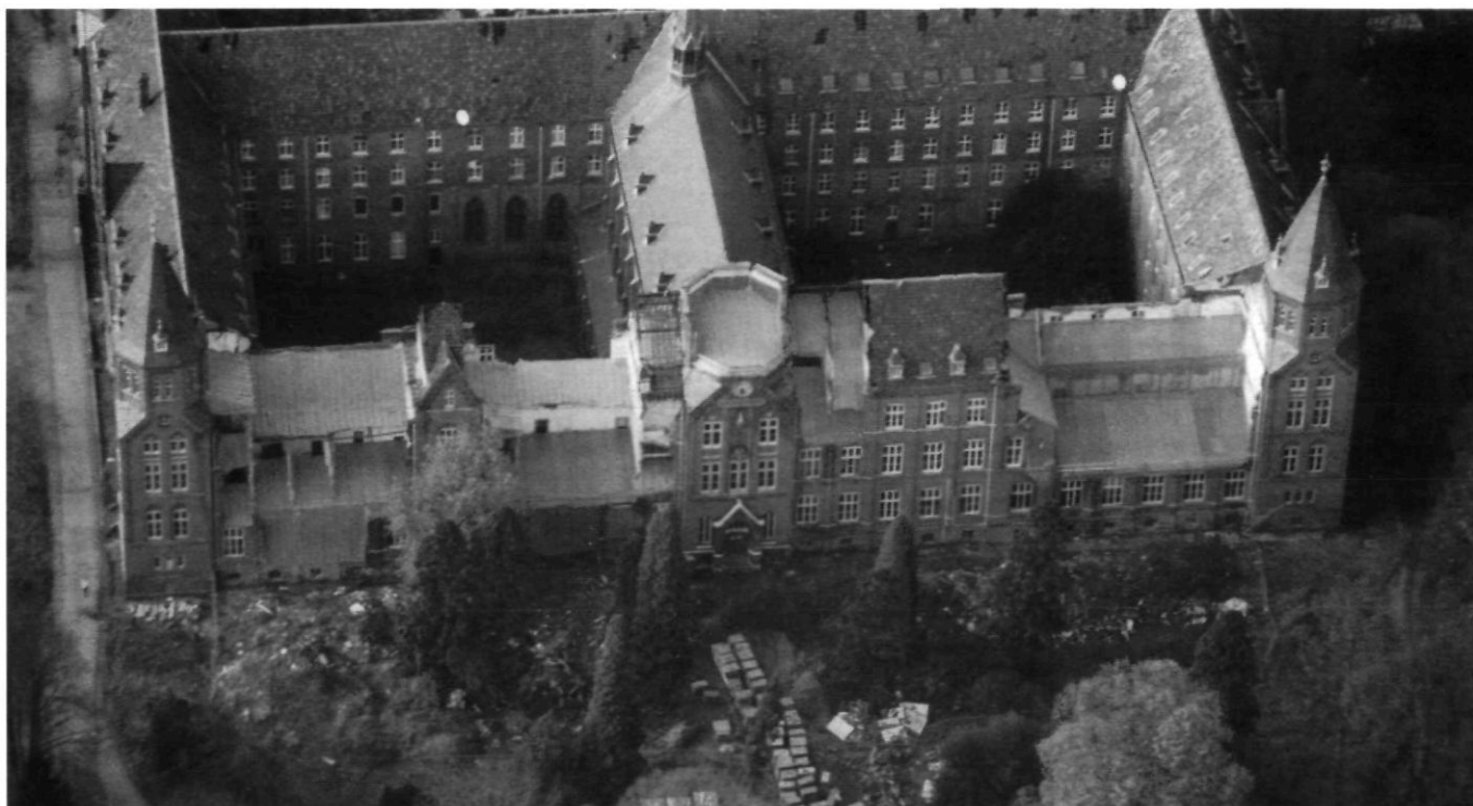
Afb. 5. Luchtfoto uit november 2002. De schade aan de voorgevel, veroorzaakt door ongeautoriseerde sloopwerkzaamheden in september van dat jaar, is duidelijk zichtbaar

In september 1998 gaven B&W van Roerdalen een sloopvergunning af in het kader van de monumentenwet. Tijdens een