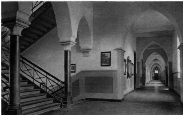
Afb. 4. Schoolgang rond 1930. Waarschijnlijk is de toestand nog als afgebeeld.

OC&W het College had aangewezen als beschermd Rijksmonument brak een nieuwe fase aan. Rond deze tijd vormde de cultuurhistorische waarde van het College onderwerp van onderzoek en discussie. Op verzoek van de MERU stelde A. van der Woud van de Vrije Universiteit van Amsterdam een onderzoek in naar de architectuurhistorische waarde van het complex en kwam daarbij tot een oordeel dat afweek van eerdere waardestellingen. Zijn 'contra-indicatie' werd door twee bestuursleden van het Cuypersgenootschap uitvoerig van commentaar voorzien. Deze interessante polemieek is terug te vinden in de Cuypersbulletin 4 (1998) 2a en 2b.