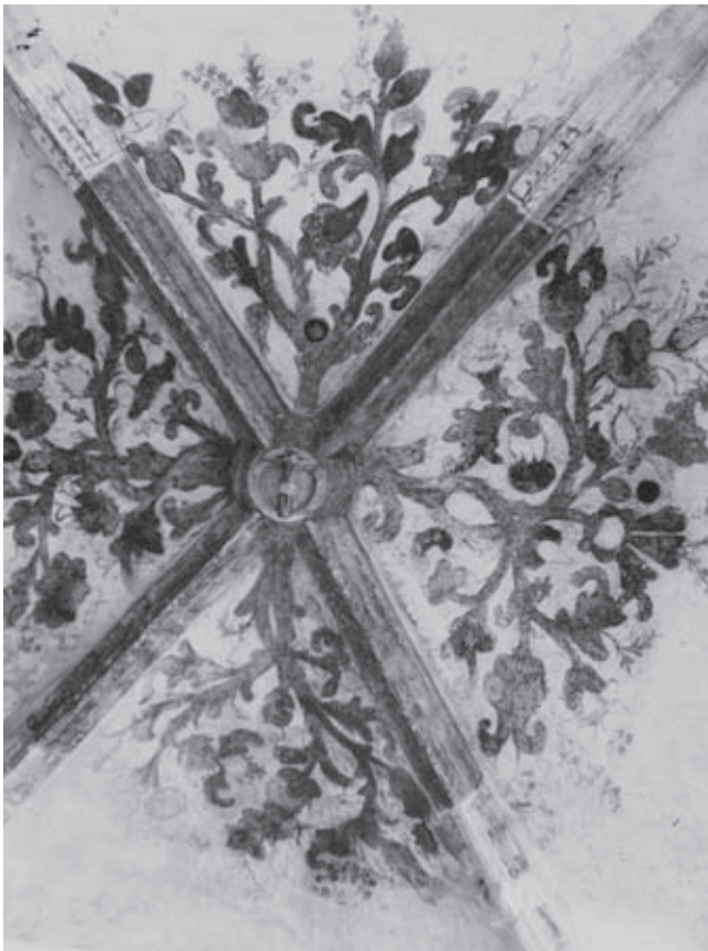
Afb. 3. Gewelvschildering rond sluitsteen in zuidelijke travee transept

Ook restaureerde Rovers in deze periode opnieuw de gewelven. Hij ging systematisch te werk en herstelde enkele traveeën per jaar. Soms werden traveeën alleen ‘bijgewerkt’ en soms was het nodig dat zij ‘geheel gerestaureerd’ werden, zoals de vierde en vijfde travee van het middenschip in 1954. 51 Drie jaar later werden de gewelven van de eerste en tweede travee van de noorderzijbeuk van het schip voorzien van een nieuw rozet van dezelfde grootte als de drie bestaan-