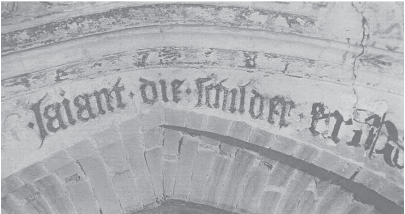
Afb. 1. Grote Kerk Breda 'signatuur' van Jaiaint die schilder boven sluitingswand

Er is zeer weinig bekend over de schilders en de opdrachtgevers. Vaak kwam de opdracht van het kerkbestuur, een rijke burger of een gilde. De schilderingen van de Kruisbogen en wapenschilden , van de Twee weiden met vee en van de Lakenscharen zijn duidelijk door de betreffende gilden besteld ter versiering van hun kapel of altaar. De meeste overige schilderingen zijn waarschijnlijk door het kerkbestuur zelf besteld. Van de vieringschildering met Musicerende engelen en van de schildering met Kelken en hosties zijn rekeningen bewaard gebleven.