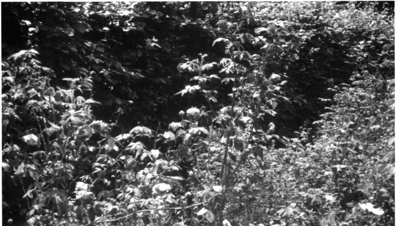
Afb. 4. Reconstructie van Engels bosje met de heester Franse Roos op Beekestijn