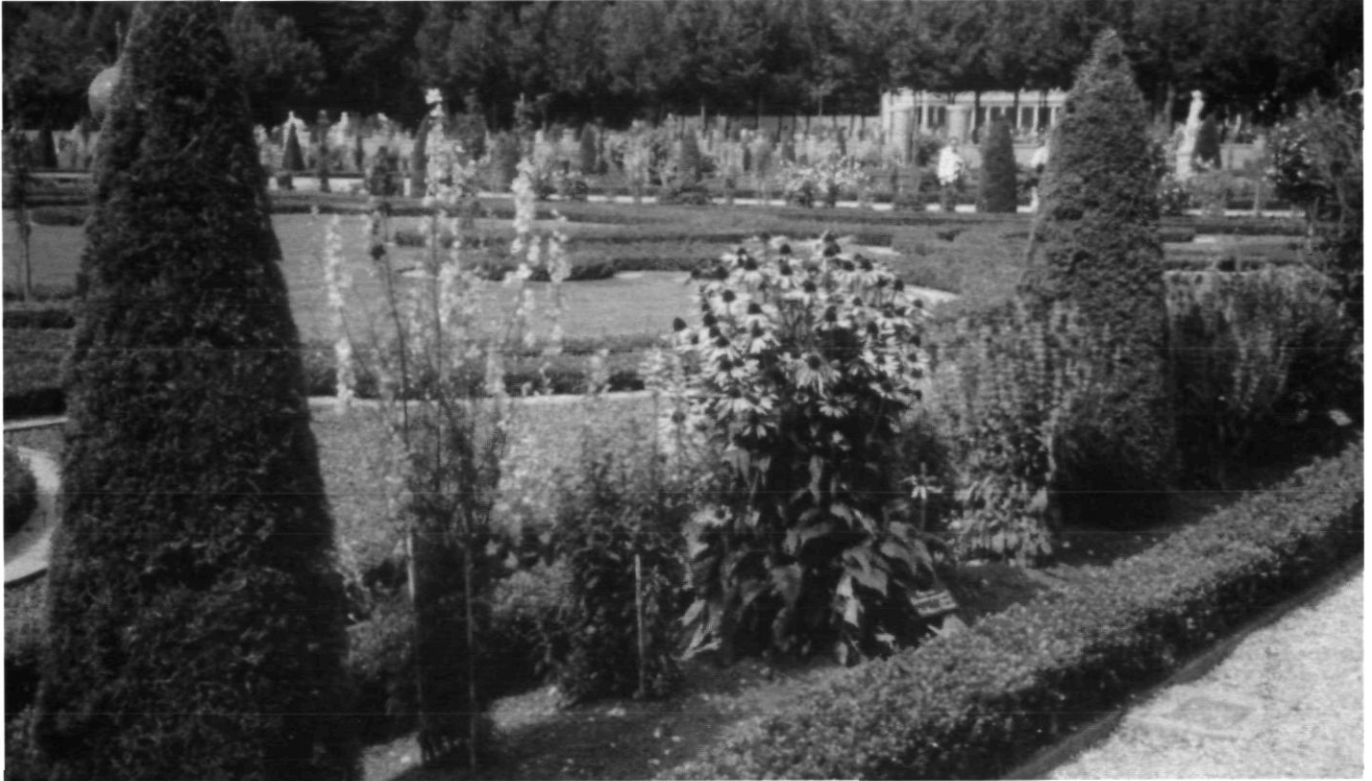
Afb. 3. Detail met aanplant Echinacea purpurea (foto Oldenburger Historische Tuinen, 2002)