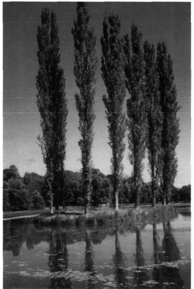
Afb. 5. Ermenonville, het Ile Jean-Jacques Rousseau met de zwarte populieren (foto Oldenburger Historische Tuinen, ca. 1980)

Om aandacht te vragen voor deze negatieve ontwikkelingen, nam de Stichting PHB in 1995 het initiatief om samen met