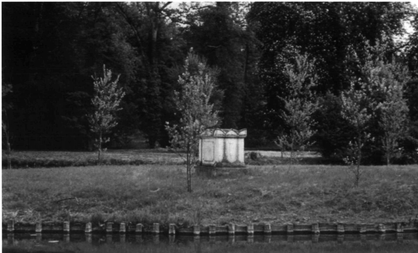
Afb. 6. Ermenonville, het Ile Jean-Jacques Rousseau met de witte Populieren of Abelen

Allereerst werd een gezicht in de Kloostergang (Pandhof) te Utrecht getoond. Deze tuin is in 1962 ontworpen door de tuinarchitect Hein Otto. De tuin is eind jaren zestig aangelegd, zonder dat iemand zich heeft afgevraagd of een kruidentuin in de Middeleeuwen ooit heeft bestaan op die plaats. Waarschijnlijk dus niet is het antwoord. De inheemse planten zijn zeer zorgvuldig uitgezocht en werden allemaal toegepast in de Middeleeuwen, volgens middeleeuwse bronnen. Vorm en inhoud zijn dus niet als een eenheid behandeld tijdens de restauratie.