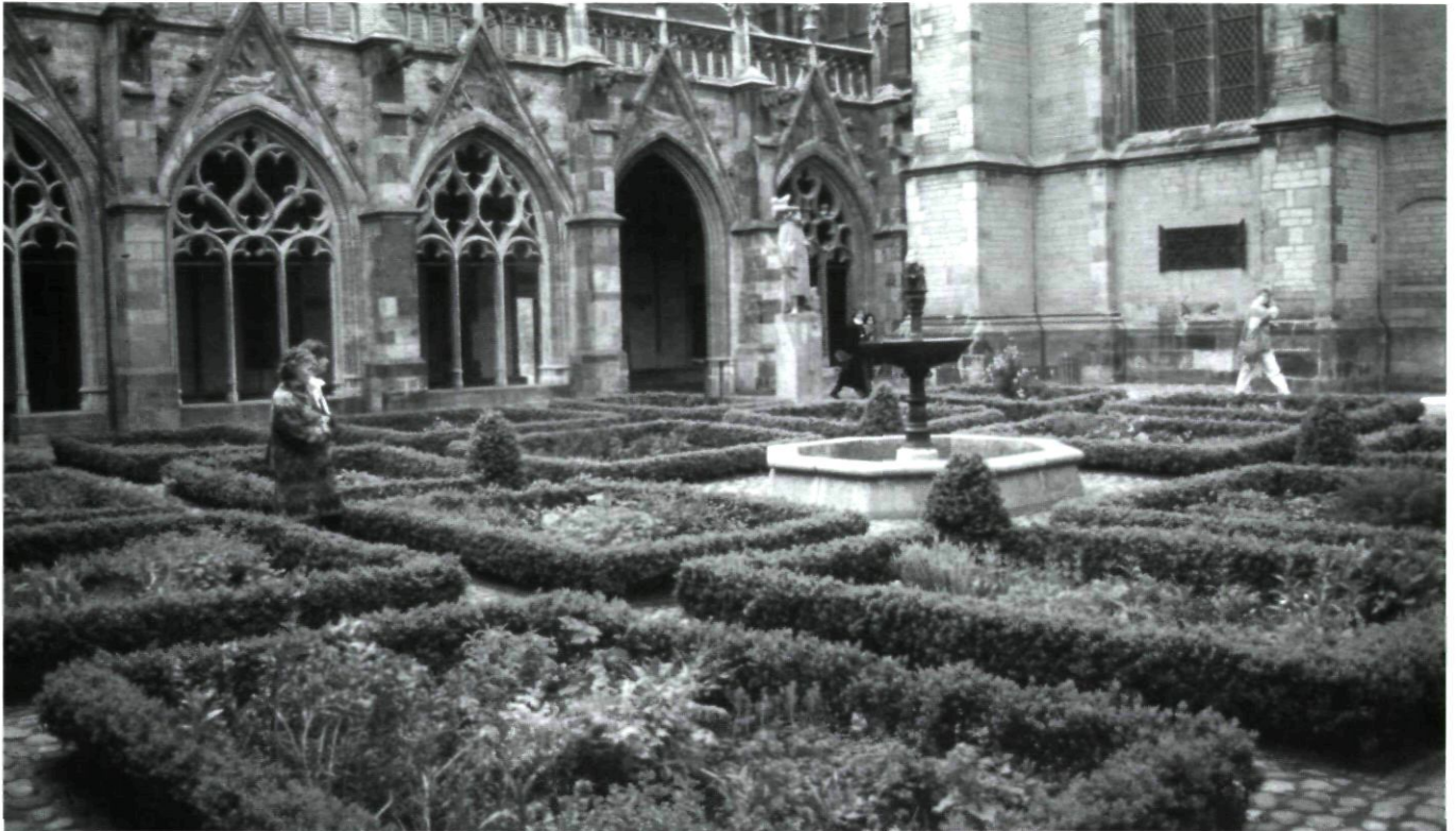
Afb. 1. De Pandhof te Utrecht