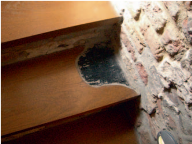
Afb. 8 Sommige van de verbrande traptreden zijn als herinnering aan de fatale brand behouden (Kasteel Nederhemert, Nederhemert-Zuid, april 2008)

fauna, weersinvloeden en natuurlijke verwerking er in zekere mate vrij spel hebben, terwijl bij 'hedendaagse ruïnes' de menselijke factor nog sterk herkenbaar en van invloed is. 43