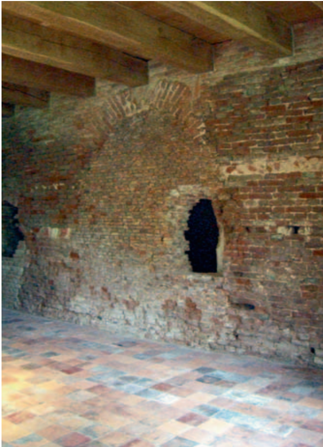
Afb. 4 De muren van de woontoren worden op de verschillende verdiepingen getekend door vele bouwsporen zoals die van de toegang tot een waterput, diverse gevelopeningen en kaarsnissen (Kasteel Nederhemert, Nederhemert-Zuid, april 2008)

In het onderzoek formuleert Kamphuis acht onzekere aspecten die extra aandacht verdienen. Enerzijds zijn dat onzekerheden over de functie of totstandkoming van enkele delen van het kasteel. Zo kon niet met zekerheid worden vastgesteld of de woontoren in oorsprong ook die functie had en of de variaties in de lagenmaten van het metselwerk bewust tijdens de bouw ervan waren aangebracht om de scheefstand ten gevolge van een slechte fundering optisch te corrigeren. Ook de oorspronkelijke opzet van de zuidvleugel, de datering van de keukentoren en de vorm en ouderdom van de traptoren blijven in het rapport vooralsnog een raadsel.