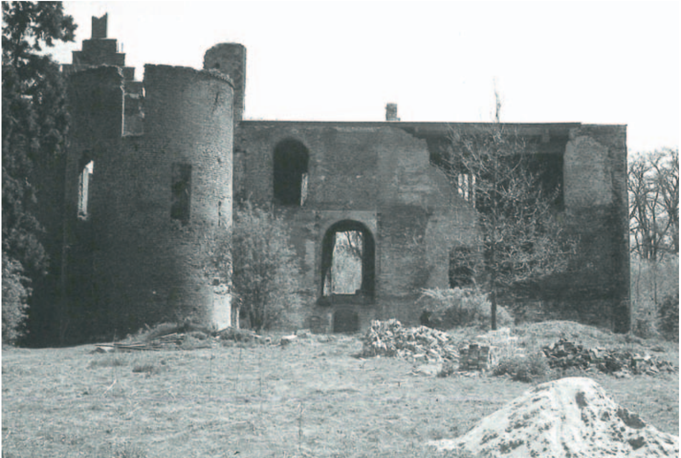
Afb. 2 De voorzijde van kasteel Nederhemert in 1966, nadat de traptoren was ingestort en daarmee een deel van de voorgevel en de ronde toren had meegenomen (foto R. Faber, in J.C. Bierens de Haan en W. Kramer, Kasteel Nederhemert: een eeuwenlang bestaan, Zwolle: Waanders 2005, 43)

gische wetenschap in de hoop dat deze de wens tot herbouw kracht kan bijzetten.