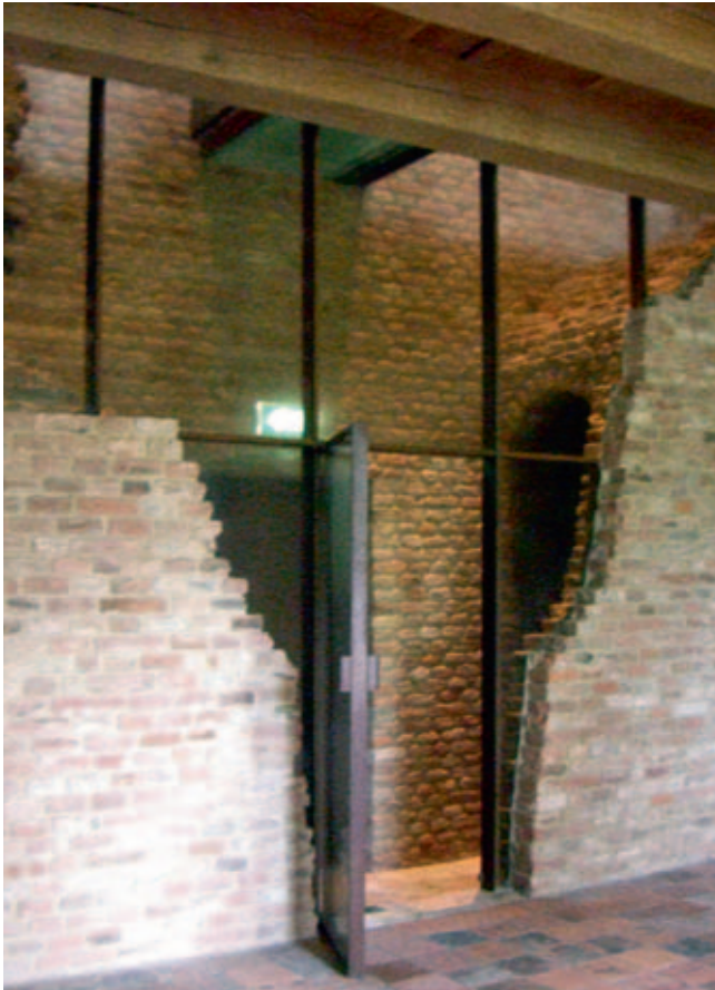
Afb. 7 Ter plaatse van de muurtrappen heeft de architect ervoor gekozen om het vervallen uiterlijk van de binnenmuren te behouden en het muurvlak in hedendaagse vormgeving en materialisering aan te vullen (Kasteel Nederhemert, Nederhemert-Zuid, april 2008)

vleermuizen, vinden in ruïnes een ideale behuizing.