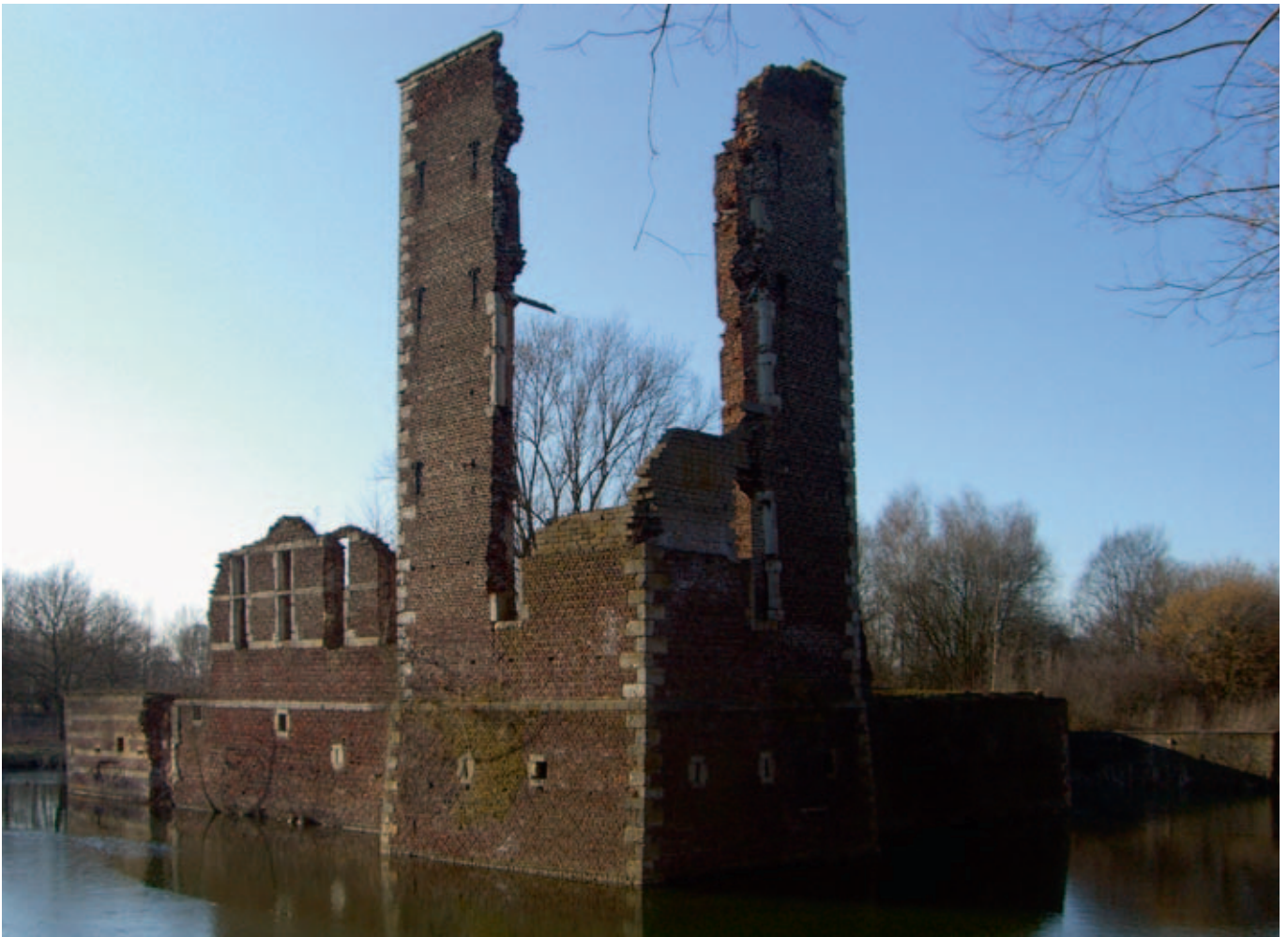
Afb. 1 Kasteel Schaesberg wacht op ‘wetenschappelijk verantwoorde’ herbouw (Landgraaf, maart 2010)

schappelijk verantwoorde wijze” worden herbouwd. 2 Reconstructie van monumenten is een vraagstuk dat zowel onder theoretici als bij het grote publiek voor- en tegenstanders kent. Initiatieven tot de herbouw van bijvoorbeeld het Valkhof te Nijmegen of het Paleis voor Volksvlijt in Amsterdam doen veel stof opwaaien. Niet alleen bij deze, maar ook bij andere projecten wendt men zich tot de bouwhistorische of archeolo-