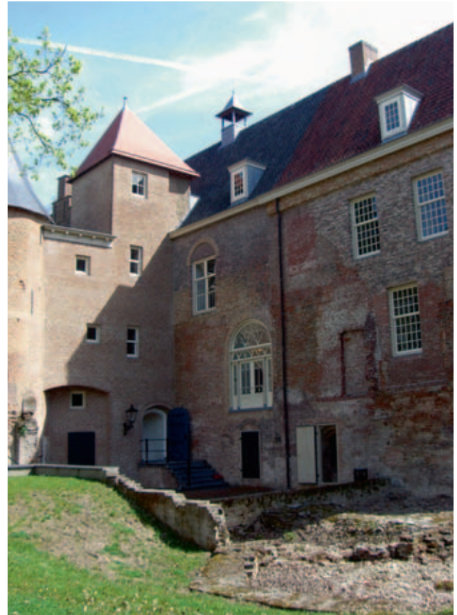
Afb. 3 De huidige voorgevel draagt de sporen van het vroegere gebruik als achtergevel en binnenmuur. De hoofdingang is in de traptoren gesitueerd (Kasteel Nederhemert, Nederhemert-Zuid, april 2008)

Bouwhistorische belangstelling voor ruïnes, bijvoorbeeld in de vorm van oude gravures, is een bekend fenomeen. Het opmeten en vastleggen van een ruïne overtuigt al snel van zijn documentaire waarde. 13 Ook in het geval van Nederhemert was het een uitgebreid bouwhistorisch onderzoek dat de waardering voor de ruïne deed groeien en meteen de discussie over het behoud van het ruïneuze uiterlijk weer liet opbloeien. In 1985 publiceerde J. Kamphuis zijn ‘oriëntatie op de bouw-