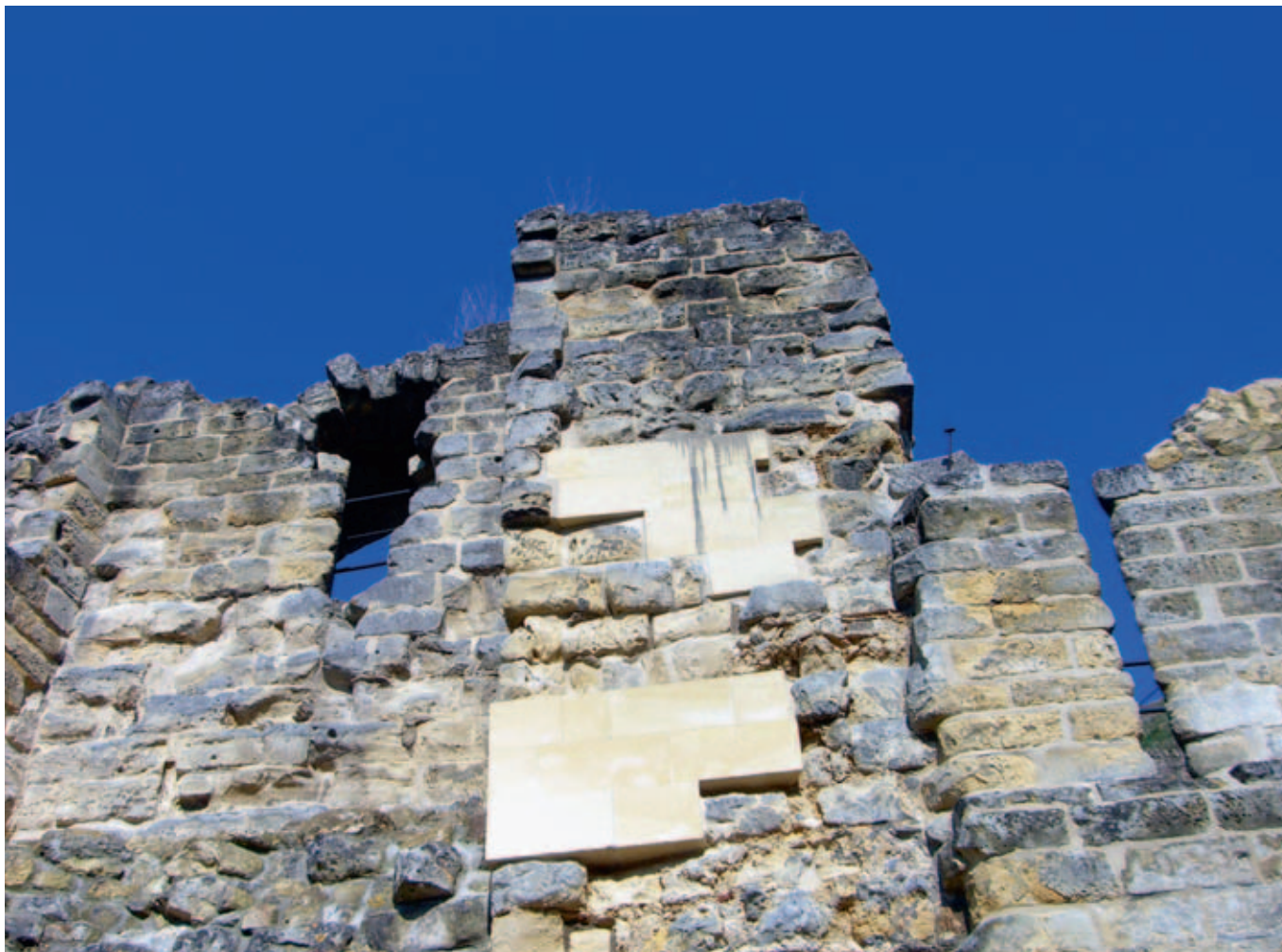
Afb. 10 Een detail van de consolidatie van de ruïne van Valkenburg waaraan thans de laatste hand wordt gelegd (Valkenburg a/d Geul, maart 2010)

de restanten van het gebouw, prevaleren de materiaalgebonden waarden juist, terwijl bij het restaureren en deels of geheel reconstrueren van ruïnes bovendien een groot belang wordt gehecht aan immateriële waarden als beleving en beeld. In deze gevallen is het de uitdaging om een manier te vinden waarop de duurzaamheid van de ruïne kan worden vergroot, zonder dat de materiële basis voor betekenissen zoals bouwhistorische waarde, bronwaarde en belevingswaarde schade worden berokkend. 46