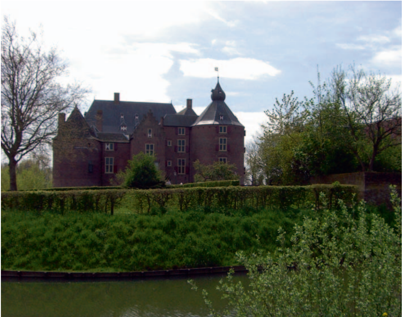
Afb. 11 Kasteel Ammersoyen, een voorbeeld van kasteelreconstructie uit 1974 (Ammerzoden, april 2008)

hoge kosten die mede leiden tot het besluit om het gebouw volledig te reconstrueren. Alleen als compleet gebouw zou de ruïne de ‘maatschappelijke bestemming’ kunnen krijgen die genoeg geld genereert om het behoud van de historische bouwfragmenten zeker te stellen. Vooral bij kastelen en burchten, van oudsher bouwwerken met een indrukwekkende maatschappelijke betekenis, gaat steeds vaker de roep op om de gebouwen te herstellen. De wetenschappelijke en immateriële waarden van de ruïne worden dan afgezet tegen een economisch belang. Tegenover het onderhoud van de ruïne zouden geen significante inkomsten staan en het weer als gebouw bruikbaar maken van het object zou kunnen voorzien in de benodigde gelden om de ruïne rendabel te maken.