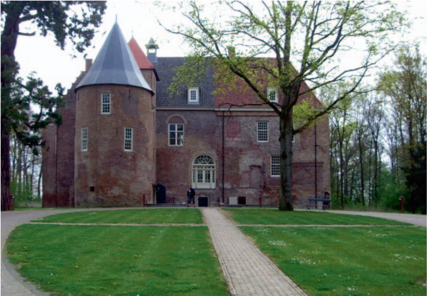
Afb. 6 Kasteel Nederhemert in herbouwde situatie (Nederhemert-Zuid, april 2008)

nische keuze is die naar de mening van hun college gerespecteerd dient te worden”. 31