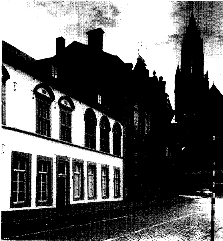
▲ Afb. 7 Spaans Gouvernement, met rechts het silhouet van de St. Janskerk.

1600 veel omvangrijker zal zijn dan tot nu toe bekend is. Hoe omvangrijk is de vraag. Grote delen zitten zoals gezegd onzichtbaar verborgen en de wel zichtbare sporen zijn bovendien nooit goed geïnventariseerd. De selectie voor de opstelling van de landelijke lijst van beschermde monumenten is voornamelijk op grond van voorgevels gemaakt.