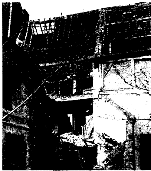
▲ Afb. 4 Verval en ondergang van het bouwarchief, Stokstraatgebied begin jaren '60.

archieven als groep van groot belang. In het kader van het project Historische Structuuranalyse Maastricht doe ik onderzoek naar de ontwikkeling van de laat middeleeuwse stad, waarvan het stratenpatroon vermoedelijk tussen 1000 en 1300 definitief vorm gekregen heeft. De hierna volgende voorlopige inventarisatie van het nog resterende deel van het bouwarchief beperkt zich tot de periode ca. 1000 tot 1600 (afb. 5).