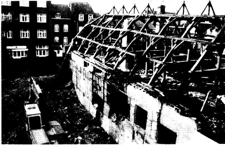
▲ Afb. 2 De noordelijke vleugel van het voormalige Witte Vrouwenklooster tijdens de sloop, oktober 1988.

bestaande vakwerkconstructie van de verdieping van de noordelijke pandhofgang. De eikehouten constructie vormde een dendrochronologisch gedateerde eenheid met het houtskelet en de kapconstructie van een haaks hierop gelegen kloostervleugel. Het vellen van de bomen voor de bouw van de constructie moet tussen 1510 en 1515 hebben plaatsgevonden. 1 Bij het onderzoek bleek ook dat onder de derde, door middel van jaartalankers 1619 gedateerde kloostervleugel, haaks op elkaar twee smalle kelders met een ten opzichte van het erboven gelegen gebouw afwijkende oriëntatie lagen. De kelders waren elk voorzien van drie gotische driepas-nissen (afb. 1). Geconcludeerd kan worden dat de kelders tot de laat middeleeuwse aanleg van het klooster behoren. Voor het overige dateerden de kloostergebouwen, op enkele 18e-eeuwse toevoegingen na, inderdaad uit de 17e eeuw 2 (afb. 2).