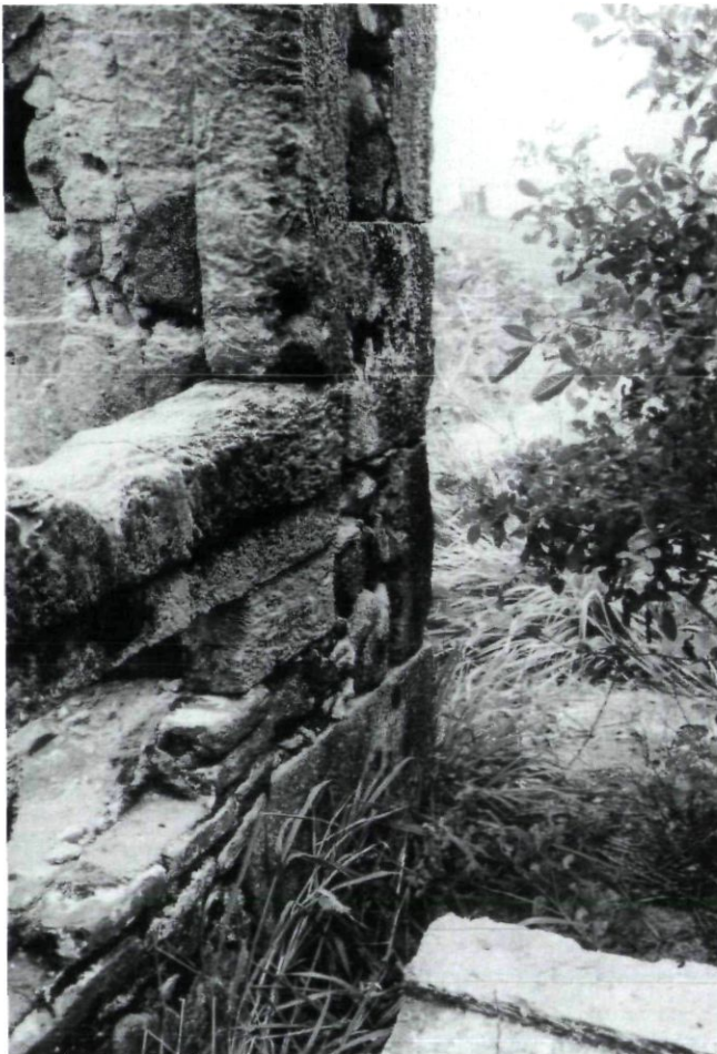
Afb. 4. Deel van een soldatenkwartier bij Fort Nazareth. Op het pad ervóór werd veel limoneta aangetroffen.

Bij de lokale bevolking zijn aan Fort Van der Dussen geen herinneringen of directe overleveringen blijven bestaan, behalve dan een brede armzwaai en een stralend: " Tudo do Tempo Holandês! ", alles uit de tijd van de Hollanders. De notie van o Tempo Holandes , de Nederlandse Periode, voedt in de Nordeste tot op heden een wijd en zijd verbreid historisch besef, dat de basis is van een specifiek identiteitsgevoel in twee staten, in de eerste plaats Pernambuco, maar ook Alagoas.