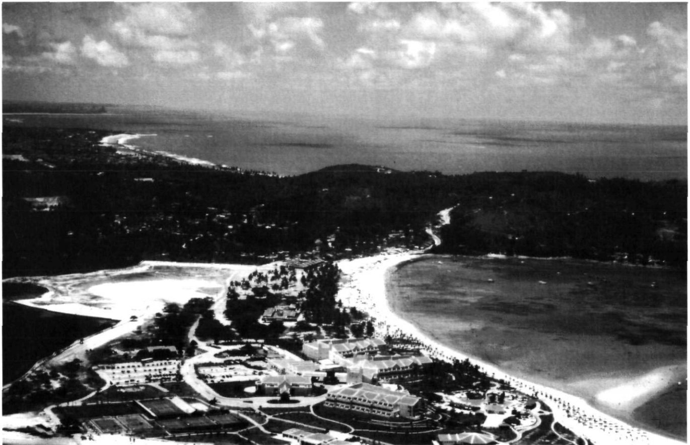
Afb. 5. Cabo de Santo Agostinho met op de voorgrond het nieuw aangelegde woonpark voor de medewerkers van de SUAPE. Rechts van de weg over de kaap ligt de landtong met de bij eb zichtbare resten van "Pontale Arx", Fort Van der Dussen.