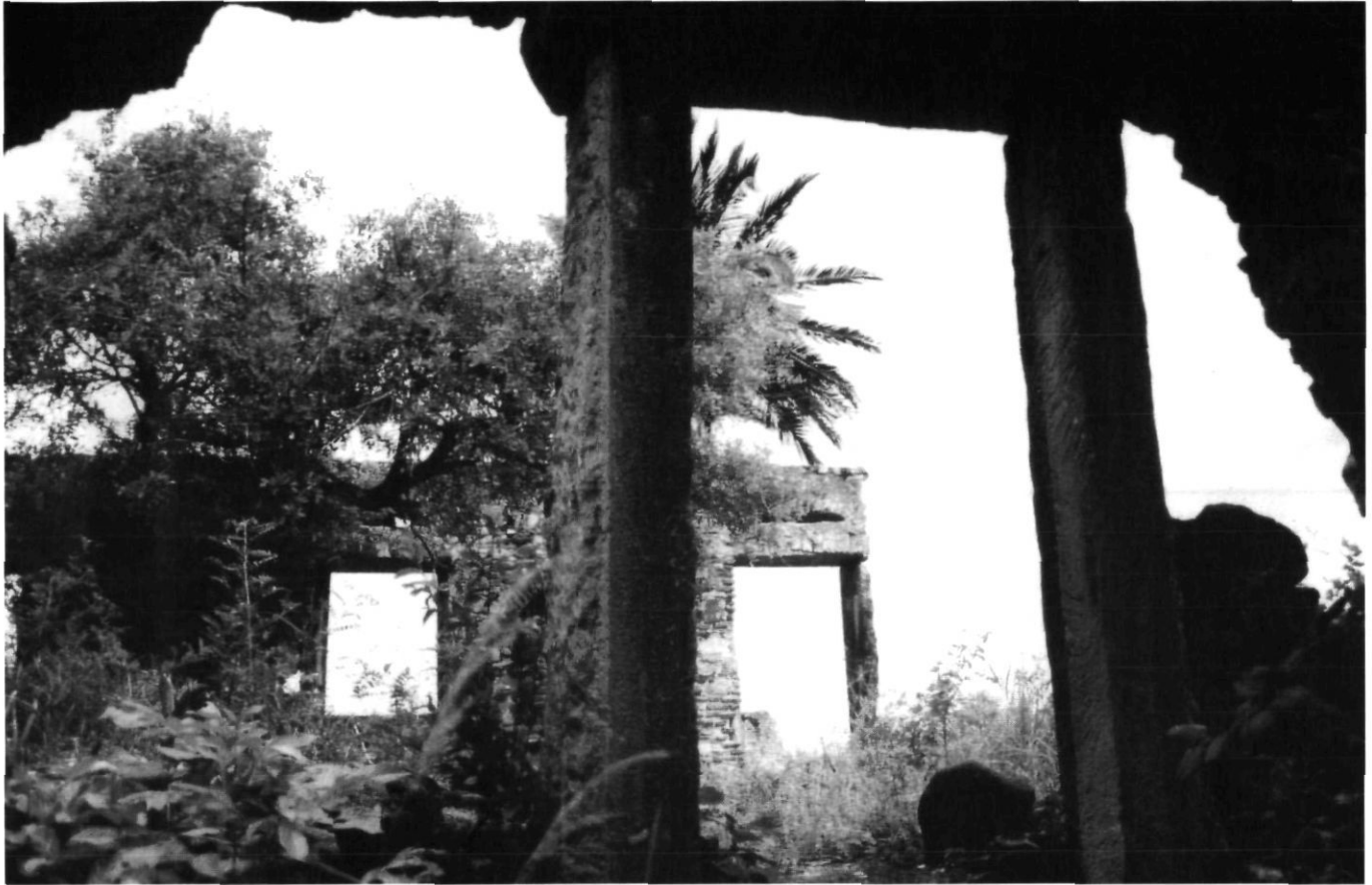
Afb. 3. In natuur- en baksteen opgetrokken resten van soldatenkwartieren behorende bij Fort Nazareth.