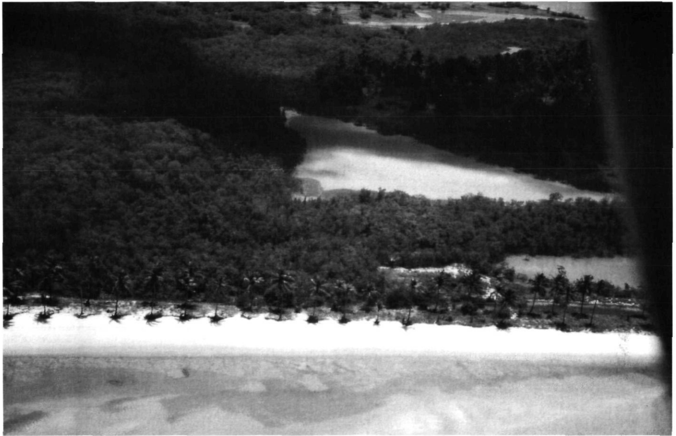
Afb. 7. Opvallend driehoekige vormen in het landschap van Ilha da Coquaia op de plek van Fort Ghijsseling.