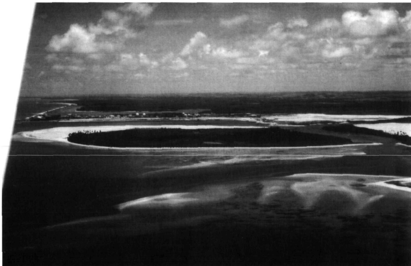
Afb. 6. Bahia Suape, met op de voorgrond Ilha da Coquaia. Op de achtergrond het nieuwe havencomplex SUAPE.

zijdige driehoek aan de kant van de kaap, daarnaast een witte, deels onbegroeide plek die een merkwaardige gelijkenis vertoonde met de plattegrond van Kyns, en tenslotte enkele ronde en min of meer rechthoekige, eveneens deels of geheel onbegroeide, roestbruine verkleuringen tegenover het rif. Archeologisch onderzoek zou zeer wenselijk zijn, met behulp van duikers, infrarood fotografie en weerstandsmeting. Haast is ook hier geboden, aangezien de uitbreidingsplannen van de SUAPE bijzonder bedreigend zijn. Als een laatste kans, om de historische aanwezigheid van ook dit Zeeuwse fort boven water te krijgen, werd de locatie van Fort Ghijsseling in het aanbevelingsrapport ten behoeve van de HGIS-C commissie (Homogene Groep Internationale Samenwerking en Cultuur van de Ministeries van Buitenlandse Zaken en Onderwijs, Cultuur & Wetenschap) in december 1999 op de derde plaats gezet, ná Fort Oranje en Forte Buraco.