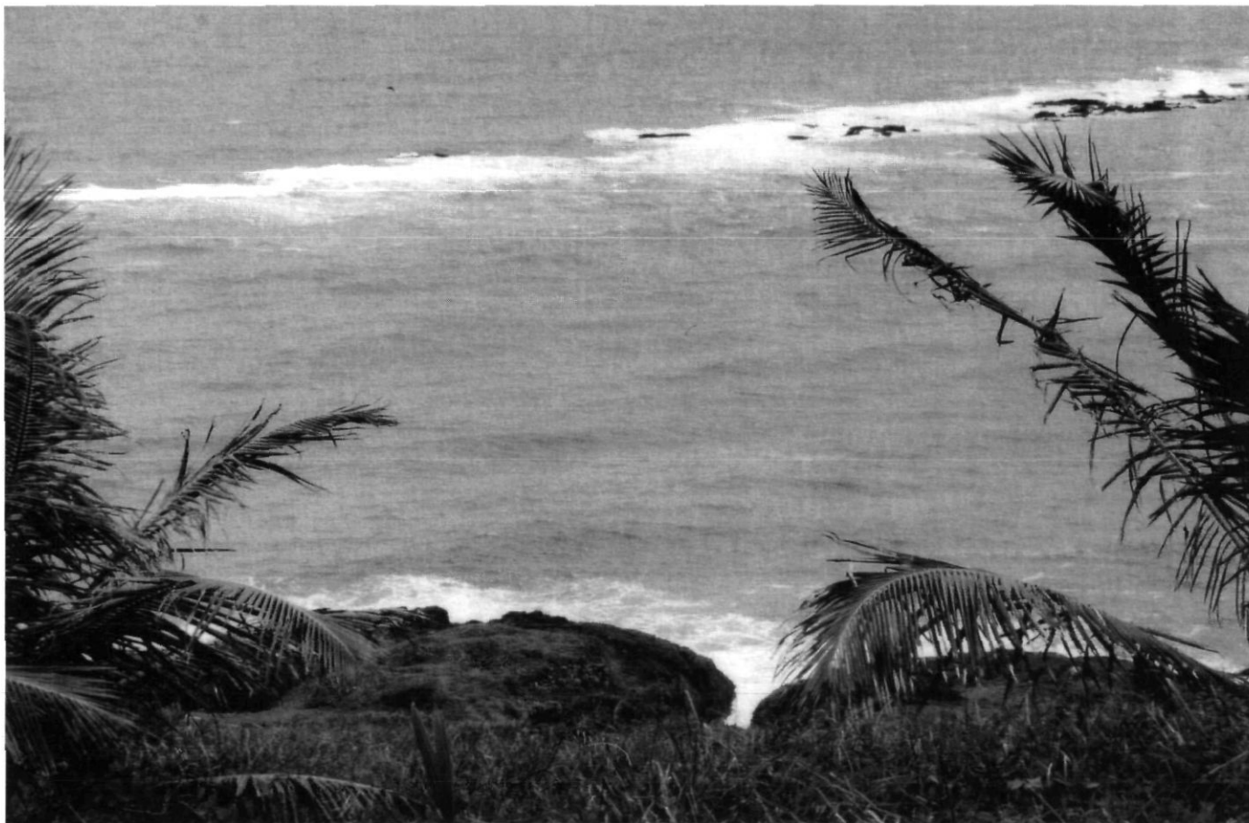
Afb. 2. Bahia de Suape met de volgens overlevering door de Hollanders gehakte doorgang in het rif (deze en de hierna volgende: foto auteur 1999)

Fort Nazareth en het gebied eromheen bleven tot 1645 onder Nederlands beheer. Dat jaar, een jaar na het vertrek van de gouverneur, was een rampjaar voor Nederlandse Brazilië. Recife werd door de Portugezen belegerd en vrijwel uitgehongerd. Mauritsstad werd grotendeels verlaten door de Hollanders en geslecht; Huis Vrijburgh, het prachtige Nassoviaanse paleis, werd van de bovenverdiepingen en van zijn