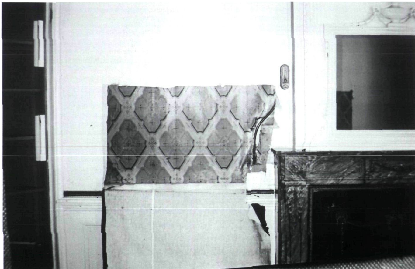
Afb. 5. Huis Sandenburg, voorkamer eerste verdieping, vrijleggen van 19de eeuws behang. Achter een nieuwe betengeling is dit behang weer verstopt.

en het ander om de hoek in de straat Grote Oost 5. In 1998 vertrok het kledingverhuurbedrijf Ridderikhoff na bijna 70 jaar uit de gebouwen, waar kledingrekken de wanden uit het zicht hielden. De panden werden aangekocht door Stadsherstel. Tijdens het bouwhistorische onderzoek van de Monumentenzorg in Hoorn werd de SHBW geraadpleegd, omdat op veel wanden papierbehangsels waren aangetroffen, aangebracht voor de komst van het kledingverhuurbedrijf, dus meer dan 70 jaar geleden.