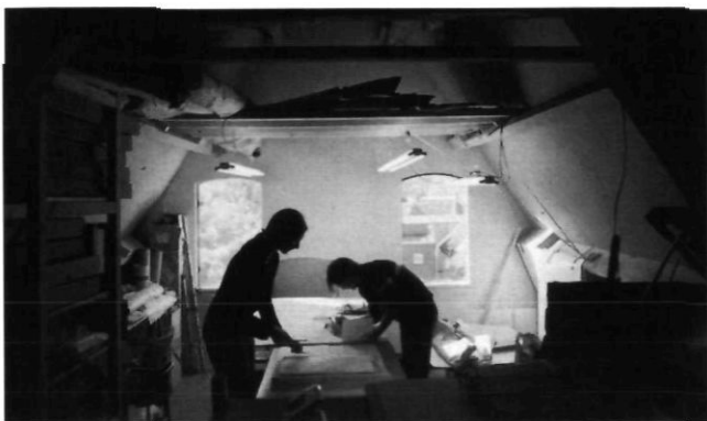
Afb. 3 en 4. De werkruimte en het depot van de Utrechtse Behang Collectie in Utrecht.