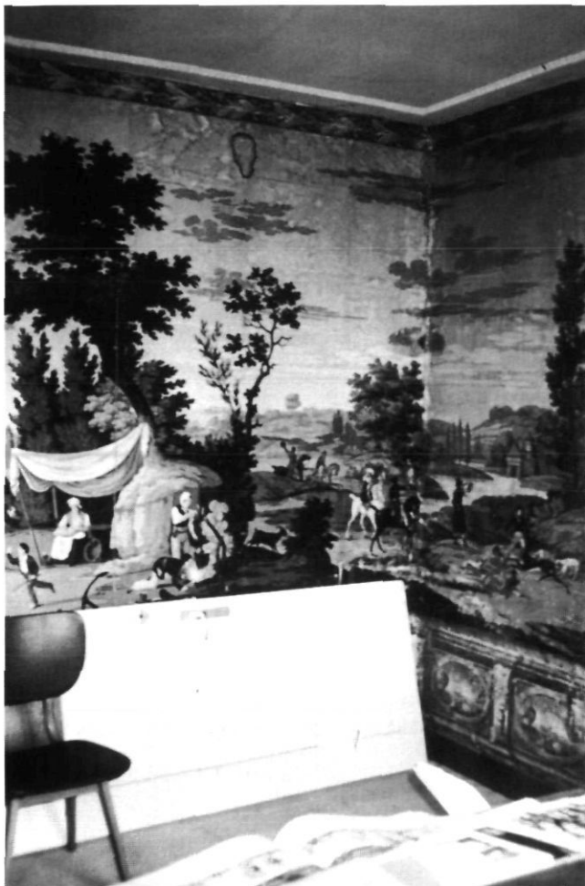
Afb. 6. Huis in het centrum van Balk, detail van papieren panorama behang 'Chasse, dite d'après Vernet'.

hier mannen te paard, en vrouwen en kinderen wachtend, zich vermakend in de schaduw. Onder het panorama is een papieren lambrizing versierd met trompe l'oeuilles met zeegezichten in de ovalen. Het behangsel is gemaakt in het midden van de 19 de eeuw door middel van een tijdrovend handmatig productieproces met handgesneden drukblokken, waarbij voor iedere kleur of drukgang een ander blok moest worden gesneden. Dat komt neer op veel drukblokken voor circa twee meter hoogte en verschillende meters breed. Op drie wanden is het panorama aangebracht, waarbij er geen herhaling in het patroon plaats vindt. Door het tijdrovende productieproces was dit een duur, maar ook begeerd behang. Het is onduidelijk hoeveel van deze behangsel in Nederland aanwezig zijn geweest op het hoogtepunt in de 19 de eeuw. Nu zijn er nog maar drie andere van deze kamervullende kamerbehangsels bekend, waarvan een in een herenboerderij in Noord Groningen met dezelfde voorstelling, daarnaast bevindt zich nog een enkel stuk in musea. Dit maakt het behang in de kamer in Balk tot een uniek geheel, kwetsbaar, maar als onderdeel van een Rijksmonument hopelijk goed beschermd. 5