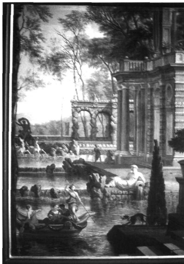
Afb. 7. Wandbespanningen geschilderd door Isaac de Moucheron na 1730 Herengracht 475, Amsterdam.

Aangezien de waarde van papierbehangsels niet altijd onderkend werd en wordt, onbekend maakt immers onbemind, kan het behang vogelvrij zijn. Bij iedere wisseling van eigenaar is er een grote kans dat behangen afgenomen zullen worden en zullen eindigen op een container en daarmee voorgoed verdwijnen, tenzij toevallig op het goede moment een shbw-ertje langs komt fietsen. Het is daarom ook belangrijk dat bouwhistorici en schilders, vaak de eersten die een oud pand betreden voordat definitieve ingrepen worden gedaan, op de hoogte zijn van wat ze tegenkomen, of dit makkelijk terug kunnen vinden.