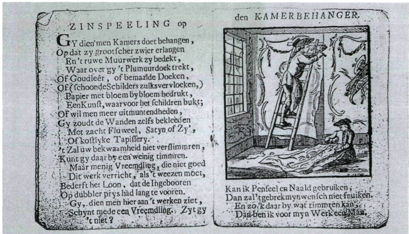
Afb. 1. 'De kamerbehangen', druk, ca. 1830. Het prentje wordt door de SHBW gebruikt als beeldmerk.

Nu wordt op verschillende manieren kennis verzameld en verspreid. Dit gebeurt onder andere via een twee maal per jaar uitgegeven nieuwsbrief, excursies naar huizen in heel Nederland en het geven van gerichte informatie als om expertise of advies wordt gevraagd. Ook worden bijdragen geleverd aan artikelen in de media, bijvoorbeeld aan tijdschriften, om zo de kennis van historische behangsels verder te verspreiden dan de beperkte kring van donateurs en professioneel geïnteresseerden. Het is de bedoeling dat binnenkort via internet op www.historischebehangsels.nl ook informatie over de SHBW te vinden zal zijn. Mensen weten de SHBW